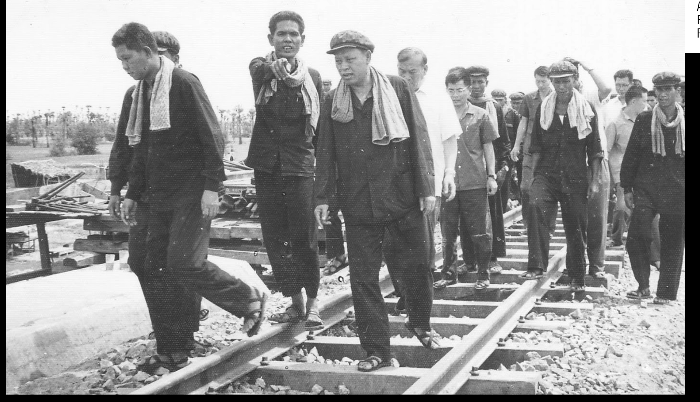
(រូបទី១ ) ខាងធ្វេង ៖ វន វ៉េត ឧបនាយករដ្ឋមន្ត្រី រដ្ឋមន្ត្រីក្រសួងសេដ្ឋកិច្ច, (រូបទី៣ )ខាងធ្វេងលើកដៃចង្អុល ៖ មី ប្រាង ប្រធានគណៈកម្មការ គមនាគមន៍, (រូបខាងធ្វេង )ទី៤ ៖ អៀង សារី, រូបខាងក្រោយអៀង សារី ពាក់អាវស ៖ ឧត្តមសេនីយ៍ តឹង ឃុនសាន ប្រធានក្រុមជំនាញការចិន ប្រចាំនៅកម្ពុជាប្រជាធិបតេយ្យ, រូបពាក់វ៉ែនតាឈរនៅពីក្រោយឧត្តមសេនីយ៍ តឹង ឃុនសាន ៖ មិត្តស៊ូ (ជនជាតិចិន ) អ្នកបកប្រែ (First from left): Vorn Vet, Deputy Prime Minister and Minister of Commerce, (Third from left), pointing finger: Mei Prang, Chief of the Communication nmittee, (Fourth from left): leng Sary, (Behind leng Sary), white shirt: General Deng Khun San, Head of Chinese experts to Cambodia during DK of Pol Pot. Wearing glasses and standing behind the General: Comrade Su (Chinese), translator