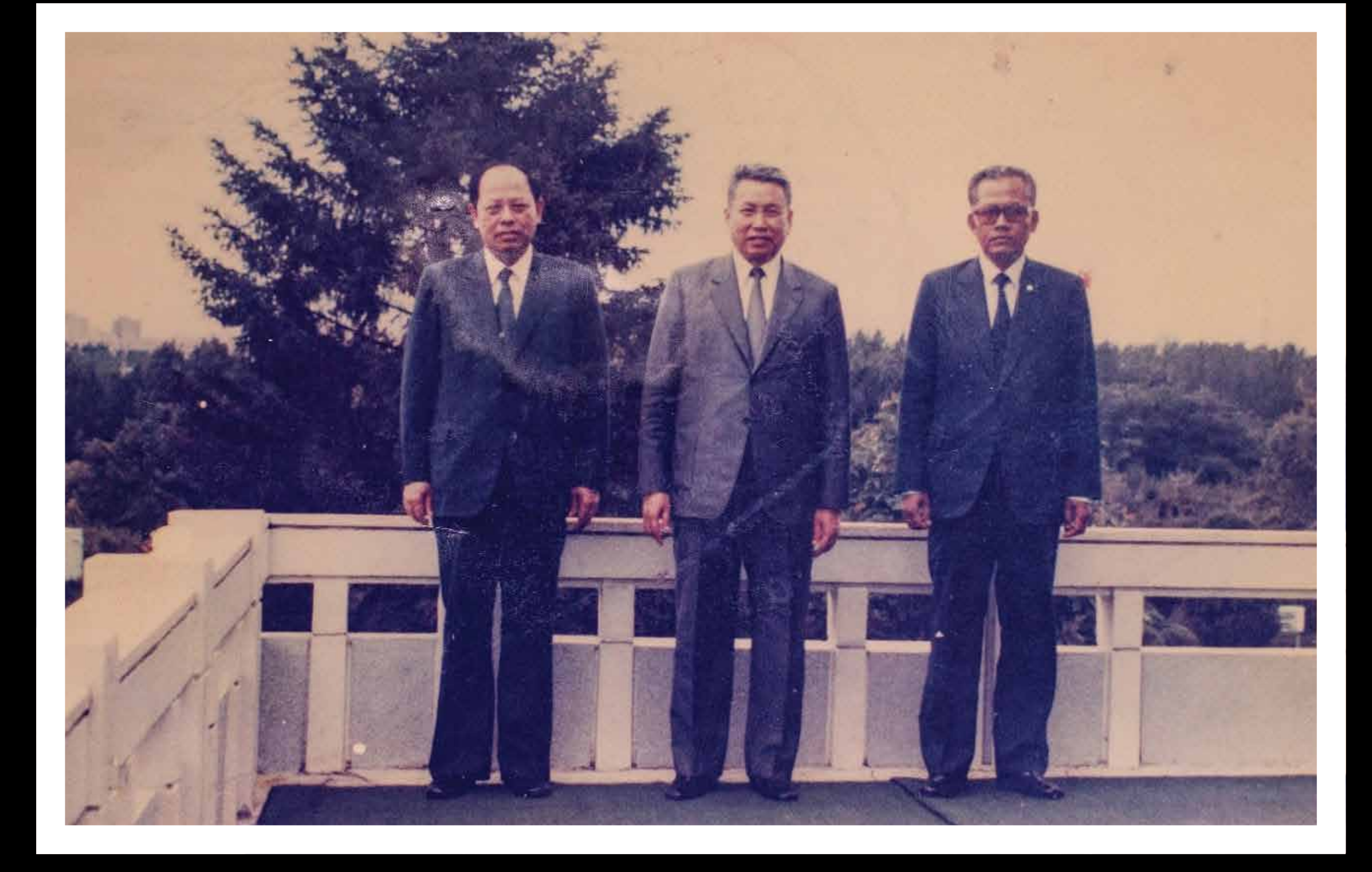
អៀង សារី (រូបខាងធ្វេងទី១), ប៉ុល ពត (រូបកណ្តាល), សុន សេន (រូបខាងស្តាំ) leng Sary (Left), Pol Pot (Center), Son Sen (Right)