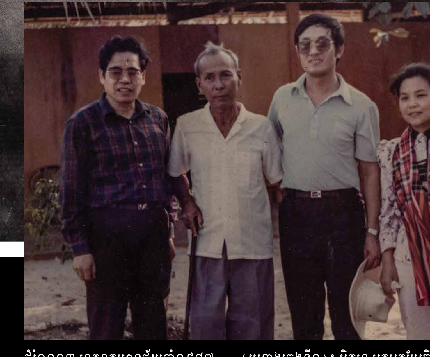
(រូបខាងស្តាំទី១) ៖ អ្នកចម្រៀងឈ្មោះ សែម ក្រសួងឃោសនាការ, (រូបខាងស្តាំទី៣) ៖ អៀង ធីរិទ្ធ រដ្ឋមន្ត្រីក្រសួងសង្គមកិច្ច First from right: Sem, singer from Ministry of Propaganda Third from right: leng Thirith, Minister of Social Affairs