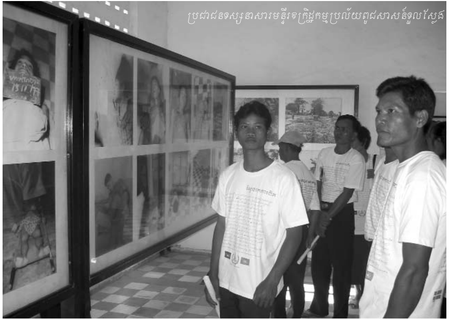
ប្រជាជនស្រុកស្រែក្រវាត់ ទិញទិញប្រល័យពូជសាសន៍ នៃខ្មែរក្រហម

បច្ចុប្បន្ននេះ អង្គជំនុំជម្រះវិសាមញ្ញក្នុងតុលាការកម្ពុជា កំពុងសំណុំរឿងចោទប្រកាន់ មេដឹកនាំជាន់ខ្ពស់ ខ្មែរក្រហម និងជនទាំងឡាយ ដែលទទួលខុសត្រូវខ្ពស់បំផុត ចំពោះទង្វើក្របកម្ម ដែល បានកើតឡើងក្នុងរយៈកាលនៃកម្ពុជាប្រជាធិបតេយ្យ រវាងឆ្នាំ ១៩៧៥ និងឆ្នាំ ១៩៧៩ ។ ក្នុង កាលៈទេសៈនេះ ការលើកឡើងដំណើរដីចិត្ត គឺស្របច្បាប់ និងត្រូវបាន ជំរុញឡើង ។ នេះអាចធ្វើឱ្យខូចផលអត្ថន័យ នៃយុត្តិធម៌ពិតប្រាកដ ប្រសិនបើមានការពន្យល់ច្បាស់លាស់ទេនោះ ។