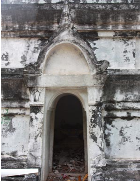
បណ្ណាល័យរបស់វត្តភ្នំ ដែលខ្មែរក្រហមប្រើជាទីស្នាក់ការមន្ទីរពេទ្យ កន្លែងតម្កល់ស្នូល