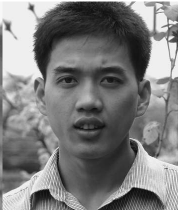
ចាន ច្រាថ្នា

ជ័យទត្ត ទទួលបាន បរិញ្ញាប័ត្រច្បាប់ ពីសាកល វិទ្យាល័យភូមិន្ទនីតិសាស្ត្រ និងវិទ្យាសាស្ត្រសេដ្ឋកិច្ច ។ ជ័យទត្ត ជាអតីតជ័យលាភី ថ្នាក់ជាតិនៅក្នុងការប្រកួត សវនាការប្រឌិត ឆ្នាំ២០១០ ។ នៅកម្ពុជា ។