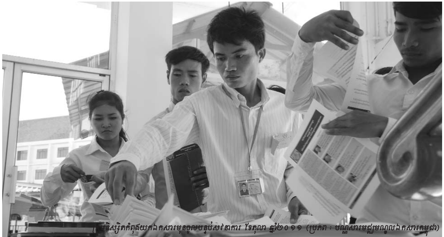
សិស្សទឹកកំពុងយកកំសារមុនចូលបន្ទប់សវនាការ ខែតុលា ឆ្នាំ២០១១

នៅក្នុងសប្តាហ៍បន្ទាប់នៃការលាវែងពីមុខនាទីរបស់ សហចៅក្រមស៊ើបអង្កេតអន្តរជាតិ លោក ស៊ីកហ្គ្រេង ប៊ូដ (Siegfried Blunk) អង្គការសហប្រជាជាតិបានបញ្ជូនអគ្គលេខា ធិការរងអង្គការសហប្រជាជាតិទទួលបន្ទុកផ្នែកកិច្ចការច្បាប់មក ធ្វើទស្សនកិច្ចនៅប្រទេសកម្ពុជាដើម្បីស្វែងរកដំណោះស្រាយ មួយចំពោះរឿងសាលាក្តីខ្មែរក្រហម ។ កាលពីថ្ងៃព្រហស្បតិ៍ ទី២០ ខែតុលា ឆ្នាំ ២០១១ លោក ស្រី ប៉ាទ្រីស្យា អូប្រាយអិន (Patricia O'Brien) ដែលជាអគ្គលេខាធិការរងអង្គការសហប្រជា