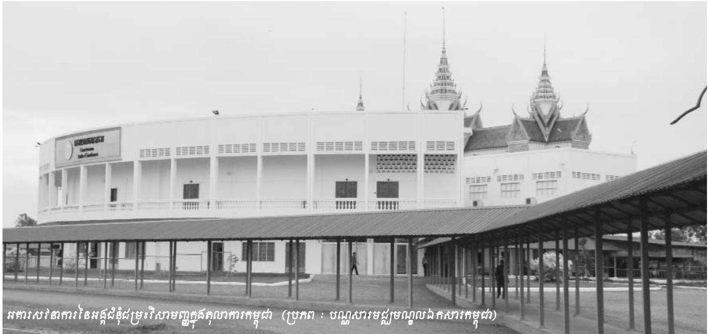
អគារសវនាការនៃអង្គជំនុំជម្រះវិសាមញ្ញក្នុងតុលាការកម្ពុជា

ប្រភពថវិកាដែលនឹងត្រូវយកមកអនុវត្តគម្រោងសំណងក្រៅប្រព័ន្ធតុលាការនេះទៀតសោតបានក្លាយទៅជាបន្ទុកថ្មីមួយបន្ថែមលើអង្គការកំពារជនរងគ្រោះ ។ ដូច្នេះអង្គការកំពារជនរងគ្រោះ ចាំបាច់ត្រូវតែស្វែងរកថវិកានិងការសម្របសម្រួលពីរាជរដ្ឋាភិបាល អង្គការមិនមែនរដ្ឋាភិបាល និងដៃគូម្ចាស់ជំនួយនានាដើម្បីឲ្យការអនុវត្តគម្រោងទាំងនេះអាចឆ្លើយតបទៅនឹងតម្រូវការរបស់ជនរងគ្រោះនិងដើមបណ្តឹងរដ្ឋប្បវេណីឲ្យបានកាន់តែឆាប់រហ័ស ។