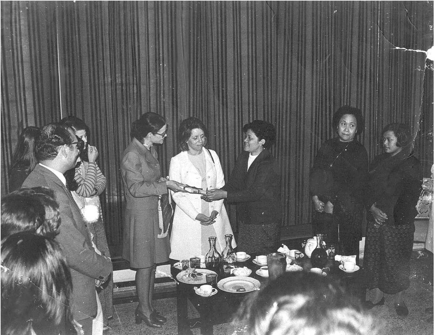
អៀង ធីរិទ្ធ ជួបគណៈប្រតិភូស៊ីយែម ក្នុងរបបកម្ពុជាប្រជាធិបតេយ្យ