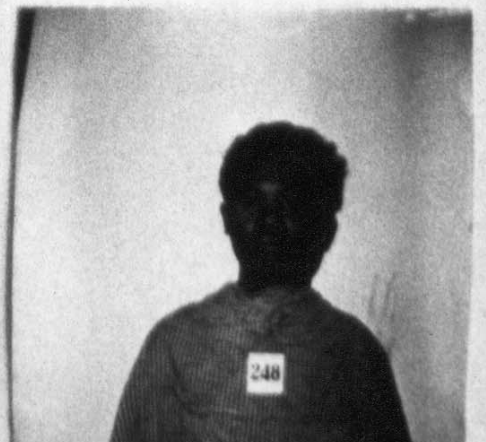
អ្នកទោសនៅមន្ទីរស-២១