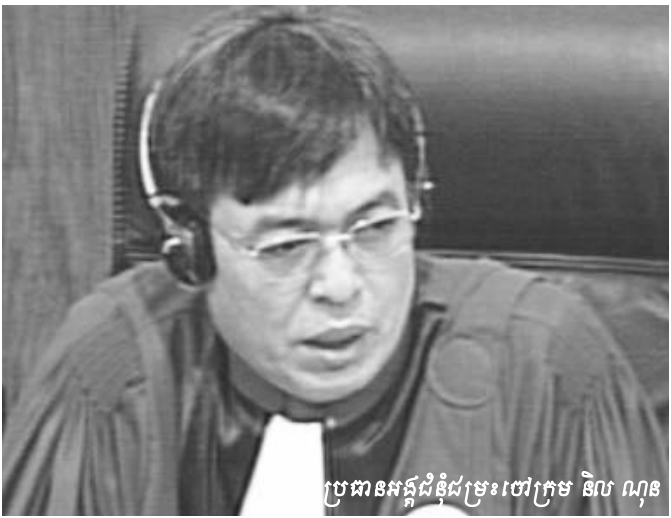
ប្រធានអង្គជំនុំជម្រះចៅក្រម និង លោក