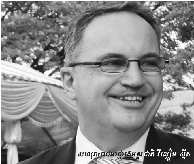
សហព្រះរាជអាជ្ញាអន្តរជាតិ វីល្យែម ស្មីត

◆ ឧបសម្ព័ន្ធ A2 ឯកសារទាក់ទងនឹងអត្ថបទបោះពុម្ពផ្សាយនិងសេចក្តីណែនាំរបស់បក្សកុម្មុយនីស្តកម្ពុជា ។