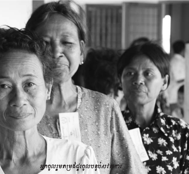
អ្នកចូលរួមកម្រិតដូចលម្អិតរបស់វិសាមញ្ញ

មេធាវីការពារក្តីជារៀងត្រឹមត្រូវ ព្រោះមេធាវីការពារក្តីមាន សិទ្ធិតវ៉ាចំពោះភាពទទួលយកបាននៃភស្តុតាងដោយលោកមេធាវី បានលើកឡើងពីយុត្តិសាស្ត្រអន្តរជាតិ ដែលមាននៅក្នុងរឿងក្តី ប្រលឹក ។ លោកមេធាវីបានបន្ថែមថា ក្រុមមេធាវីការពារក្តីនឹង បាត់បង់នូវវេលាប្រយោជន៍ ប្រសិនបើមេធាវីការពារក្តីត្រូវបន្ត ឲ្យប្រើប្រាស់ពេលវេលាដែលអង្គជំនុំជម្រះផ្តល់ឲ្យសម្រាប់ដេញ ដោលធ្វើការបង្ហាញពីយថាភាព ឬភាពត្រូវឲ្យជឿជាក់បាននៃ ឯកសារដែលខ្លួនបានជំទាស់នោះ ។ ការបង្ហាញពីយថាភាព ភាព ត្រូវឲ្យជឿជាក់ និងតម្លៃនៃភស្តុតាង គឺជាការកិច្ចរបស់សហព្រះរាជ អាជ្ញា ដើម្បីបញ្ជាក់ជូនអង្គជំនុំជម្រះ និងកោះហៅសាក្សីដែល ពាក់ព័ន្ធមកធ្វើការបញ្ជាក់បន្ថែម ។