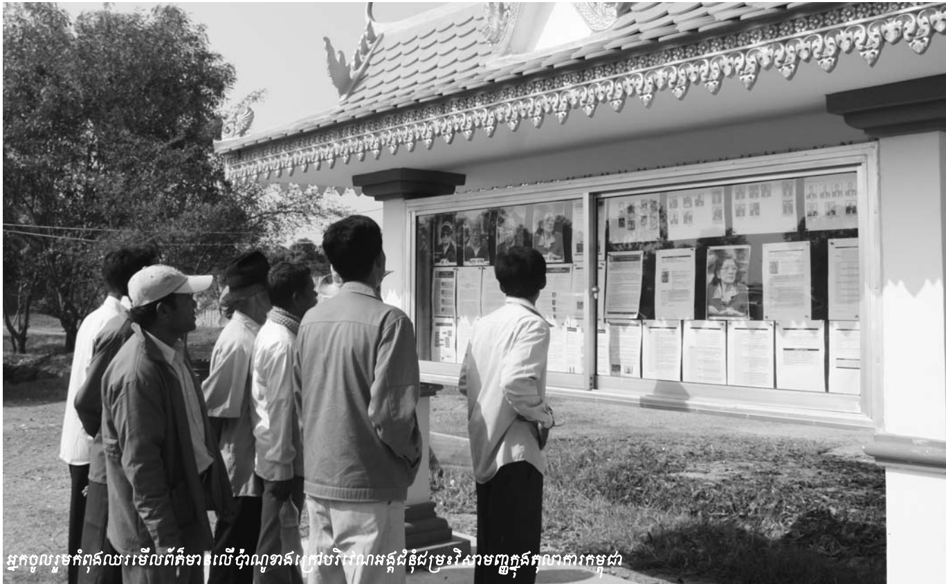
អ្នកចូលរួមកំពុងឈរមើលព័ត៌មានលើប៉ាន់ប្រាប់អំពីសេចក្តីណែនាំនិងសម្រេចរបស់ក្រុមប្រឹក្សាសេដ្ឋកិច្ចកម្ពុជា

ពាក់ព័ន្ធនឹងឯកសារដែលមាននៅក្នុងឧបសម្ព័ន្ធ A3 តំណាង សហព្រះរាជអាជ្ញាអន្តរជាតិ លោក វ៉ាន់សង់ វាយន់ ដេស្វាល បានឆ្លើយតបទៅនឹងការជំទាស់របស់ក្រុមមេធាវីការពារក្តីទាំងបី ក្រុមថា ការលើកឡើងរបស់ក្រុមមេធាវីការពារក្តីដែលស្នើសុំឱ្យ