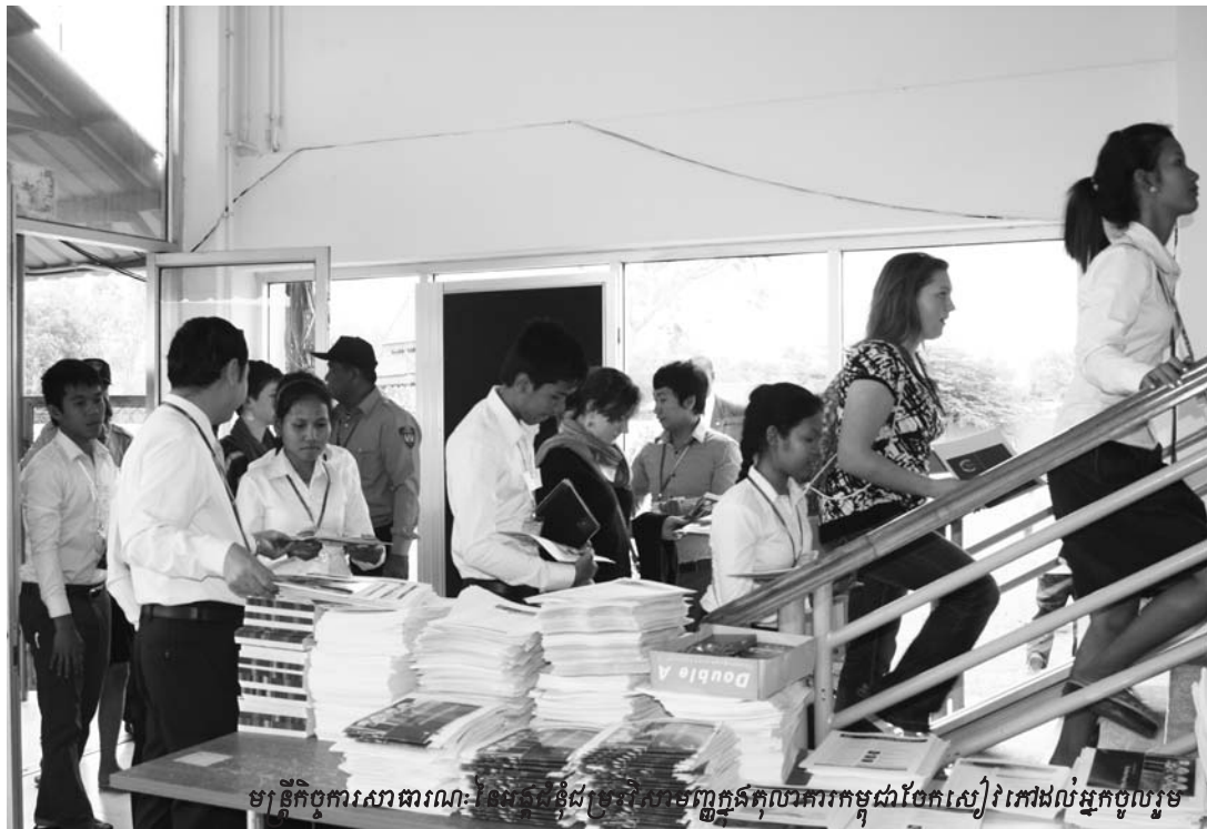
មន្ត្រីកិច្ចការសារពារណៈដែលជំនុំជម្រះសហមេធាវីក្នុងតុលាការកម្ពុជាចែកសៀវភៅដល់អ្នកចូលរួម

ការតវ៉ាចំពោះភស្តុតាងដែលបានដាក់ជូនអង្គជំនុំជម្រះដោយ សហព្រះរាជអាជ្ញា ។ ទី២ គឺពាក់ព័ន្ធនឹងទំហំ និងលក្ខណៈនៃឯកសារ ដែលដាក់ជូនអង្គជំនុំជម្រះដោយសហព្រះរាជអាជ្ញា ។ សហព្រះរាជ អាជ្ញាបានដាក់ឯកសារជាច្រើនចូលក្នុងសំណុំរឿងនៅដំណាក់ កាលដំបូង ប៉ុន្តែតាមការពិភាក្សានិងឯកសារតិចតួចប៉ុណ្ណោះដែល ទាក់ទងនឹងសវនាការវគ្គដំបូងនេះ ។ ដូច្នេះក្រុមមេធាវីការពារក្តី ស្នើសុំឲ្យអង្គជំនុំជម្រះធ្វើការកម្រិតតែឯកសារណាដែលពាក់ព័ន្ធ នឹងអង្គហេតុនៅក្នុងសវនាការដំណាក់កាលដំបូងនេះ ដើម្បីឲ្យមាន ភាពងាយស្រួលក្នុងការយកមកដេញដោលនៅក្នុងសវនាការ ។