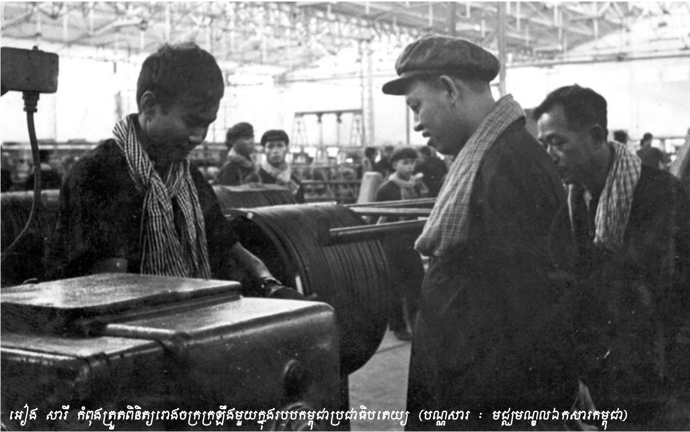
អៀង សារី កំពុងត្រួតពិនិត្យរោងចក្រក្រឡឹងមួយក្នុងរូបបកមុខជាប្រជាធិបតេយ្យ

ទោះបីជាយ៉ាងណាក្តី ចាប់តាំងពីខែកញ្ញា ឆ្នាំ២០០៧ សំណុំ រឿង០០៣ និង០០៤ បានត្រូវទុកចោលនៅក្នុងការិយាល័យ សហចៅក្រមស៊ើបអង្កេត ដោយពុំមានជនសង្ស័យណាម្នាក់ត្រូវ បានកំណត់អត្តសញ្ញាណជាដូវការ ឬក៏ត្រូវបានចាប់ខ្លួនឡើយ ។ ខុសក្នុងចម្បងដែលត្រូវបានមើលឃើញ គឺដោយសារសហ ព្រះរាជអាជ្ញាជាតិ សហចៅក្រមស៊ើបអង្កេតជាតិ និងចៅក្រម ជាតិនៃអង្គបុរេជំនុំជម្រះទាំងអស់បានចេញសេចក្តីសម្រេចស្រប គ្នា រារាំង និងប្រឆាំងនឹងកិច្ចប្រឹងប្រែងរបស់សហភាពអន្តរជាតិ