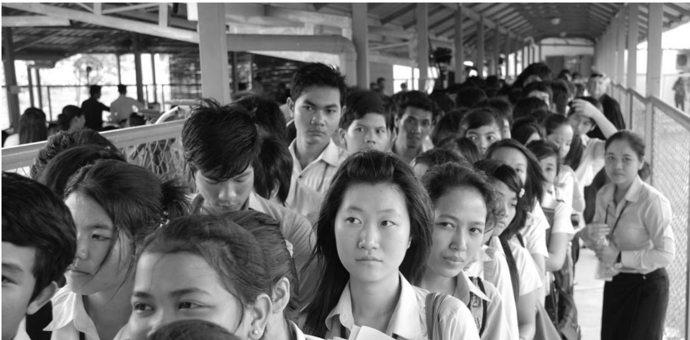
សិស្សកំពុងតម្រង់ជួរចូលក្នុងសាលសវនាការនៃសាលាក្តីខ្មែរក្រហម

អ្នកទទួលខុសត្រូវខ្ពស់បំផុតចំពោះទ្រឹក្សកម្ម ដែលបានប្រព្រឹត្តនៅក្នុងរបបនោះ ។ តុលាការនេះក៏បង្កើតឡើងក្នុងគោលបំណងលើកកម្ពស់វប្បធម៌ទប់ស្កាត់ មិនឲ្យមានសាជាថ្មីនៃទ្រឹក្សកម្មយ៉ាងព្រៃផ្សៃបែបនេះនៅគ្រប់ទិសទីលើពិភពលោក និងក្លាយទៅជាតុលាការកម្ពុជាសម្រាប់ប្រព័ន្ធយុត្តិធម៌ប្រទេសកម្ពុជា និងក្នុងសកលលោកទាំងមូល ។ វិធានផ្ទៃក្នុងនៃសាលាក្តីកាត់ទោសខ្មែរក្រហមបានអនុញ្ញាតឲ្យជនរងគ្រោះមានសិទ្ធិចូលរួមក្នុងកិច្ចដំណើរការនីតិវិធីតាមរយៈការសុំតាំងខ្លួនជាដើមបណ្តឹងរដ្ឋប្បវេណី ដើម្បីចូលរួមកំរិតដល់ការចោទប្រកាន់ក្នុងដំណើរការនីតិវិធីព្រហ្មទណ្ឌប្រឆាំងនឹងបុគ្គលទាំងឡាយ ដែលទទួលខុសត្រូវចំពោះទ្រឹក្សកម្មនៅរបបកម្ពុជាប្រជាធិបតេយ្យ និងដើម្បីទទួលបាននូវសំណង ។ កូរបញ្ជាក់ថា ការផ្តល់សេវាកម្មរបស់ដើមបណ្តឹងរដ្ឋប្បវេណីមានលក្ខណៈខុសពីសាក្សី ។