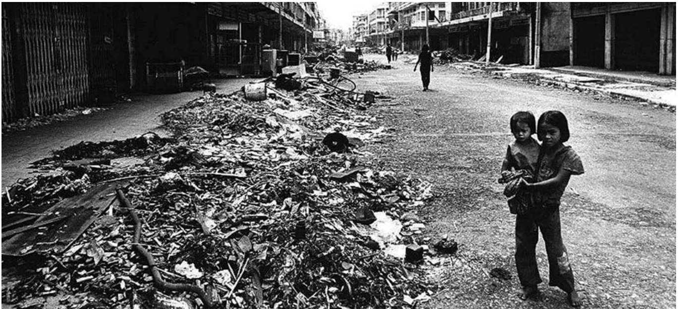
កុមារីម្នាក់កំពុងចិញ្ចឹមស្រីរបស់ខ្លួនដើរលេងក្បែរលំនៅដ្ឋានដែលត្រូវបានបំផ្លាញដោយរបបខ្មែរក្រហម ។ រូបនេះថតក្នុងឆ្នាំ១៩៧៩ នៅម៉ុងហ្គូលី ។

ចំណែកក្រុមមេធាវីការពារក្តីជនជាប់ចោទ ខៀវ សំផន ស្នើសុំឱ្យយ៉ាងណាឱ្យសំណុំរឿង០០២/០២ គ្រប់ដណ្តប់ទៅលើគ្រប់បទចោទប្រកាន់ទាំងអស់ដែលមាននៅក្នុងដីកាដោះស្រាយដែល មិនទាន់ត្រូវបានយកមកជំនុំជម្រះនៅក្នុងសំណុំរឿង០០២/