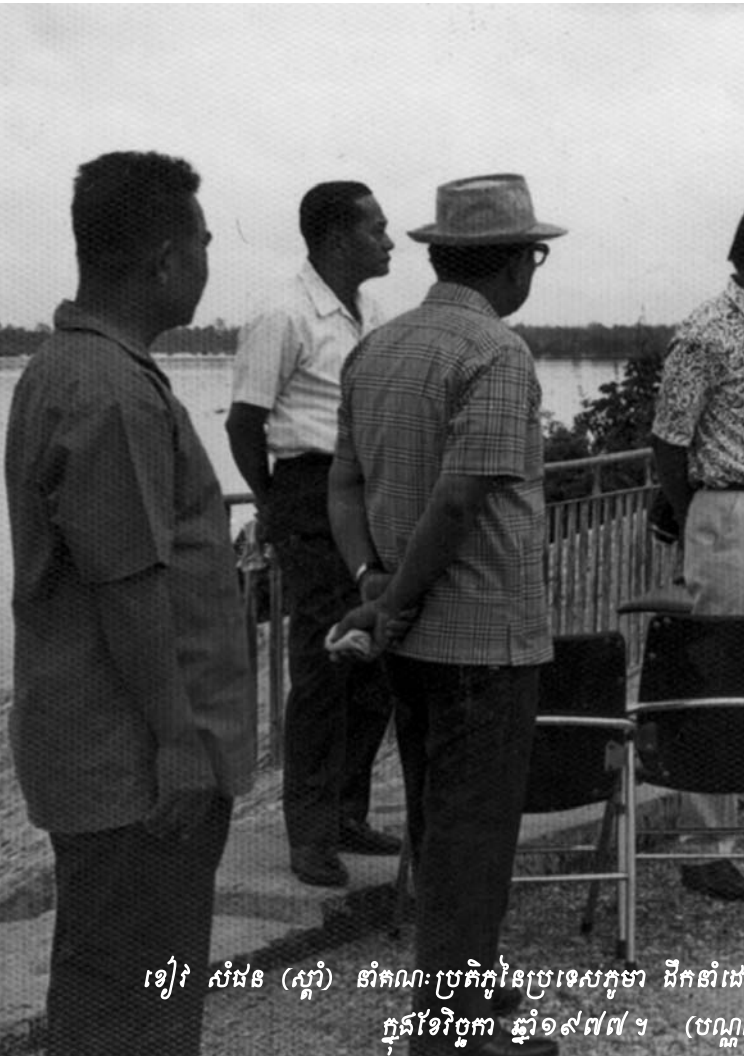
ខៀវ សំផន (ស្តាំ) ពិគ្រោះប្រតិភូនៃប្រទេសកូម៉ា ដឹកនាំដេក្នុងខែវិច្ឆិកា ឆ្នាំ១៩៧៧ ។ (បណ្តា)

៨ ដដែល ដូចខាងលើ ។ ៩ LAUREN CROTHERS និង PHORN BOPHA, ការសែត ឌី ខេមបូឌា ដេលី, “Khmer Rouge War Crimes Suspect Sou Met Dead” ចុះថ្ងៃទី២៧ ខែមិថុនា ឆ្នាំ២០១៣ ។ អត្ថបទនេះអាចរកបានតាមរយៈគេហទំព័រ http://www.cambodiadaily.com/archives/khmer-rouge-war-crimes-suspect-sou-met-dead-32184/ ១០ Julia Wallace, ការសែត ឌី ខេមបូឌា ដេលី, “Judge Removes Case 003