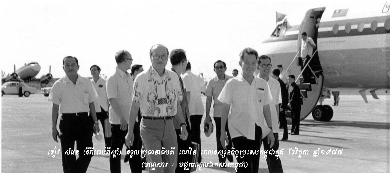
ខៀវ សំផន (ទីពីររាប់ពីស្តាំ) ទទួលប្រធានាធិបតី ណេវិន ពេលទស្សនកិច្ចប្រទេសកម្ពុជាក្នុង ខែវិច្ឆិកា ឆ្នាំ១៩៧៧