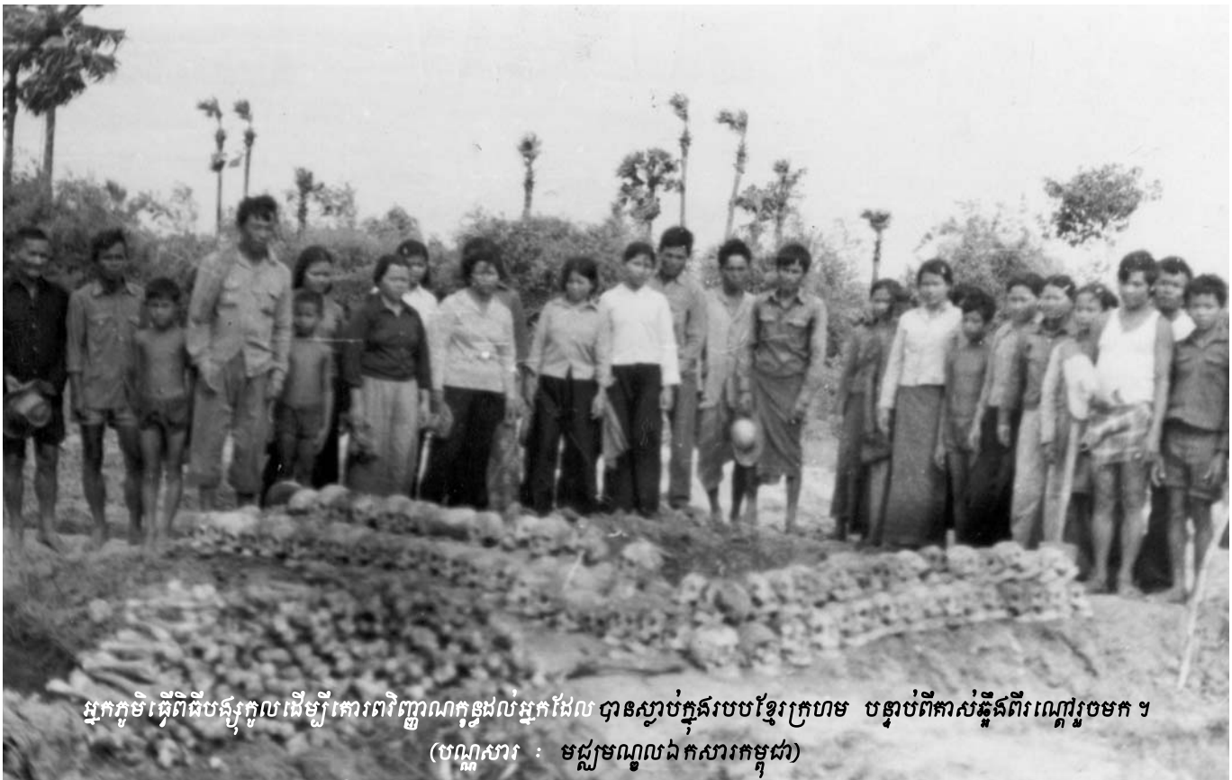
អ្នកភូមិធ្វើពិធីបង្កុំកូលដើម្បីគោរពវិញ្ញាណក្ខន្ធដល់អ្នកដែលបានស្លាប់ក្នុងរបបខ្មែរក្រហម បន្ទាប់ពីកាសន្និដ្ឋានពីរណ្តៅរួចមក ។

យោងតាមដីកាសន្និដ្ឋានបញ្ជូនរឿងឲ្យស៊ើបសួរលើកទី២ សហព្រះរាជអាជ្ញាធ្វើការបញ្ជាក់ដូចតទៅ : កងទ័ពបដិវត្តន៍កម្ពុជា កងទ័ពជើងទឹកកម្ពុជាប្រជាធិបតេយ្យ និងកងទ័ពអាកាសកម្ពុជាប្រជាធិបតេយ្យបានបោសសម្អាតកងពលយោធា ។ មនុស្សដែលត្រូវបានបោសសម្អាតត្រូវបានចាប់ខ្លួនតាមអំពើចិត្ត ដាក់ឃុំឃាំងដោយខុសច្បាប់ ធ្វើពុករលួយ ធ្វើមនុស្សឃាត និងទទួលរងពលកម្មដោយបង្ខំ ។ កម្មករ អ្នកសេវាទ និងប្រជាជនដែលត្រូវបានសម្លាប់ថាជា “ជនក្សត្រ” ជនបរទេស (លោក