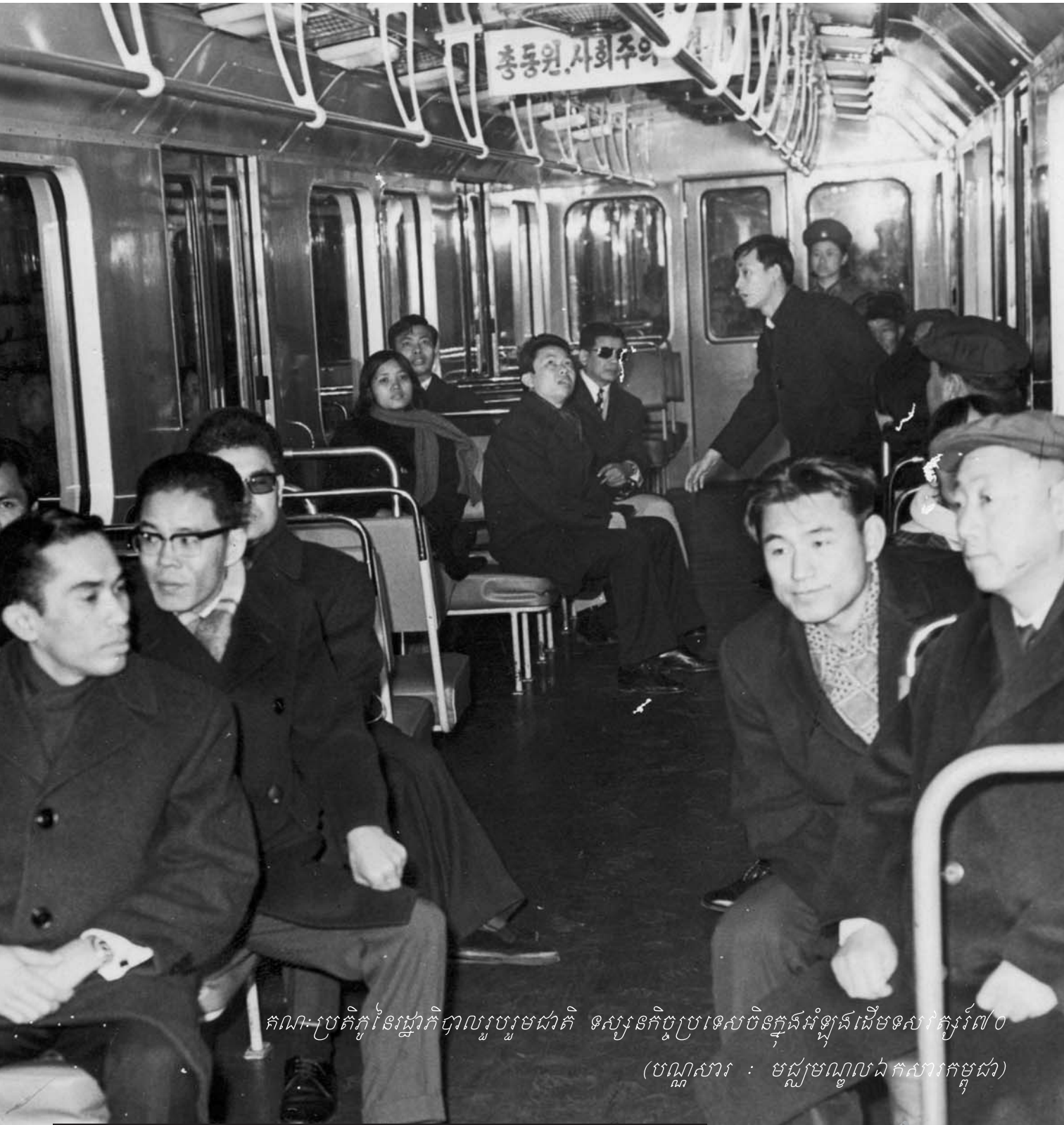
គណៈប្រតិភូនៃរដ្ឋាភិបាលប្រឡូមជាតិ ទស្សនកិច្ចប្រទេសចិនក្នុងអំឡុងដើមសេវាភ្នំរ័ល