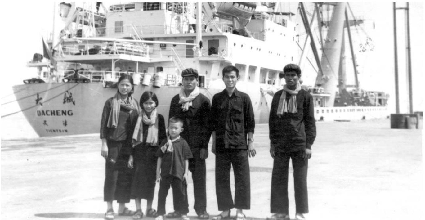
កម្មាភិបាលខ្មែរក្រហម២៧នាក់នៅមុននាវាកងទ័ពជើងទឹករបស់ចិន នៅកំពង់ផែកំពង់សោម

ក្រុមមេធាវីដើមបណ្តឹងរដ្ឋប្បវេណីបង្ហាញជំហរជំទាស់ យ៉ាងខ្លាំង ចំពោះការប៉ុនប៉ង របស់ភាគី ណាមួយ ឬអង្គជំនុំជម្រះ ទម្លាក់ចោលនូវបទចោទប្រកាន់ ឬទីតាំងទុក្រិដ្ឋកម្មដែលពាក់ព័ន្ធ ចេញពីសំណុំរឿង ០០២/០២ ។ បើយោងតាមការលើកឡើង របស់ក្រុមមេធាវីដើមបណ្តឹងរដ្ឋប្បវេណី ការសម្រេចទម្លាក់ចោល បទចោទប្រកាន់ ឬទីតាំងទុក្រិដ្ឋកម្មណាមួយ នឹងធ្វើឲ្យប៉ះពាល់ដល់