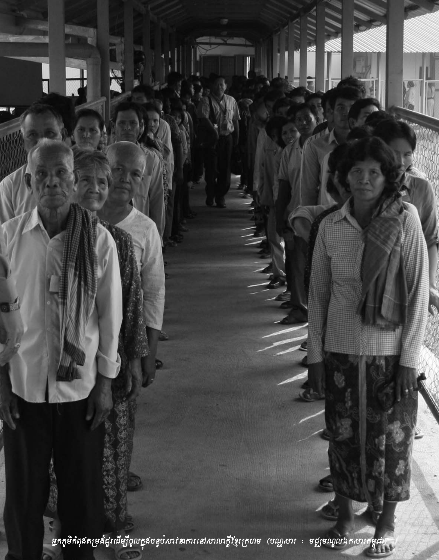
អ្នកភូមិកំពុងតម្រង់ជួរដើម្បីចូលក្នុងបន្ទប់សារវាណាការនៅសាលាក្តីខ្មែរក្រហម