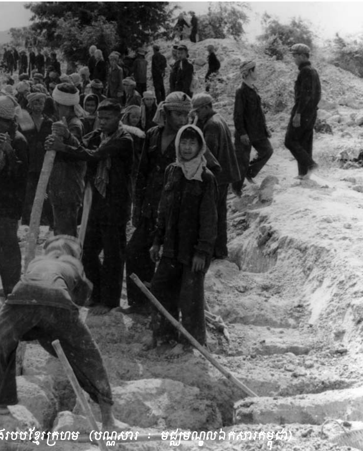
សម្លេងបង្ហូរខ្មែរក្រហម (បណ្តាសារ : មជ្ឈមណ្ឌលឯកសារកម្ពុជា)

ត្រូវដល់ជំនួយដូចបានបញ្ជាក់ខាងលើនេះក្តី រហូតដល់ខែកុម្ភៈ បញ្ហា កន្លះខាតថវិកាសម្រាប់បើកប្រាក់បៀវត្សរ៍ឲ្យបុគ្គលិកខ្មែរនៅតែមិន មានដំណោះស្រាយ ហើយពុំទាន់មានប្រទេសម្ចាស់ជំនួយណាមួយ សន្យាផ្តល់ថវិកាឲ្យភាគីកម្ពុជាសម្រាប់ចំណាយក្នុងឆ្នាំ២០១៣ ឡើយ ។ ១០ ជាលទ្ធផលនៅព្រឹកថ្ងៃច័ន្ទទី០៤ ខែមីនា ឆ្នាំ២០១៣ នៅពេលអង្គជំនុំជម្រះចូលមកដល់ក្នុងបន្ទប់សវនាការភ្លាម បុគ្គលិកជាតិខ្មែរផ្នែកបកប្រែភាសា បានប្រកាសជាសាធារណៈ នៅចំពោះមុខចៅក្រមថា “ យើងខ្ញុំជាបុគ្គលិកផ្នែកបកប្រែភាសា នៃអង្គជំនុំជម្រះវិសាមញ្ញក្នុងតុលាការកម្ពុជា សូមប្រកាសអនុវត្ត ការធ្វើពហិការមិនបំពេញការងារចាប់ពីពេលនេះ ថ្ងៃច័ន្ទ ទី០៤ ខែមីនា ឆ្នាំ២០១៣ នេះតទៅ រហូតដល់យើងខ្ញុំទទួលបានប្រាក់ខែ ពេញលេញសម្រាប់ខែធ្នូ ឆ្នាំ ២០១២ និងខែមករា ខែកុម្ភៈ ឆ្នាំ២០១៣ ទើបយើងខ្ញុំនឹងចាប់ផ្តើមចូលបំពេញការងារ ដូច ប្រក្រតីឡើងវិញ” ។ ១១ ការប្រកាសនេះ បានបង្កឲ្យមានការ ស្រឡាត់កាំងយ៉ាងខ្លាំងសម្រាប់អ្នកដែលបានចូលរួម តាមដាន សវនាការដោយផ្ទាល់ ហើយមានការចាប់អារម្មណ៍យ៉ាងខ្លាំងពី បណ្តាអ្នកការសែតជាតិ និងអន្តរជាតិ ។ ក្នុងបញ្ជាក់ថា សកម្មភាព ធ្វើពហិការរបស់អង្គភាពបកប្រែភាសានេះ ត្រូវបានកំរិតដោយ បុគ្គលិកជាតិនៅផ្នែកផ្សេងៗទៀត ដែលសរុបទាំងអស់មានចំនួន ២៨៧នាក់ ។ ១២