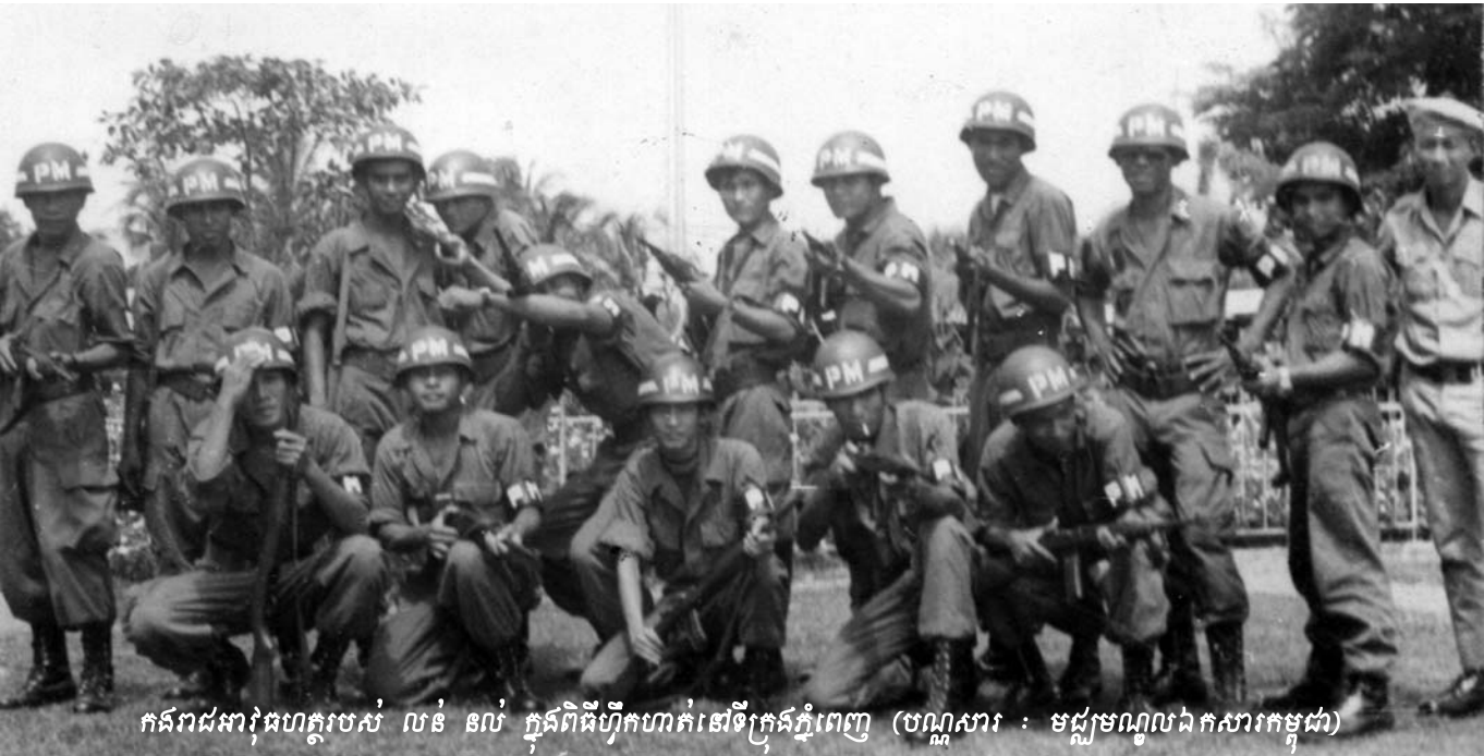
កងរាជអាវុធហត្ថរបស់ លន់ នល់ ក្នុងពិធីហ៊ុកហាត់នៅទីក្រុងភ្នំពេញ

នៅក្នុងសារណានេះដែរ ក្រុមមេធាវីការពារក្តីជនជាប់ចោទ ទួន ជា ស្នើសុំអង្គជំនុំជម្រះសាលាដំបូងធ្វើសវនាការតែពេលព្រឹក ប៉ុណ្ណោះ ក្នុងករណីអង្គជំនុំជម្រះរកឃើញថាជនជាប់ចោទ ទួន ជា មានសម្បទាគ្រប់គ្រាន់ក្នុងការចូលរួមសវនាការ ។ សវនាការត្រូវ