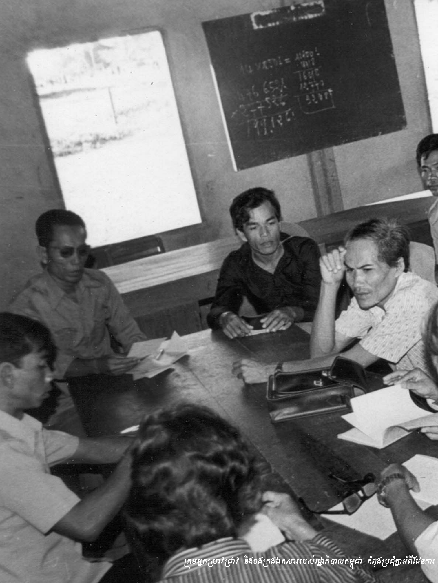
ក្រុមអ្នកស្រាវជ្រាវ និងបងក្រងឯកសាររបស់រដ្ឋាភិបាលកម្ពុជា កំពុងប្រជុំគ្នាដើម្បីពិភាក្សា