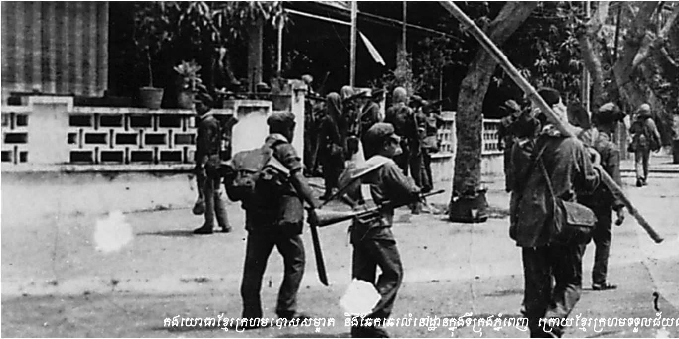
កងយោធពលខ្មែរក្រហមបោកបញ្ឆោតសម្លាត់ និងឆែកឆេរលំនៅដ្ឋានក្នុងទីក្រុងភ្នំពេញ ក្រោយខ្មែរក្រហមទទួលជ័យជម្នះ

ក្រោម (កូសាំងស៊ីន) ក្នុងបេសកកម្មដើម្បីសម្លាប់ឲ្យបានច្រើនជា អតិបរមានូវ បុរស ស្រ្តី និងកុមារ របស់កំពូជយួនដ៏អាក្រក់បំផុត នេះ ។ ក៏ប៉ុន្តែថា (យើង) មិនអាចកម្ទេចពួកវាចោលទាំងស្រុង ទាំង បុរសទ្រុឌទ្រោមពីក្នុងប្រទេសរបស់ពួកវាបានទេ ។ នៅតំបន់អណ្តូម និងតុងកីង គឺនៅមានប្រជាជនវារាប់សិបលាននាក់នៅឡើយ ។ ដូច្នេះ ខ្ញុំក៏បានសម្រេចចិត្តផ្លាស់ប្តូរយុទ្ធសាស្ត្រ និងកលល្បិច ។ គឺ (ផ្លាស់ប្តូរ) ទាំងស្រុងតែម្តង ។ (គឺ) ខ្ញុំបញ្ជាក់ពួកវាឲ្យចូលមក ស្រុកយើង ដោយធ្វើយ៉ាងណាឲ្យពួកវាជឿយ៉ាងស៊ប់ថា ពួកវា ពិតជាទទួលបានជ័យជម្នះភាមមធ្យោបាយយោធា ។ ដល់ពេល ណាពួកវាបានចូលមកដល់កម្ពុជាប្រជាធិបតេយ្យហើយ យើងជា ប្រជាជនកម្ពុជាទាំងប្រុស ទាំងស្រី នឹងកាប់ពួកវាដាវដុតចាញ់ និង ហាន់ពួកវាជាកង់ៗ ។ នៅរៀតណាមពួកវាគ្មានផ្លូវថាទីនឹងបាន ឃើញទាហាន ពួកវាត្រឡប់ទៅស្រុកវារវិញឡើយ ហើយពួកវាពិត ជាមិនបញ្ជូនកងពលជាច្រើនមករកយើងទៀត ហើយយើងជា ប្រជាជនកម្ពុជានឹងបន្តហាន់ពួកវាជាកង់ៗ ។ ហើយដល់ដំណាក់ កាលចុងក្រោយ បន្ទាប់ពីមានការរំដោះកម្ពុជាក្រោមរបស់យើង រួច យើងនឹងធ្វើដំណើរទៅកាន់ប្រទេសរបស់ពួកវាគឺទៅអណ្តូម និងទៅទ្រង់តុងកីងទៀត ដែលការធ្វើដូច្នេះគឺដើម្បីកាប់សម្លាប់ ប្រពន្ធ និងកូនរបស់ពួកវា(ក្មេងប្រុសស្រីនិងទារក) ។ ហេតុដូចនេះ