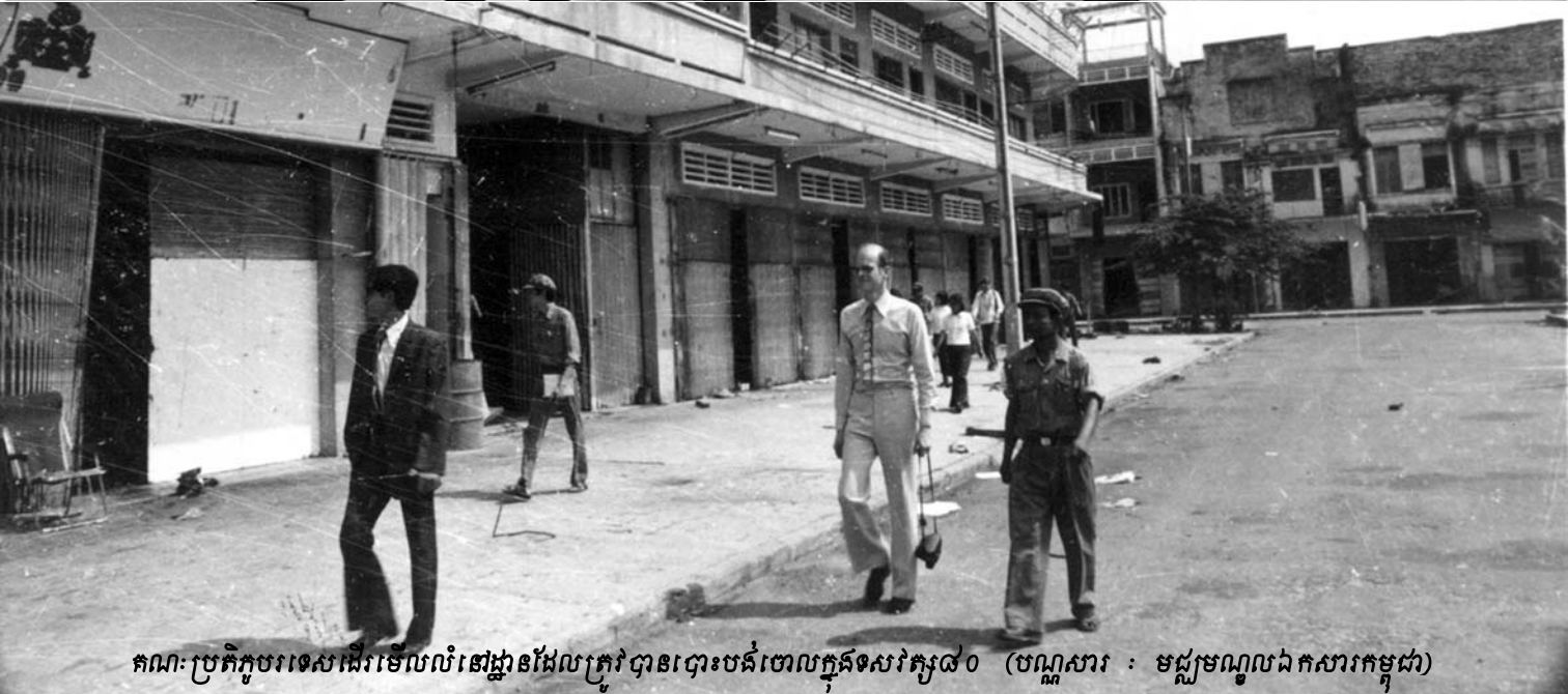
គណៈប្រតិភូបរទេសដើរមើលលំនៅដ្ឋានដែលត្រូវបានបោះបង់ចោលក្នុងទសវត្ស៧០