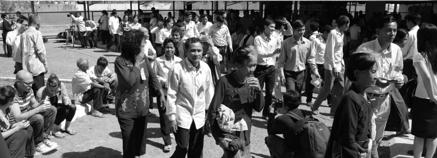
ទិដ្ឋភាព សិស្ស និស្សិត ប្រជាជន និងអ្នកសារព័ត៌មាន កំពុងដើរតម្រង់ចូលសាលាសវនាការ នៃសាលាភ្នំខ្មែរក្រហម ដើម្បីតាមដានកិច្ចដំណើរការនីតិវិធី