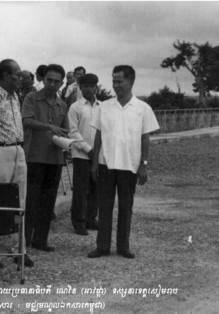
វាយប្រធានាធិបតី ណេវិន (អាវុធ) ទស្សនាខេត្តសៀមរាប

១៤ Anne Heindel, "Decision on Case 004 Suspect's Right to Counsel"