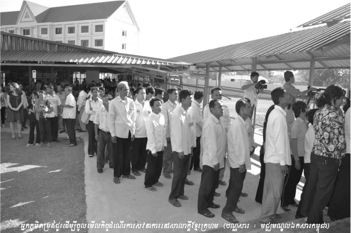
អ្នកភូមិកម្រិតជួរដើម្បីចូលមើលកិច្ចដំណើរការសវនាការនៅសាលាក្តីខ្មែរក្រហម

កាតព្វកិច្ចត្រូវផ្តល់ និងរ៉ាប់រងចំណាយដោយខ្លួនឯងនូវអាគារសម្រាប់សហចៅក្រមស៊ើបអង្កេត ការិយាល័យព្រះរាជអាជ្ញាអង្គជំនុំជម្រះ និងការិយាល័យរដ្ឋបាល ។ រាជរដ្ឋាភិបាលក៏ត្រូវផ្តល់នូវសម្ភារប្រើប្រាស់ ការជួយសម្រួល និងសេវាកម្មផ្សេងៗទៀតដែលចាំបាច់សម្រាប់ប្រតិបត្តិការរបស់អង្គជំនុំជម្រះ ដែលអាចឯកភាពគ្នាបានតាមរយៈកិច្ចព្រមព្រៀងដោយឡែករវាងអង្គការសហប្រជាជាតិ និងរាជរដ្ឋាភិបាល ។ ១ បន្ថែមលើនេះ រាជរដ្ឋាភិបាលកម្ពុជាទទួលបន្ទុកបង់ប្រាក់បៀវត្សរ៍ និងប្រាក់បំណាច់របស់ចៅក្រមកម្ពុជា ព្រះរាជអាជ្ញាកម្ពុជា និងបុគ្គលិកកម្ពុជាផ្សេងទៀត ។ ២ ចំណែកអង្គការសហប្រជាជាតិទទួលបន្ទុកបង់ប្រាក់