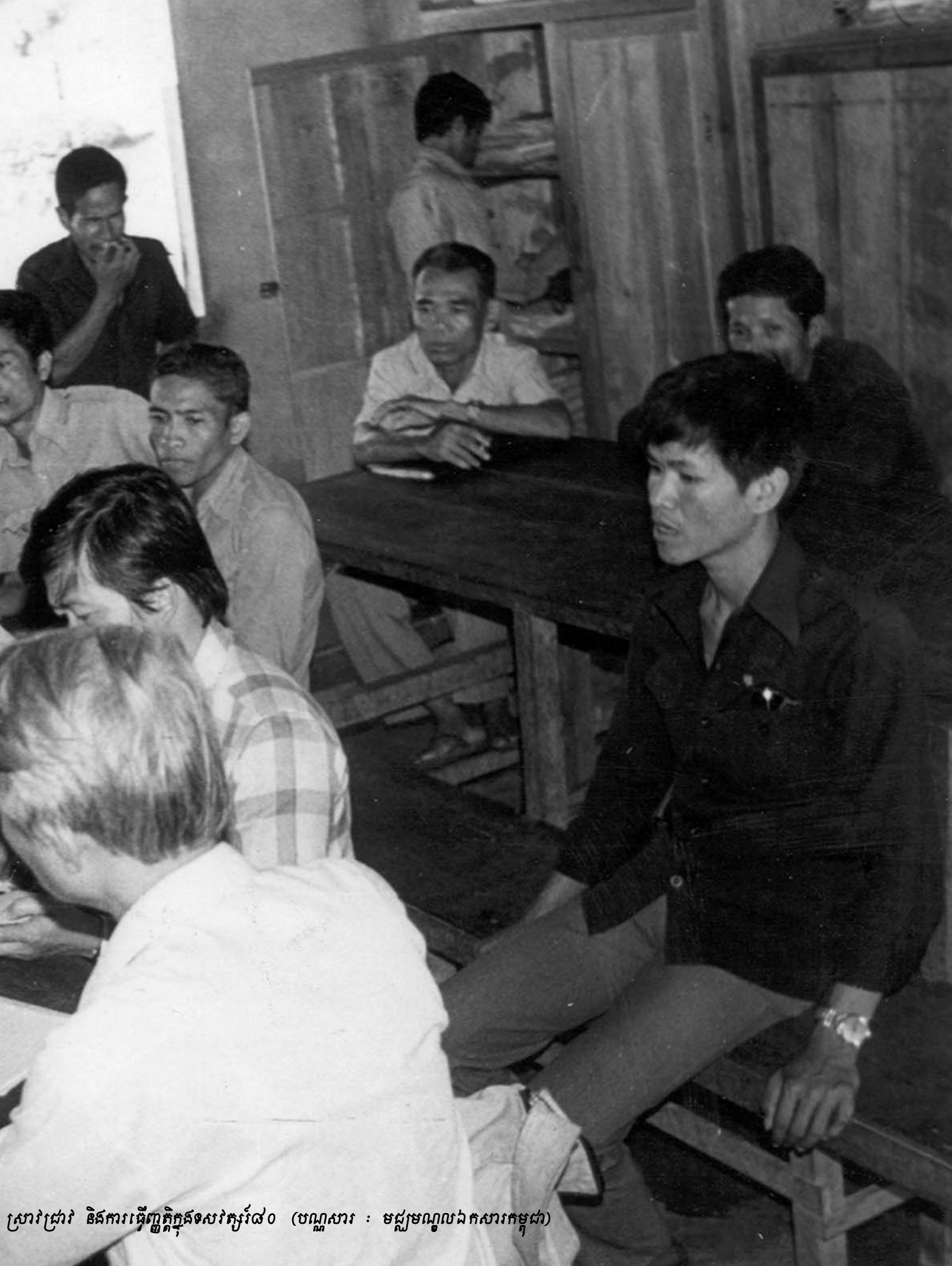
ស្រាវជ្រាវ និងការធ្វើប្រតិបត្តិការសិក្សា៧០