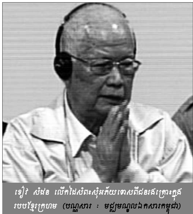
ខៀវ សំផន លើកដៃសំពះសុំអភ័យទោសពីជនរងគ្រោះក្នុងរបបខ្មែរក្រហម

ដូច្នេះដំណាក់កាលទី២នេះ ការជម្លៀសនេះពិតជាមានការលំបាកខ្លាំងណាស់ ខ្លាំងលើសពីកាលទី១ទៅទៀត ។ ការជម្លៀសទាំងពីរនេះគឺពិតជាមានមហាទុក្ខហួសប្រមាណ ។ ពួកយើងមានសភាពទ្រុឌទ្រោមរាងកាយ កម្លាំងខ្សោយ ទាំងស្មារតី ទាំងកម្លាំងវាជាមហាទុក្ខសោកដែលបានដក់ទុកនៅក្នុងខួរក្បាលរបស់ខ្ញុំ ។ នៅពេលដែលខ្ញុំបាត់បង់កូនស្រី គឺជាពេលខ្លោចដូរវែងដុតសម្រាប់ខ្ញុំ ស្ទើរតែធ្វើឲ្យខ្ញុំធ្លាក់រំលែងស្មារតី ។ កូនខ្ញុំបានស្រែកហៅខ្ញុំពីរ