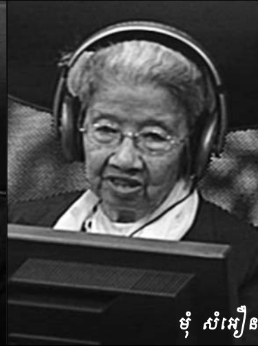
ចុំ សំអឿន