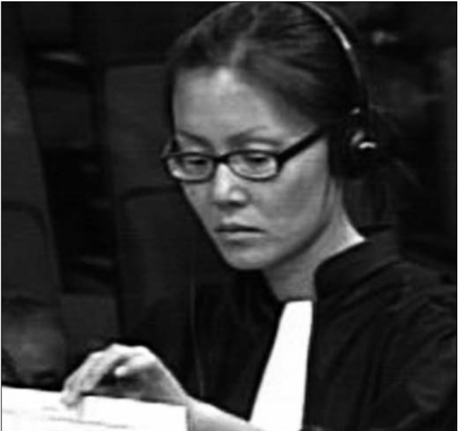
មេធាវីតំណាងដើម្បីបណ្តឹងរដ្ឋប្បវេណី បេនី យេ (បណ្ណសារ : មជ្ឈមណ្ឌលឯកសារកម្ពុជា)

ទាំងគម្រោងប្រើប្រាស់វិធីព្យាបាលតាមរបៀបចងក្រងជា សក្ខីកម្ម និងគម្រោងបង្កើតក្រុមជួយខ្លួនឯង ទទួលបានបន្តិចបន្តួច ដោយអង្គការចិត្តសង្គមអន្តរវប្បធម៌ (ធី.ភី.អូ) ដែលមានរយៈ ពេល១៦ ខែ ដោយទទួលបានថវិកាមួយផ្នែកពីរដ្ឋាភិបាលអាណ្លីម៉ង់