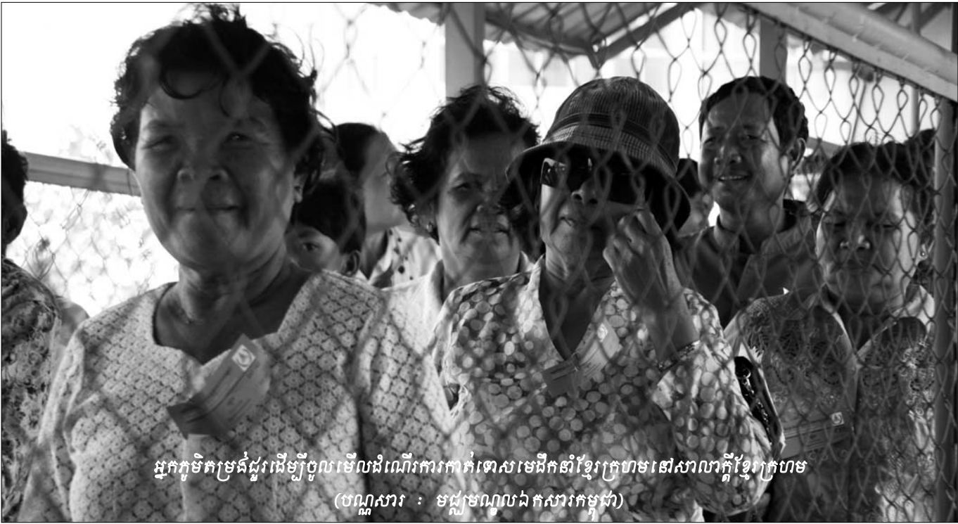
អ្នកភូមិកម្រងជួរដើម្បីចូលមើលដំណើរការកាត់ទោសមេដឹកនាំខ្មែរក្រហមនៅសាលាក្តីខ្មែរក្រហម (បណ្តាសារ : មជ្ឈមណ្ឌលឯកសារកម្ពុជា)

តម្រូវការសំណង ដែលស្នើសុំដោយដើមបណ្តឹងរដ្ឋប្បវេណីនាពេលនេះ ពុំមែនបង្កើតឡើងក្នុងន័យឆ្លើយតបទៅនឹងការទាមទារសំណងប្រឆាំងនឹងជនជាប់ចោទទេ ក៏ប៉ុន្តែដើម្បីធានាថា សំណងជាក់ស្តែង ដែលទប់ទល់នឹងការរំលោភដោយប្រភពខាងក្រៅ ទទួលស្គាល់ព្យសនកម្មរបស់ដើមបណ្តឹងរដ្ឋប្បវេណីអាចត្រូវបានអនុវត្តដោយឆាប់រហ័ស បន្ទាប់ពីសាលក្រមចូលជាស្ថាពរ ។ តម្រូវការសំណង