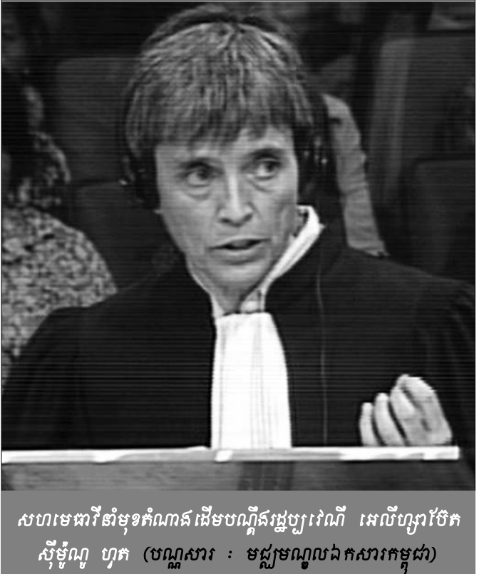
សហមេធាវីនាំមុខកំណត់ដើមបណ្តឹងរដ្ឋប្បវេណី អេលីហ្សាប៊ែត ស៊ីម៉ូណូ ហុក

ឡើងទើបគេបណ្តើរចេញទៅធ្វើការ ហើយហូបចុកខ្លះខាតមួយ កំប៉ុងហូបបួនប្រាំនាក់ ។ ដល់អីចឹងទៅតើសួរថា កម្មវិធីធ្វើការតើ មានឯណា? អត់មានកម្មវិធីធ្វើការទេ ប៉ុន្តែទៅទាំងចិត្តទៅទាំង ខ្លាចស្លាប់ ។ ហើយពេលទៅធ្វើការហ្នឹង ត្រូវទូលសំណាបទៅខ្លួន ឯង ហើយបើហ៊ានថាធ្វើជ្រុះធ្វើអី គឺខ្សែភ្នំវែងដូចកោអីចឹង នាងខ្ញុំ ក៏ធ្លាប់ត្រូវដែរ វែងខ្សែភ្នំ ព្រោះពេលគេវែងហ្នឹង គេមិនមែនគិតថា វែងអ្នកនេះមួយ អ្នកនោះមួយ គឺគេវាតែយកៗតែម្តង ប៉ះអ្នកណា ត្រូវអ្នកហ្នឹង ។