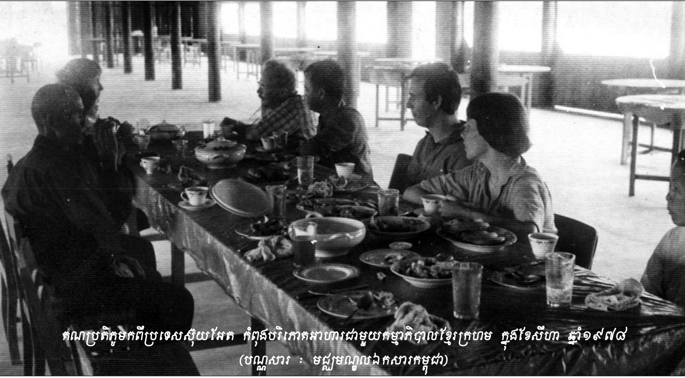
គណប្រតិភូមកពីប្រទេសស៊ុយដែន កំពុងបរិភោគអាហារជាមួយកម្មាភិបាលខ្មែរក្រហម ក្នុងខែសីហា ឆ្នាំ១៩៧៨ (បណ្ណសារ : មជ្ឈមណ្ឌលឯកសារកម្ពុជា)

ដូចបានបញ្ជាក់ គម្រោងសំណង់ទាំងអស់ដែលរាប់រៀបខាងលើពុំទាន់ក្លាយជាសំណងផ្លូវការសម្រាប់ដើមបណ្តឹងរដ្ឋប្ប