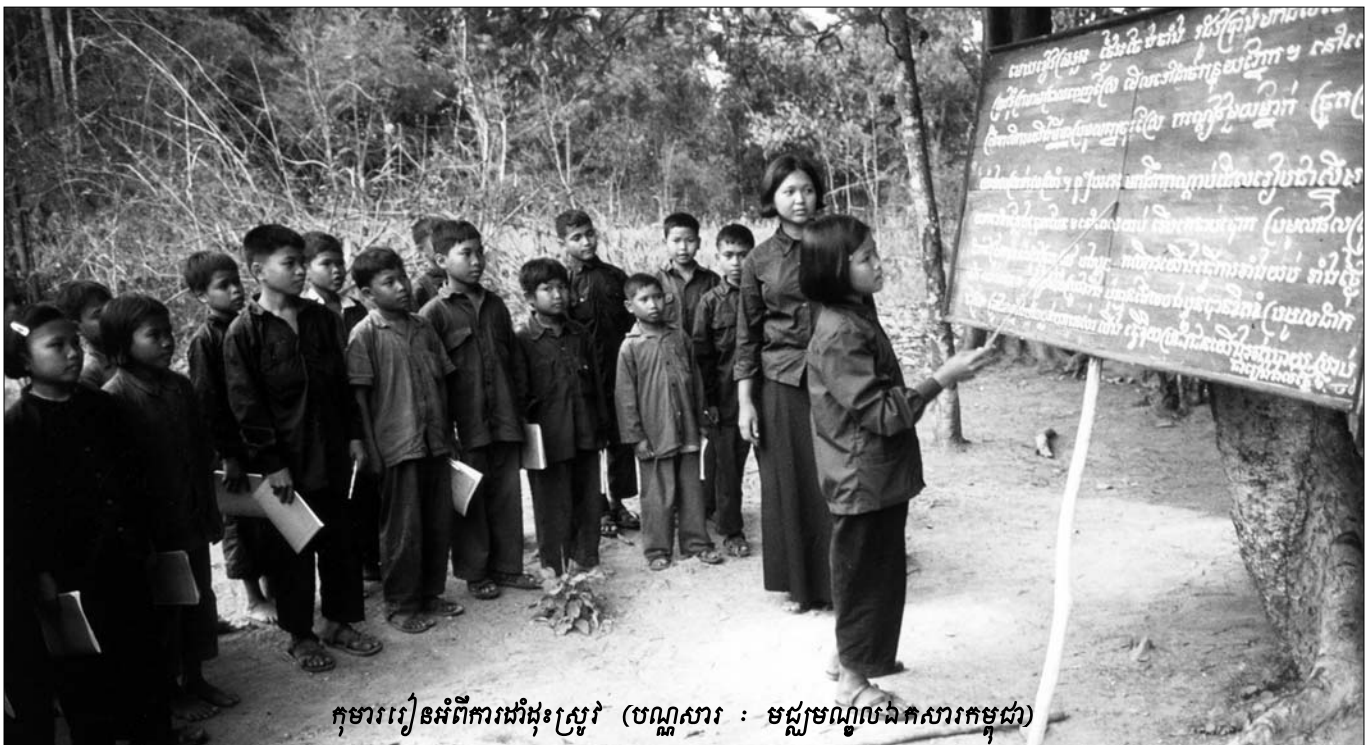
កុមាររៀនអំពីការដង្ហែស្រូវ

ជាបឋមការគាំពារពិព័រណ៍អចិន្ត្រៃយ៍នឹងត្រូវធ្វើនៅសារមន្ទីរ នៃខេត្តចំនួន៥ ដោយជាបឋមចាប់ផ្តើមពីខេត្តបាត់ដំបង និង បន្ទាយមានជ័យ បន្ទាប់មកនឹងមានការរៀបចំដូចគ្នានៅខេត្ត កំពង់ធំ តាកែវ និង ស្វាយរៀង។ ការជ្រើសរើសយកបណ្តាខេត្ត ទាំងនេះដើម្បីអនុវត្តគម្រោង ដោយសារដំណើរការ និងរចនា សម្ព័ន្ធនៃសារមន្ទីរនៅមានលក្ខណៈល្អច្រើន។ បន្ថែមពីលើនេះ ទីតាំងដែលត្រូវជ្រើសរើសយកមកធ្វើពិព័រណ៍ទាំងអស់នេះ មាន ភាពជាប់ពាក់ព័ន្ធនឹងវិសាលភាពនៃសំណុំរឿង០០២/០១ ដោយ មានជនរងគ្រោះដោយសារការជម្លៀសត្រូវបានបញ្ជូនទៅទីកន្លែង ទាំងនោះ។ ទោះបីជាខ្លឹមសារនៃការគាំពារពិព័រណ៍ អាចផ្តោតលើ បញ្ហាផ្សេងៗនៃប្រវត្តិសាស្ត្រខ្មែរក្រហម ប៉ុន្តែប្រធានបទជាដំបូង