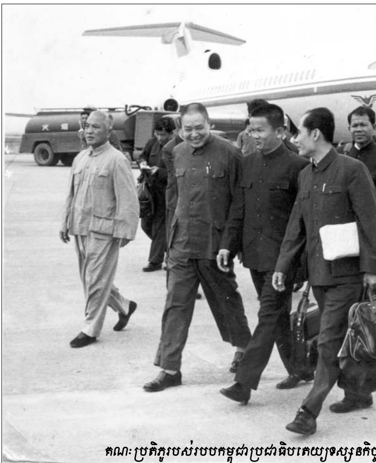
គណៈប្រតិភូរបស់របបកម្ពុជាប្រជាធិបតេយ្យទស្សនកិច្ច

គម្រោងសំណងនេះ បង្កើតឡើងក្នុងគោលដៅដើម្បីស្តារ