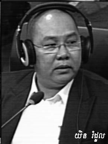
យិន រដ្ឋល