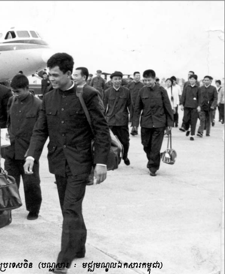
ប្រទេសចិន (បណ្តាសារ : មជ្ឈមណ្ឌលឯកសារកម្ពុជា)

គម្រោងសាងសង់ប្លង់នីយដ្ឋានសម្រាប់រំព្យកចំពោះជនរង គ្រោះ ជាប្រភេទគម្រោងសិល្បៈ ៖ “ជួនចំពោះអ្នកដែលបានបាត់