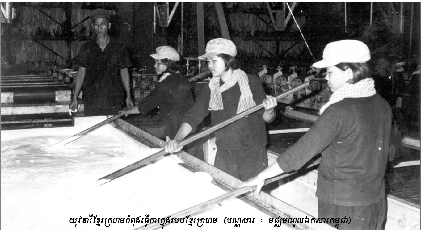
យុវនារីខ្មែរក្រហមកំពុងធ្វើការក្នុងរូបបងខ្មែរក្រហម

អនុស្សាវរីយ៍ជូនចិត្តទាំងឡាយ កំហឹងការសោកស្តាយវិប្បដិសារីនានាច្បាស់ជារលត់ និងរសាយទៅបន្តិចម្តងៗពីសតិអារម្មណ៍យើងគ្រប់គ្នា ។ ហើយការផ្សះផ្សាទៀតក៏អាចសម្រួលនិងពង្រីកថែមទៀតដើម្បីអនាគតកូនចៅយើង និងមាតុភូមិយើង