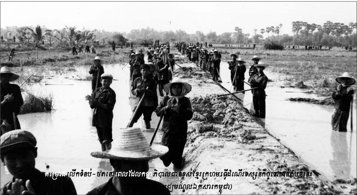
គម្រោង លើកទំនប់- ថតនៅពេលដែលកម្មាភិបាលជាន់ខ្ពស់ខ្សែក្រហមធ្វើដំណើរទស្សនកិច្ចទៅកាន់តំបន់នេះ

នៅក្នុងកុក ដើមបណ្ឌិតរដ្ឋប្បវេណី ប្តី ឌីណា បានបញ្ជាក់ថា ខ្លួនបានឃើញហេតុការណ៍ប្លែកៗជាច្រើន ដូចជាការធ្វើពារណកម្ម