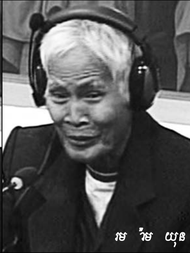
ម រ៉ាម យុន