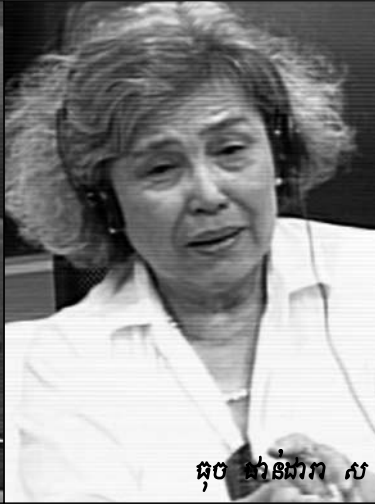
ចុច ចាន់ដារា ស