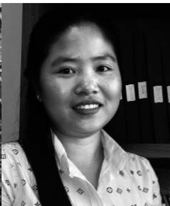
ទួន ខ្យល់

បរិញ្ញាបត្រច្បាប់ និងបរិញ្ញាបត្រសេដ្ឋកិច្ចពីសាកលវិទ្យាល័យភូមិន្ទនីតិសាស្ត្រ និងវិទ្យាសាស្ត្រសេដ្ឋកិច្ច និងជាជ័យលាភីថ្នាក់ជាតិ ទទួលបានពានរង្វាន់មេដាយមាសក្នុងការប្រកួតសវនាការប្រឌិត ឆ្នាំ២០១០ ។