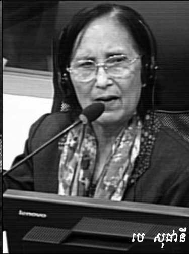
ចេ សុដានី