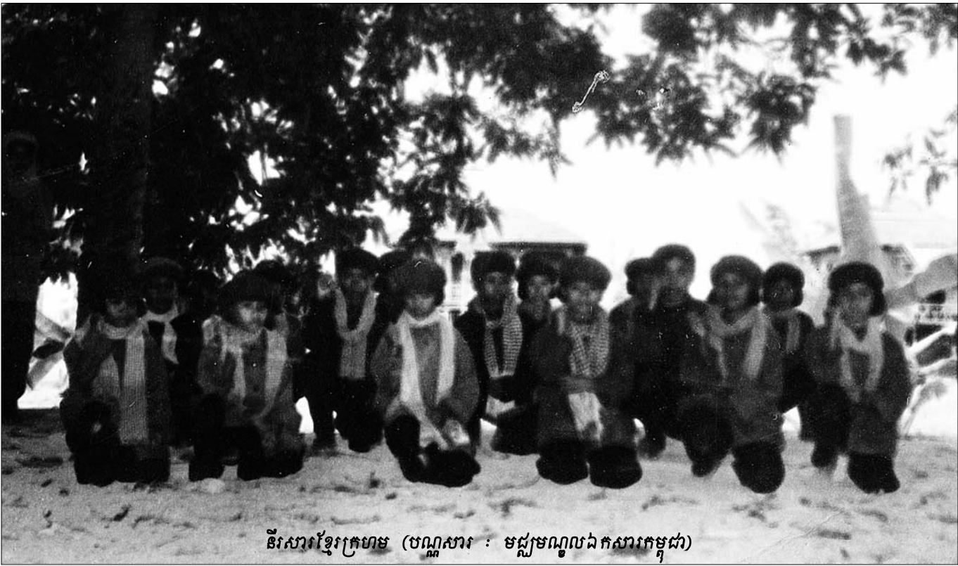
និរសារខ្មែរក្រហម (បណ្ណសារ : មជ្ឈមណ្ឌលឯកសារកម្ពុជា)

ត្រូវធ្វើយ៉ាងនេះ? ។ ប៉ុន្តែបើយើងបង្ខំពេល ឈឺអីទៅបង្កត់ បាយថា ធ្វើពុតអាហ្នឹងមនុស្សអីចឹងជាមនុស្ស ហៅថាស្តេច ត្រាញ់ហោរហៅ ។ មនុស្សដែលហោរហៅដល់កម្រិតហ្នឹង ខ្ញុំមិន រួមជាមួយទេ ។ ពិតមែនតែខ្ញុំមិនមែនជាអ្នកដឹកនាំកម្ពុជាប្រជាធិប តេយ្យ សម្រេចអំពើនយោបាយដែលនាំឲ្យលោកស្រី សាច់ញាតិ លោកស្រី ជួបប្រទះនឹងទុក្ខសោក វេទនាក៏ដោយ ក៏សូមលើកដៃ អភ័យទោស សូមទោសលោកស្រី សូមទោសបងប្អូនរួមជាតិទាំង អស់ ។ ដូចខ្ញុំបានជម្រាបពីព្រឹកមិញ ដែលត្រូវបានគេគ្រោះដោយ អំពើហោរហៅព្រៃផ្សៃនេះ ខ្ញុំយល់ឃើញថា មិនមែនជាមនុស្ស ធម្មតាទេ ជាស្តេចត្រាញ់សង្គ្រាម ជាសក្តិកម្ម ។ បាទ! សូម អស់!” ។ បន្ទាប់ពីជនជាប់ចោទ ខៀវ សំផន បញ្ចប់ការឆ្លើយតប ដល់ជាប់ ចោទ នួន ជា បន្ថែមថា “...កម្ពុជាប្រជាធិបតេយ្យមិនមានមាតិកា នយោបាយទៅសម្រាប់ប្រជាជនឯង ទៅបង្កត់បាយ បង្កត់ទឹក ប្រជាជនឯងនោះទេ ។ ម្នាក់ៗសុខចិត្តលះបង់មកតស៊ូដើម្បីរំដោះ ជាតិ រំដោះប្រជាជនផុតពីចក្រពត្តិអាមេរិក ដល់ប្រទេសមួយទៀត គឺយួនឈ្មោះពានកម្ពុជា ។ ដូច្នោះ កម្ពុជាប្រជាធិបតេយ្យត្រូវទទួល