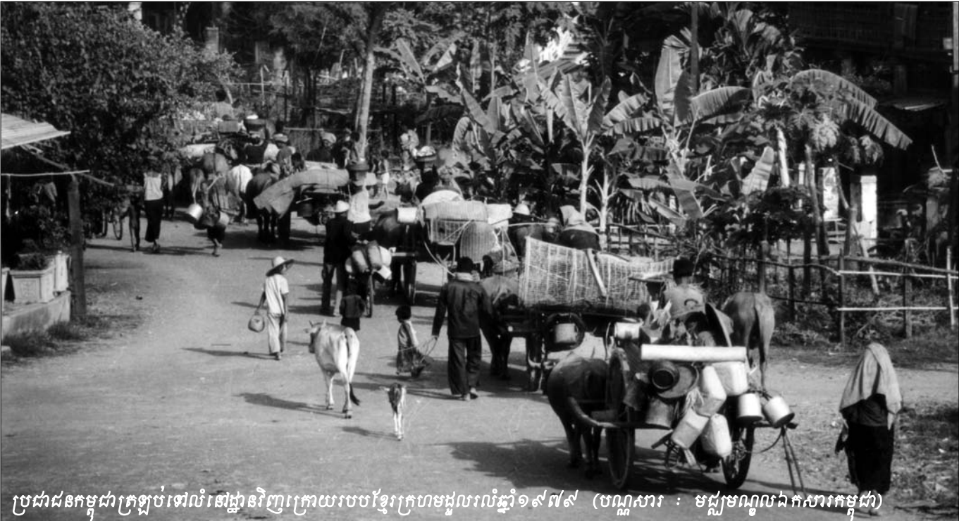
ប្រជាជនកម្ពុជាក្រឡប់ទៅលំនៅដ្ឋានវិញក្រោយរបបខ្មែរក្រហមដួលរលំឆ្នាំ១៩៧៩

មិនចាំបាច់ខ្វល់ពីកូនទេ ពួកវាមិនមែនជាកូនរបស់អ្នកឯងទៀតទេ ពីព្រោះថាពួកវាបានបំពាក់បំប៉នមនោគមវិជ្ជាអស់ហើយ ។ ហើយនៅពេលដែលកូនរបស់ខ្ញុំជិតស្លាប់នោះ គឺថាបាយមួយកូនបានក៏ខ្ញុំមិនអាចផ្តល់ឲ្យកូនស្រីខ្ញុំនោះបានដែរ ។ កូនស្រីខ្ញុំ ស្លាប់ដោយអត់បាយសូម្បីតែមួយកូនបាន ។ ខ្ញុំឈឺចាប់ខ្លាំងណាស់ ។ ខ្ញុំទទួលរងនូវព្យាសនកម្មខ្លាំងណាស់ ហើយខ្ញុំអាចរៀបរាប់បានច្រើនផ្សេងទៀត ។ អ្វីដែលពួកនោះបានធ្វើ តើសព្វថ្ងៃនេះគេបានដាក់ទោស