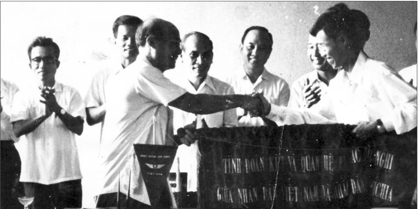
ពិធីអង្គម៉ឺនទ្រព្យមិត្តភាពរវាងប្រទេសកម្ពុជា-វៀតណាម-ឡាវ ក្នុងអំឡុងទសវត្សរ៍៤០ ឬ៥០

ដោយសារវិបត្តិផ្លូវចិត្តខាងលើ នាងខ្ញុំសម្រេចស្វែងទៅរក ព្រះធម៌ សម្រេចចិត្តទៅបួសដើម្បីរម្ងាប់នូវវិបត្តិផ្លូវចិត្តដែលពេល បច្ចុប្បន្ននេះ ។ បានរម្ងាប់ផ្លូវចិត្តមួយទៀត ដោយសារតុលាការ កូនកាត់ជាតិ និងអន្តរជាតិជំនុំជម្រះទោសនូវពួកគ្មានសីលធម៌ ។ នាងខ្ញុំមានជំនឿទុកចិត្ត ភាពកក់ក្តៅលើការកាត់ក្តីចំពោះមេដឹកនាំ ទាំងអស់នាពេលខាងមុខឲ្យស្វែងរកយុត្តិធម៌ដូនដំណូងជាតិទាំង អស់ ដែលមានគ្រោះអាក្រក់នៅក្នុងសង្គម និងខ្ញុំតាំងនាមខ្ញុំជាជន រងគ្រោះ ដើមបណ្តឹងរដ្ឋប្បវេណីទាំងអស់ ខ្ញុំគ្មានយោបល់អ្វី និង វែងឆ្ងាយទេ ព្រោះនាងខ្ញុំបានសម្រេចចិត្តថា មានតែផ្លូវសុខ ហើយនិងស្ងប់ ហើយនាងខ្ញុំ មិនអាចមានសង្ឃឹមថា ពេលមុន