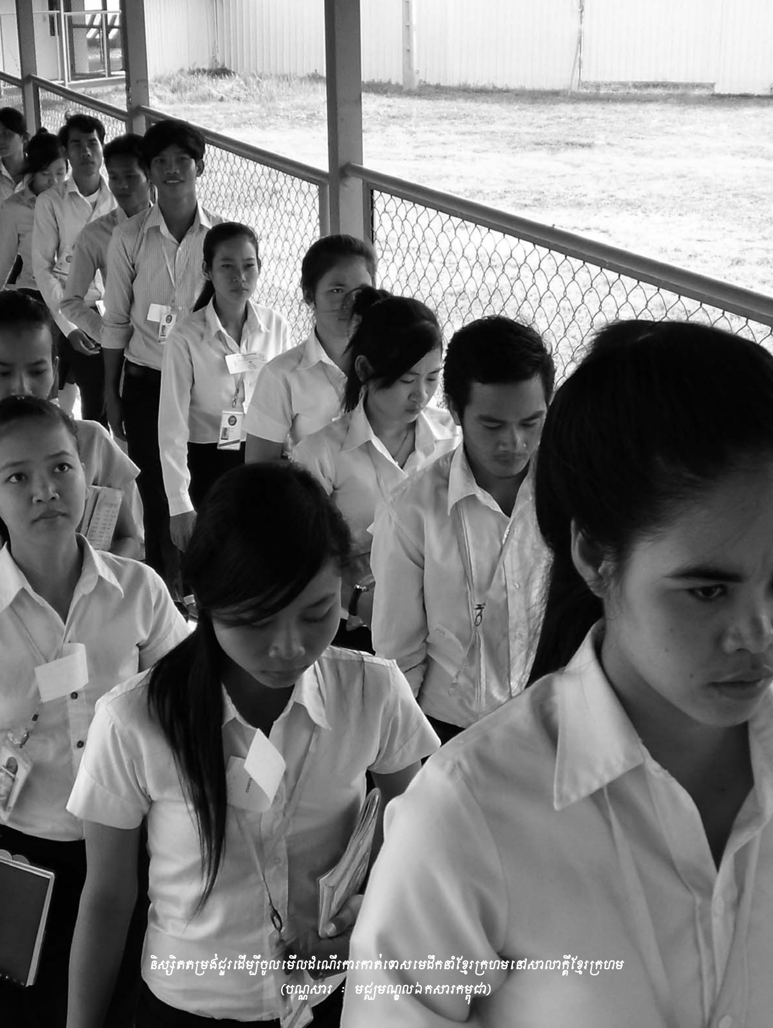
និស្សិតកម្រិតដំបូងរៀនអំពីការកាត់ទោសមេដឹកនាំខ្មែរក្រហមនៅសាលាក្តីខ្មែរក្រហម