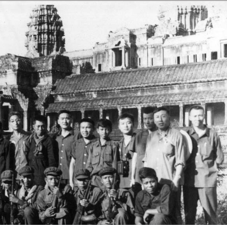
អង្គជំនុំជម្រះ នៅអង្គរវត្តក្នុងរបបកម្ពុជាប្រធិបតេយ្យ។

បានប្រើក្នុងបរិបទផ្សេងៗគ្នា។ តាមសន្ទនាក្រុមនៃវិធានផ្ទៃក្នុងរបស់អង្គជំនុំជម្រះ ពាក្យ“ជនសង្ស័យ” គឺសំដៅទៅលើបុគ្គលដែលសហព្រះរាជអាជ្ញា ឬសហចៅក្រមស៊ើបអង្កេតចាត់ទុកថា អាចធ្លាប់បានប្រព្រឹត្តបទឧក្រិដ្ឋដែលស្ថិតនៅក្នុងយុត្តាធិការរបស់អង្គជំនុំជម្រះវិសាមញ្ញ ប៉ុន្តែមិនទាន់ត្រូវបានចោទប្រកាន់នៅឡើយ។ ពាក្យ“ជនត្រូវចោទ” គឺសំដៅទៅលើបុគ្គលណាម្នាក់ ដែលត្រូវបានចោទប្រកាន់ចំពោះរឿងក្តីណាមួយ ក្នុងចន្លោះពេលពីមានដឹកនាំសន្និដ្ឋានបញ្ជូនរឿងស៊ើបសួរ