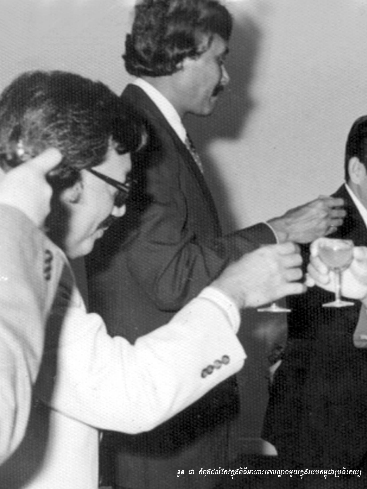
នួន ជា កំពុងដល់កែវក្នុងពិធីសាហារពេលល្ងាចមួយក្នុងរបបកម្ពុជាប្រទេសយុ