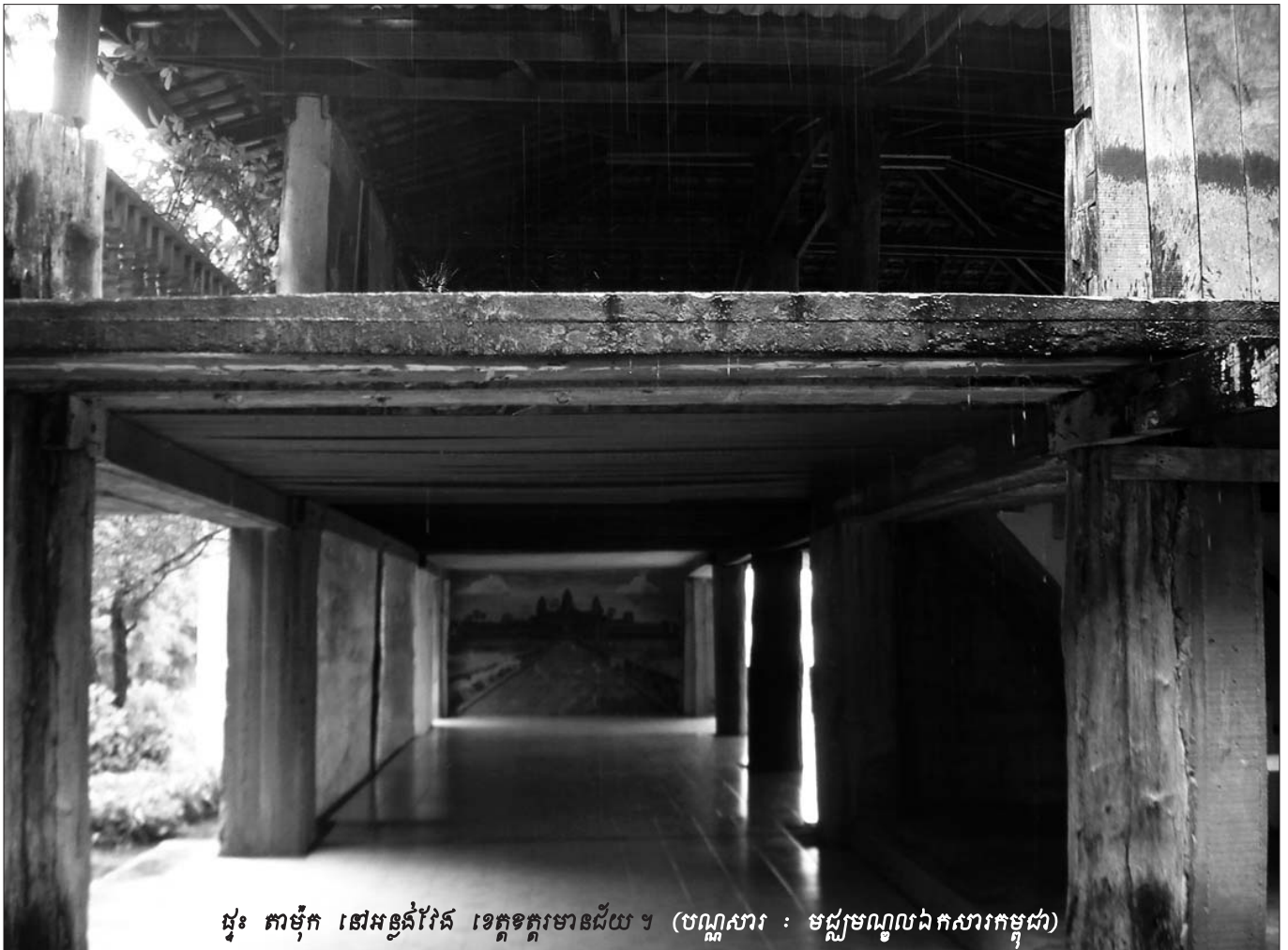
ផ្ទះ ភាម៉ុក នៅអន្លង់វែង ខេត្តក្រចេះមានជ័យ ។

យោងតាមមាត្រា ៧៨ នៃក្រមនីតិវិធីព្រហ្មទណ្ឌ និងវិធាន ៩១(១) នៃវិធានផ្ទៃក្នុង គឺបានតម្រូវឲ្យដល់ព័ត៌មានដល់ជន សង្ស័យ អំពីសិទ្ធិទទួលបានមេធាវីការពារក្តីចាប់តាំងពីជននោះ ត្រូវបានយាត់ខ្លួន ជាលើកដំបូងនៅដំណាក់កាលស៊ើបអង្កេត ដែល អនុវត្តដោយមន្ត្រីនគរបាលយុត្តិធម៌ និងព្រះរាជអាជ្ញាមកម្ល៉េះ ។ ចំណែកមាត្រា១៤៣ នៃក្រមនីតិវិធីព្រហ្មទណ្ឌ និងមាត្រា២៤ថ្មី នៃច្បាប់ស្តីពីការបង្កើតអង្គជំនុំជម្រះវិសាមញ្ញ បានធានាដល់ជន ត្រូវចោទក្នុងការទទួលបានមេធាវីការពារក្តីតាមការជ្រើសរើស របស់ខ្លួន ដោយឧបមន្តបាននៅដំណាក់កាលស៊ើបសួរដែលដឹកនាំ