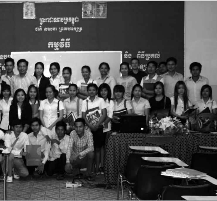
និស្សិតសកលវិទ្យាល័យជាតិក្រុង បន្ទាប់ការធ្វើបទបញ្ជាអំពីដំណើរ