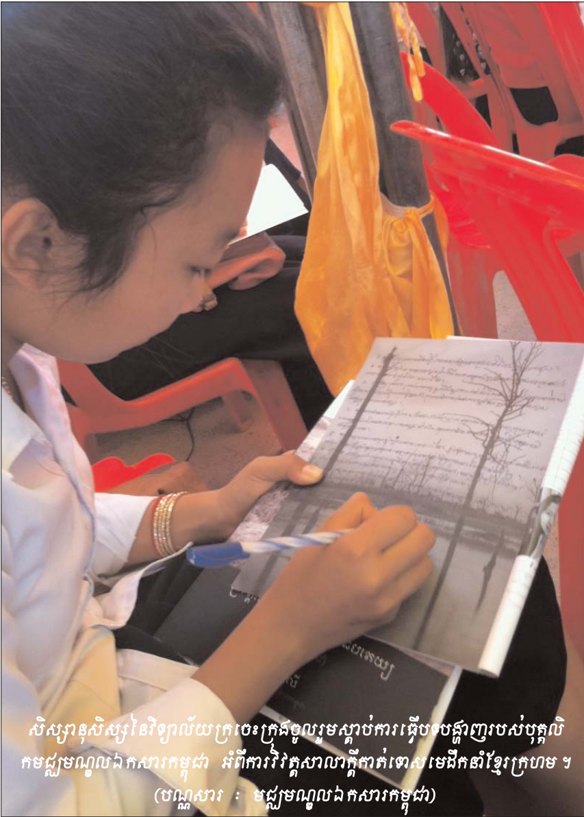
សិស្សានុសិស្សនៃវិទ្យាល័យក្រចេះក្រុងចូលរួមស្តាប់ការធ្វើបទបង្ហាញរបស់បុគ្គលិកមជ្ឈមណ្ឌលឯកសារកម្ពុជា អំពីការវិវត្តសាលាក្តីកាត់ទោសមេធាវីក្នុងខ្មែរក្រហម ។

ជាក់ស្តែងសវនាការស្តាប់សក្ខីកម្មរបស់សាក្សី និង សុំផ្អាកសក្ខីកម្មមួយចំនួន ដែលសាក្សីបានផ្តល់ជូនសហចៅក្រមស៊ើបអង្កេត ត្រូវបានសាក្សីប្រកាសលុបចោលនៅចំពោះមុខអង្គជំនុំជម្រះសាលាដំបូង ។ សាក្សីបានលើកសំណើថា “...សំណូមពរឲ្យអង្គសវនាការ លុបចោលនូវពាក្យទាំងឡាយណាដែលខ្ញុំបានផ្តល់បទសម្ភាសន៍ជូនចៅក្រមស៊ើបអង្កេត ក្របពាក្យទាំងអស់នៅក្នុងបទសម្ភាសន៍ ហ្នឹងដែលមានពាក្យ ប្រហែល អាចឬតាមខ្ញុំស្មាន ចេញទៅកុំទុក ជាការ ពីព្រោះគឺខ្ញុំមិនបានដឹង” ។ សូមមើលប្រតិចារិកថ្ងៃទី៥ ខែកញ្ញា ឆ្នាំ២០១២ ត្រង់ទំព័រ៥៨ និង៥៩ ។ អាចរកបានក្នុងគេហទំព័រ http://www.eccc.gov.kh/document/court/22495 ។