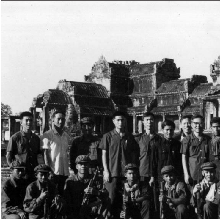
យោធា និងកងការពារខ្មែរក្រហម ថតជាមួយទីប្រឹក្សា និង (បណ្តាសារ : មជ្ឈម

ខែកញ្ញា ឆ្នាំ២០០៧ ដើម្បីធ្វើការស៊ើបអង្កេត និងចោទប្រកាន់បន្ថែម។ នៅថ្ងៃទី២៧ ខែមេសា ឆ្នាំ២០១១ សហចៅក្រមស៊ើបអង្កេតបានចេញសេចក្តីជូនដំណឹងស្តីពីការបិទបញ្ចប់ការស៊ើបអង្កេតលើសំណុំរឿងទាំងពីរនេះ។ ចាប់ពីទទួលបានសំណុំរឿងនៅថ្ងៃទី៧ ខែកញ្ញា ឆ្នាំ២០០៧ រហូតដល់ថ្ងៃចេញសេចក្តីជូនដំណឹងស្តីពីការបិទបញ្ចប់ការស៊ើបអង្កេតនេះ សហចៅក្រមស៊ើបអង្កេតបានបើកកិច្ចស៊ើបអង្កេតលើសំណុំរឿងទាំងនេះ ដោយគ្មានវត្តមានរបស់មេធាវីការពារក្តី។ ៧៧ ក្នុងករណីនេះ ទោះបីជនគ្រូវចោទនៅក្នុង