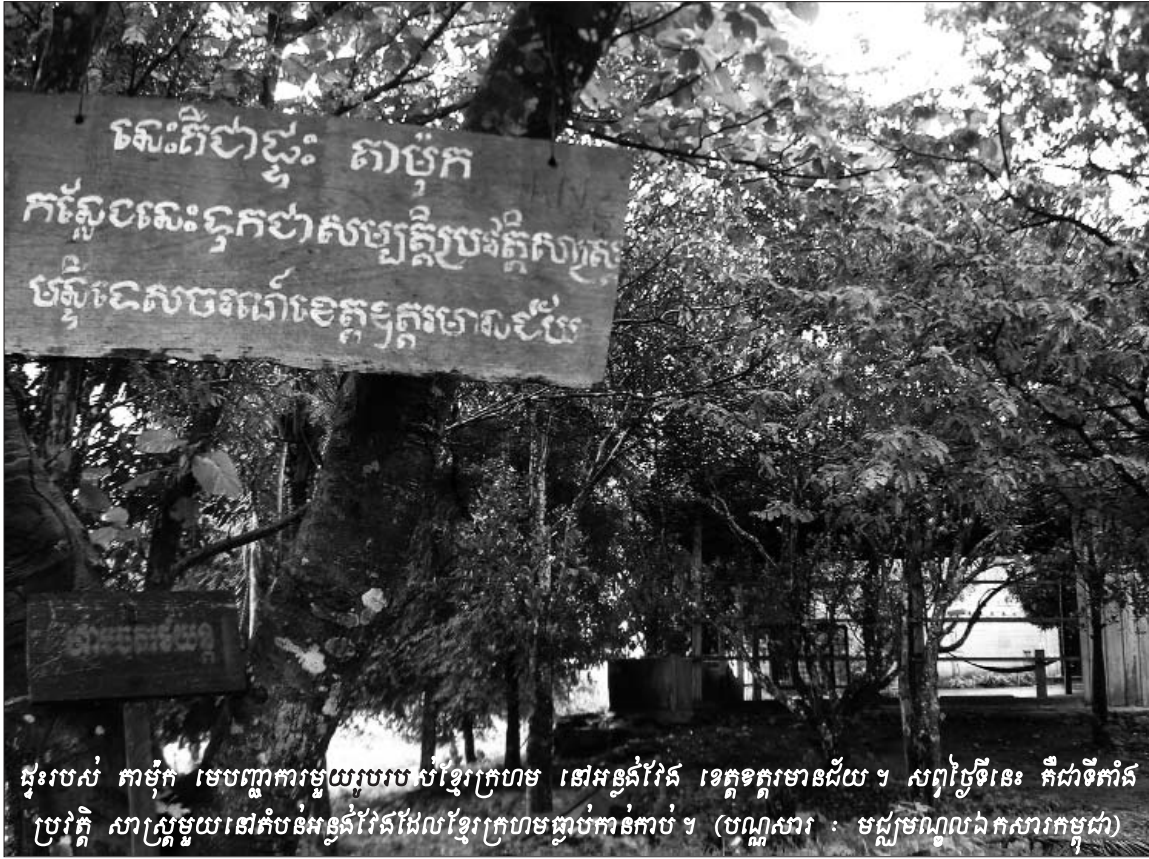
ផ្ទះរបស់ តាម៉ុក មេបញ្ជាការមួយរូបរបស់ខ្មែរក្រហម នៅអូរដំរី ខេត្តក្រចេះ ។ សព្វថ្ងៃនេះ គឺជាទីកន្លែង ប្រវត្តិ សាស្ត្រមួយនៅតំបន់អូរដំរីដែលខ្មែរក្រហមធ្លាប់កាន់កាប់ ។

ទាក់ទងនឹងវិសាលភាពនៃសំណុំរឿង ០០២/០២ នេះដែរ មេធាវី អធិតា ហ្គីសេ ជាសហមេធាវីអន្តរជាតិការពារក្តីជនជាប់ ចោទ ខៀវ សំផន បានលើកឡើងថា ក្រុមសហព្រះរាជអាជ្ញា ជ្រើសរើសយកតែអង្គហេតុណាដែលកាំទ្រឬស្របទៅតាមទស្សនៈ របស់ខ្លួនតែប៉ុណ្ណោះ ដែលអង្គហេតុទាំងនោះ ខុសពីទស្សនៈរបស់ ក្រុមមេធាវីការពារក្តី ។ ទោះបីជាយ៉ាងណាក្តីមេធាវី អធិតា ហ្គីសេ ពុំបានបង្ហាញអំពីអង្គហេតុជាក់លាក់ដែលខ្លួនមានបំណងដាក់បញ្ចូល