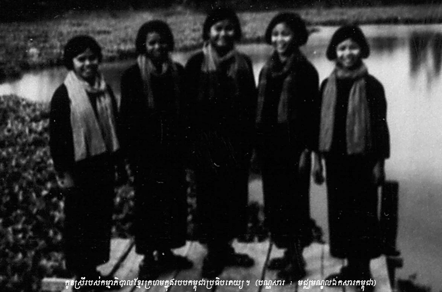
កូនស្រីរបស់កម្មាភិបាលខ្មែរក្រហមក្នុងរបបកម្ពុជាប្រជាធិបតេយ្យ។