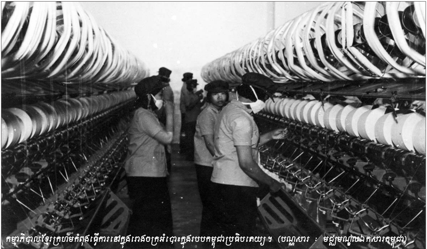
កម្មាភិបាលខ្មែរក្រហមកំពុងធ្វើការនៅក្នុងរោងចក្រដំបោះក្នុងរបបកម្ពុជាប្រតិបត្តិយុទ្ធ

ទោះបីជាមានការអនុវត្តតាមការបកស្រាយនេះ ហើយមានការ សន្មតថា ប្រធានអង្គជំនុំជម្រះសាលាដំបូងមានអំណាចក្នុងការ ចាត់តាំងក្រុមប្រឹក្សាជំនុំជម្រះទី២ក៏ដោយ តុលាការកំពូលត្រូវតែ ផ្តល់ឆន្ទានុសិទ្ធិឲ្យប្រធានអង្គជំនុំជម្រះសាលាដំបូងធ្វើការតែតាំង ក្នុងករណីចាំបាច់ទាក់ទងនឹងដលប្រយោជន៍យុត្តិធម៌ ។ ក្រុមមេធាវី តំណាងដើមបណ្តឹងរដ្ឋប្បវេណីយល់ឃើញថា ដលប្រយោជន៍ យុត្តិធម៌មិនតម្រូវឲ្យមានក្រុមប្រឹក្សាជំនុំជម្រះទី២នោះទេ ដោយ សារ វាមិនអាចនាំឲ្យការជំនុំជម្រះនេះដំណើរការបានលឿន ។ គួរ កាត់ការពិភាក្សាកន្លងមក ការជ្រើសរើសក្រុមប្រឹក្សាជំនុំជម្រះ ទី២ ត្រូវចំណាយពេលច្រើន ។ ចៅក្រមជាតិត្រូវជ្រើសរើសពី ចៅក្រមបម្រុង ហើយតម្រូវឲ្យមានការតែតាំងដោយព្រះរាជ ក្រឹត្យ ។ ចំពោះចៅក្រមអន្តរជាតិ ត្រូវជ្រើសរើសពីបញ្ជីរបស់អង្គ លេខាធិការអង្គការសហប្រជាជាតិ ។ ចំណែកបុគ្គលិកគាំទ្រ ត្រូវ ជ្រើសរើសតាមនីតិវិធីដែលតម្រូវឲ្យមានការប្រកាសជ្រើសរើស បុគ្គលិករហូតដល់ដំណាក់កាលសម្ភាស ។ លើសពីនេះក្រុមប្រឹក្សា ជំនុំជម្រះទី២ ធ្វើយ៉ាងណាទាមទារឲ្យយល់នូវឯកសារនានាដែល មាននៅក្នុងសំណុំរឿង ០០២/០១ ដែលនឹងត្រូវប្រើពេលយូរ