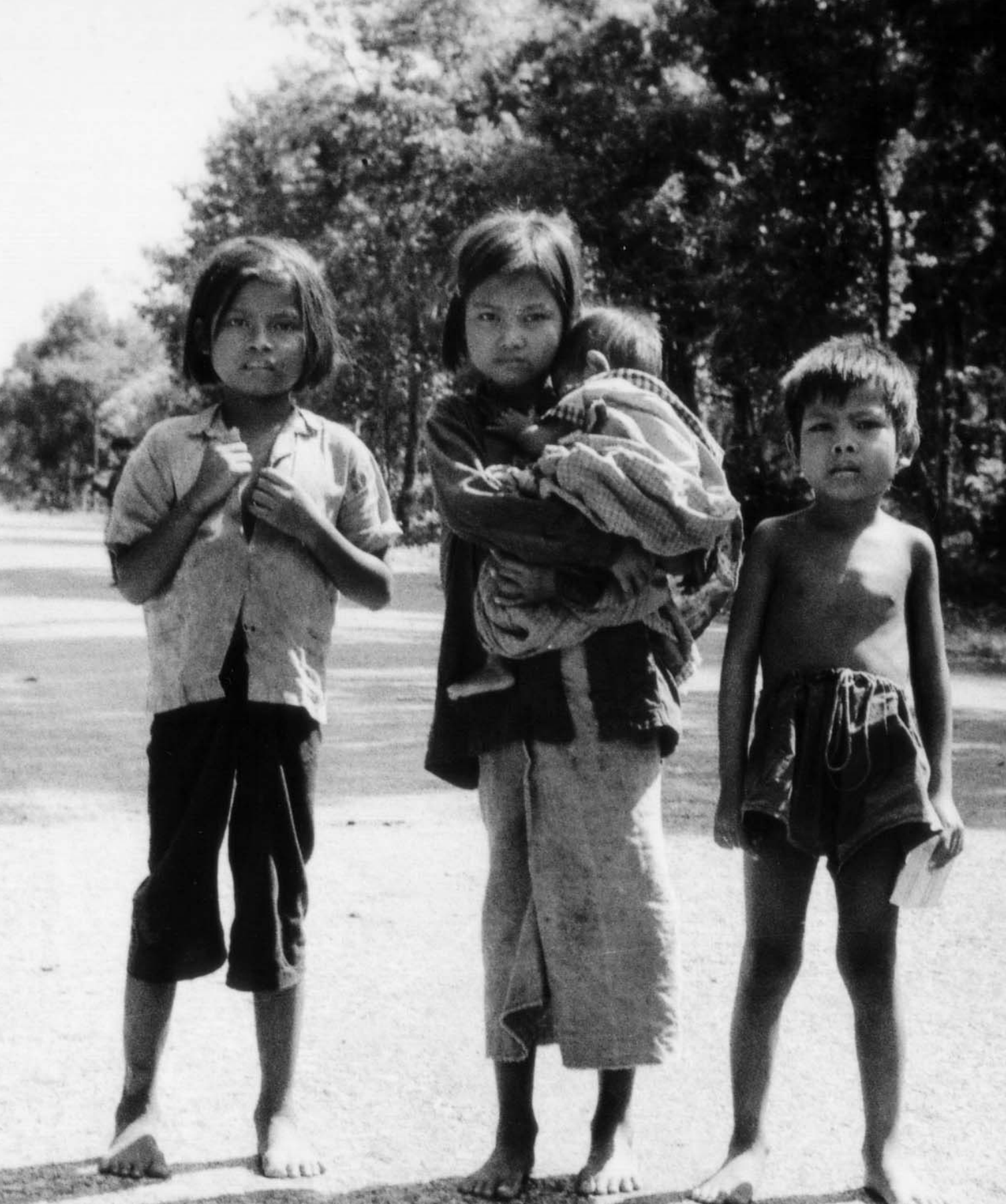
កុមារ-កុមារីដែលឪពុកម្តាយរបស់ខ្លួនត្រូវបានខ្មែរក្រហមសម្លាប់ ។ ក្នុងឆ្នាំ១៩៧៩ កុមារ-កុមារីទាំងនេះ បានធ្វើដំណើរគ្រាប់បែកគ្មាន គោលដៅដើម្បីស្វែងរកម្តុបអាហារ និងសាច់ញាតិ ។ រូបនេះថតដោយចារិករវៀតណាមក្នុងខែមករា ឆ្នាំ១៩៧៩ នៅខេត្តសៀមរាប ។ (បណ្ណសារ : មជ្ឈមណ្ឌលឯកសារកម្ពុជា)