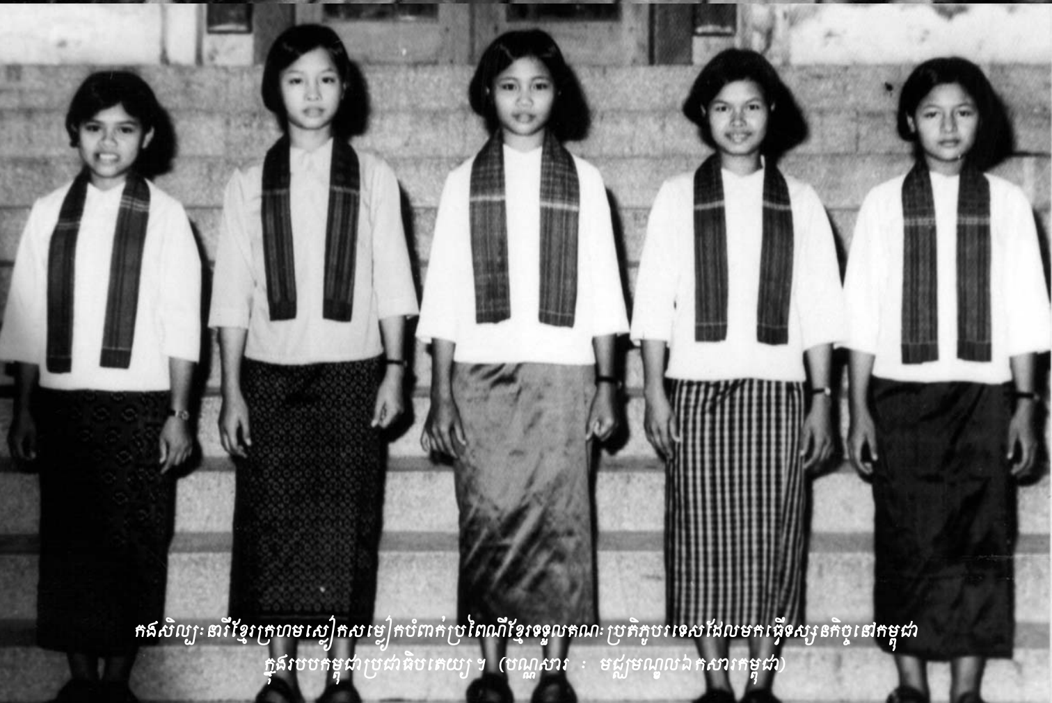
កងសិល្បៈ ពារីខ្មែរក្រហមស្ងៀមស្ងៀមកំពុងប្រព្រឹត្តិការណ៍ខ្មែរទទួលបានប្រតិភូបរទេសដែលមកធ្វើទស្សនកិច្ចនៅកម្ពុជា ក្នុងរបបកម្ពុជាប្រជាធិបតេយ្យ។