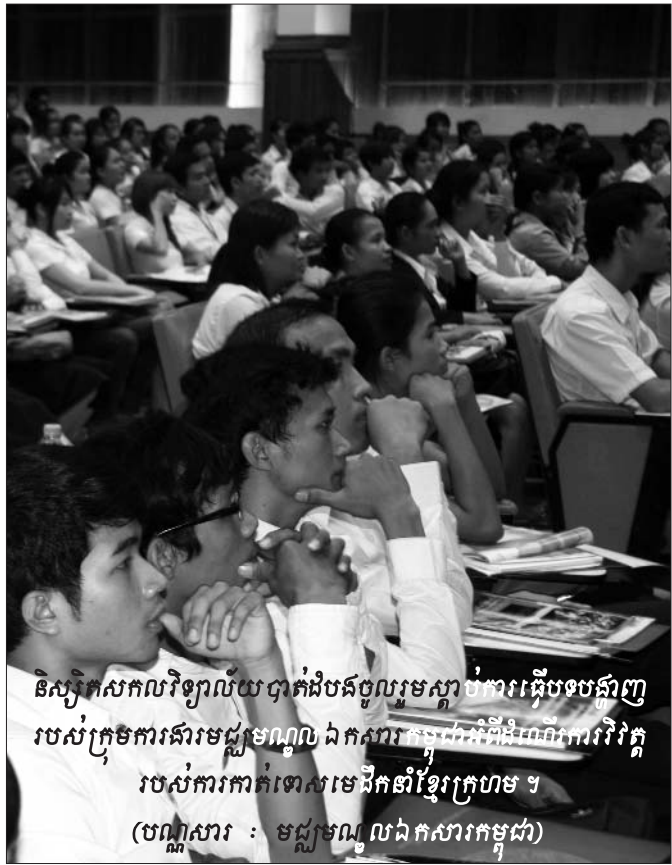
និស្សិតសកលវិទ្យាល័យបាក់ដងចូលរួមស្តាប់ការធ្វើបទបង្ហាញរបស់ក្រុមការងារមជ្ឈមណ្ឌលឯកសារកម្ពុជាស្តីពីដំណើរការវិវត្តរបស់ការកាត់ទោសមេដឹកនាំខ្មែរក្រហម ។

មេដឹកនាំខ្មែរក្រហមសម្រាប់លេខ២៦នេះ ត្រូវបានបែងចែកជាពីរផ្នែកធំៗ ។ ផ្នែកទី(១) និយាយអំពីកិច្ចប្រជុំរៀបចំសវនាការសម្រាប់សំណុំរឿង០០២/០២ ដែលក្នុងនោះរដ្ឋាភិបាលខ្មែរទៅលើ៖ ១) កិច្ចពិភាក្សាស្តីអំពីការបង្កើតអង្គជំនុំជម្រះទី២, ២) វិសាលភាពនៃសំណុំរឿង០០២/០២ និង ៣) ការពិភាក្សាអំពីកាលបរិច្ឆេទចាប់ផ្តើមសវនាការលើសំណុំរឿង០០២/០២ ។ ចំណែកផ្នែកទី២ ជាប្រភេទអត្ថបទសិក្សាស្រាវជ្រាវដែលនិយាយអំពី៖ ១) ការអនុវត្តវិធាននៃភ័ស្តុតាងនៅអង្គជំនុំជម្រះវិសាមញ្ញក្នុងតុលាការកម្ពុជា, ២) វិធានការការពារ ជនរងគ្រោះ និង សាក្សីនៅអង្គជំនុំជម្រះវិសាមញ្ញ និង ៣) សិទ្ធិទទួលបានមេធាវីការពារក្តីនៅអង្គជំនុំជម្រះវិសាមញ្ញក្នុងតុលាការកម្ពុជា ។