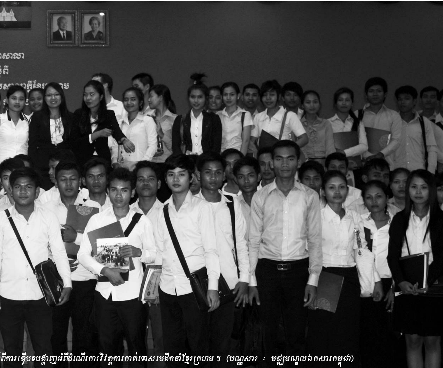
ពីការរៀបចំបញ្ជីរឿងដំណើរការវិវត្តការកាត់ទោសមេដឹកនាំខ្មែរក្រហម ។ (បណ្ណសារ : មជ្ឈមណ្ឌលឯកសារកម្ពុជា)

ច្បាប់ក្នុងការតែងតាំងចៅក្រមបម្រុងទៅជាចៅក្រមពេញសិទ្ធិ នោះទេ ។ ក្រុមមេធាវីការពារក្តី ខៀវ សំផន បានលើកឡើងទាក់ទងនឹង សំណួរស្តីពីការតែងតាំងរបស់ក្រុមប្រឹក្សាជំនុំជម្រះទី២ថា តើ ត្រូវសម្រេចដោយអង្គការសហប្រជាជាតិ ឬអង្គជំនុំជម្រះតុលាការ