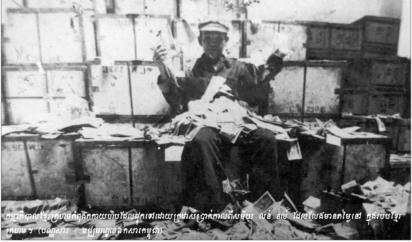
កម្មាភិបាលខ្មែរក្រហមកំពុងកាយហិបដែលដុកទៅដោយក្រដាសប្រាក់កាលពីសម័យ លន់ នល់ ដែលលែងមានកម្លែងនៅ ក្នុងរូបខ្មែរ ក្រហម ។

លោកប្រធានអង្គជំនុំជម្រះសាលាដំបូង បានសន្តិភ័យលើ បញ្ហាទំនាស់ដល់ប្រយោជន៍ក្នុងករណីជ្រើសរើសក្រុមប្រឹក្សាជំនុំ