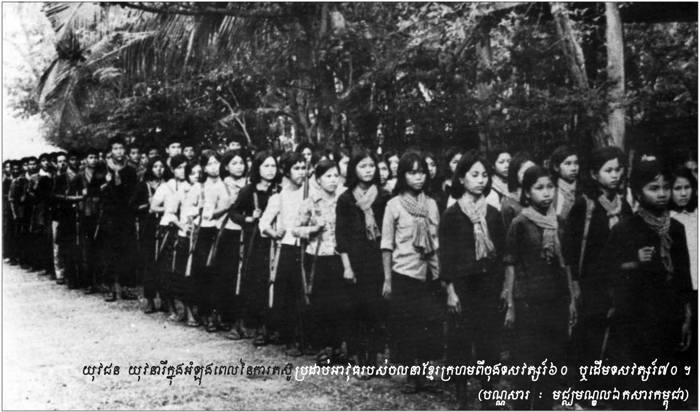
យុវជន យុវនារីក្នុងអំឡុងពេលនៃការកសាងប្រដាប់អាវុធរបស់ចលនាខ្មែរក្រហមពីចុងទសវត្សរ៍៦០ ឬដើមទសវត្សរ៍៧០។

មុននឹងចាប់ផ្តើមពិភាក្សាអំពីបញ្ហានេះ អង្គជំនុំជម្រះសាលាដំបូងបានផ្តល់ការកត់សម្គាល់ថា ប្រសិនបើអង្គជំនុំជម្រះសាលាដំបូងអាចរក្សាបាននូវបុគ្គលិកទាំងអស់របស់ខ្លួន នោះសាលាក្រុមនៅក្នុងសំណុំរឿង០០២/០១ អាចនឹងប្រកាសនៅក្នុងត្រីមាសទី២ ក្នុងឆ្នាំ២០១៤។ ដូច្នោះ អង្គជំនុំជម្រះសាលាដំបូងនឹងចាប់ផ្តើមសវនាការលើសំណុំរឿង០០២/០២ ភ្លាមបន្ទាប់ពីនោះ ប្រសិនបើវិសាលភាពសម្រាប់ការជំនុំជម្រះនៅក្នុងដំណាក់កាលទី២ នេះអាចកំណត់បានជាមុន។ អង្គជំនុំជម្រះបានបញ្ជាក់ថា ចៅក្រមទាំងអស់ដែលមាននៅក្នុងក្រុមប្រឹក្សាជំនុំជម្រះបច្ចុប្បន្នរបស់អង្គជំនុំជម្រះសាលាដំបូង ព្រមទាំងបុគ្គលិកកាំទ្របច្ចុប្បន្នទាំងអស់ ចាំបាច់ត្រូវតែផ្តោតជាចម្បងទៅលើការរៀបចំសាលា