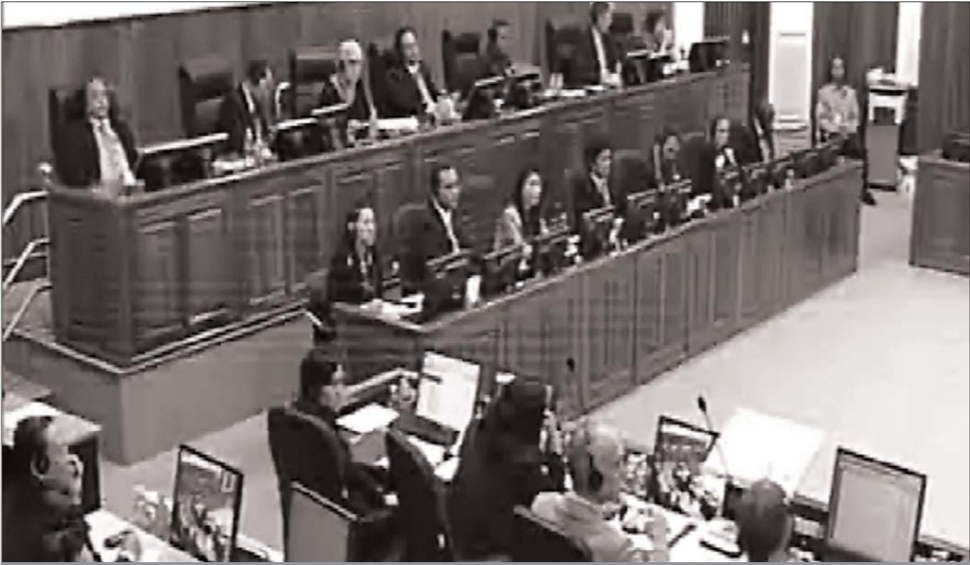
ចៅក្រម និងសហព្រះហរាជអាជ្ញា ក្នុងសាលសវនាការ (បណ្តុះបណ្តាល : មជ្ឈមណ្ឌលឯកសារកម្ពុជា)

ទោះបីជាយ៉ាងណា អង្គជំនុំជម្រះអាចបដិសេធមិនយកមកធ្វើជា