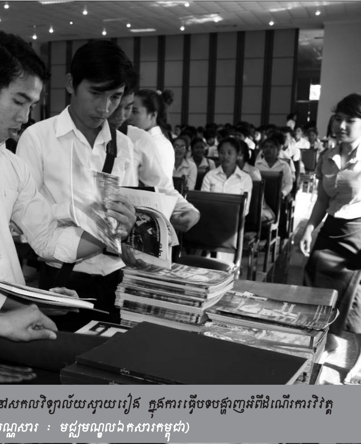
សកលវិទ្យាល័យស្វាយរៀង ក្នុងការធ្វើបទបង្ហាញអំពីដំណើរការវិវត្ត ករណីសារ : មជ្ឈមណ្ឌលឯកសារកម្ពុជា

ចំពោះកំណត់ហេតុស្តាប់ចម្លើយជាលាយលក្ខណ៍អក្សរ ឬប្រតិបត្តិការ ដែលនឹងបង្ហាញអំពីអំពើ និងអាកប្បកិរិយារបស់ ជនជាប់ចោទ ដូចបានចោទប្រកាន់នៅក្នុងដីកាបញ្ជូនរឿងទៅ ជំនុំជម្រះ លើកលែងតែមានអញ្ញត្រកម្មតិចតួចប៉ុណ្ណោះ ត្រូវចាត់ ទុកថា “មិនអាចអនុញ្ញាតឱ្យយកមកប្រើប្រាស់តាមច្បាប់ឡើយ” ប្រសិនបើក្រុមមេធាវីការពារក្តី ពុំទទួលបានឱកាសសួរដេញ