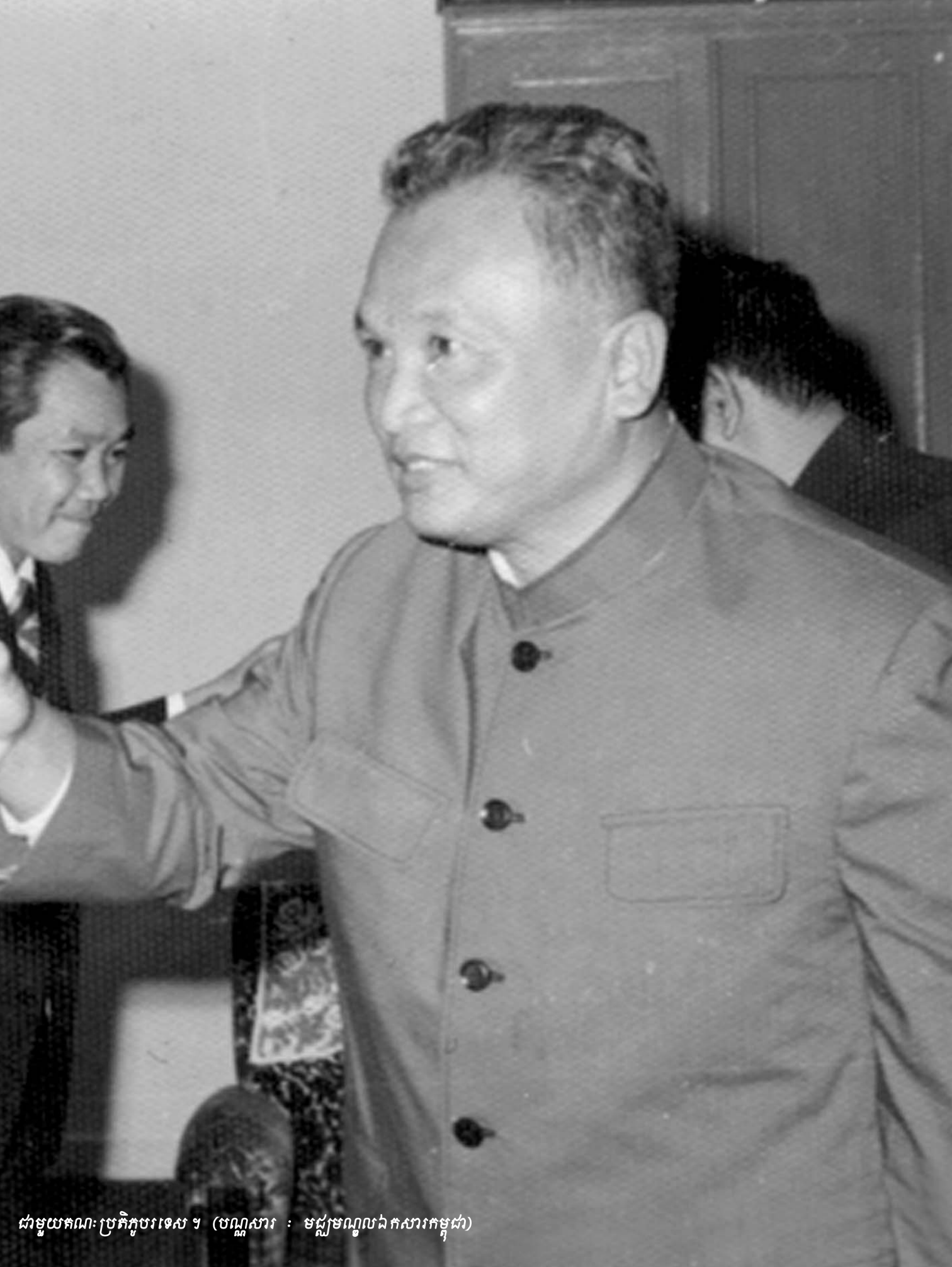
ជាមួយគណៈប្រតិភូបរទេស ។