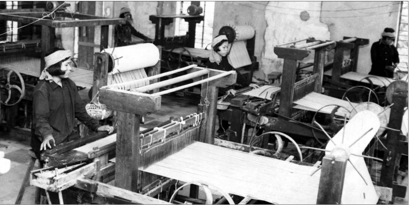
កម្មាភិបាលនារីខ្មែរក្រហមកំពុងត្រួតពិនិត្យគុណភាពនៅរោងចក្រតម្រូវក្រុងរបបកម្ពុជាប្រទេសយុវ ។

២.២) ដើម្បីអនុវត្តវិធានការការពារ ជាពិសេសថិតក្នុង អំឡុងពេលនៃនីតិវិធី តទល់នឹងរបស់កាតី និងសវនាការ សហចៅ ក្រមស៊ើបអង្កេត ឬអង្គជំនុំជម្រះ អាចប្រើមធ្យោបាយអេឡិច ត្រូនិចដូចខាងក្រោម :