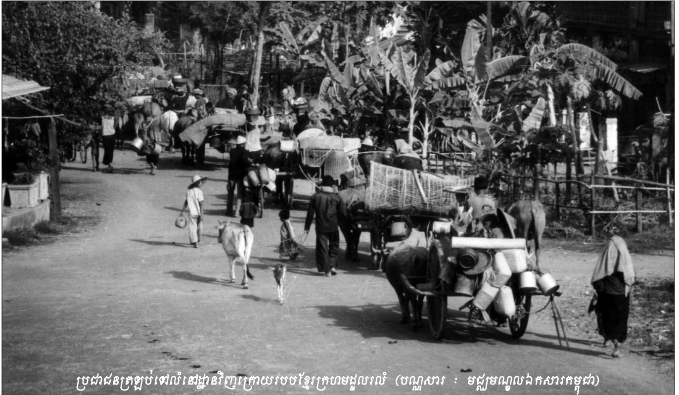
ប្រជាជនក្រឡប់ទៅលំនៅដ្ឋានវិញក្រោយរួចខ្មែរក្រហមដួលរលំ

ដូចខ្ញុំបានជម្រាបជូនអង្គការរដ្ឋបាលមកហើយកាលពីប៉ុន្មានឆ្នាំមុននេះ ក្រោយថ្ងៃរំដោះថ្ងៃ១៧ មេសា ឆ្នាំ១៩៧៥