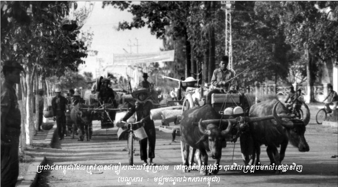
ប្រជាជនកម្ពុជាដែលត្រូវបានដង្ហែសដោយខ្មែរក្រហម ទៅកាន់តំបន់ផ្សេងៗ បានរិលក្រឡប់មកលំនៅដ្ឋានវិញ

ចុងក្រោយមេធាវី វិចទ័រ កូប៉េ សន្និដ្ឋានថា សហព្រះរាជអាជ្ញាពុំបានបង្ហាញភស្តុតាងសម្បូរតែបន្តិចបន្តួចថា មានសមាជិកណាម្នាក់របស់មជ្ឈិមបក្ស បានអនុម័ត ឬមានចេតនាសម្លាប់ ឬមានគោលនយោបាយក្នុងការសម្លាប់ទាហាន លន់ នល់ ជាប្រព័ន្ធឡើយ ។ ជាងនេះទៅទៀតសហព្រះរាជអាជ្ញា ក៏ពុំបានបង្ហាញភស្តុតាងថា បក្សកុម្មុយនីស្តកម្ពុជាមានគោលនយោបាយសម្លាប់អតីតទាហាន លន់ នល់ និងប្រជាជនសាមញ្ញ បានចូលជាធរមាននៅមុនឆ្នាំ១៩៧៥ ឬក្នុងរបបកម្ពុជាប្រជាធិបតេយ្យឡើយ ។ ដូច្នេះ ពិតប្រាកដណាស់ដែលថា បក្សកុម្មុយនីស្តកម្ពុជាពុំមាន