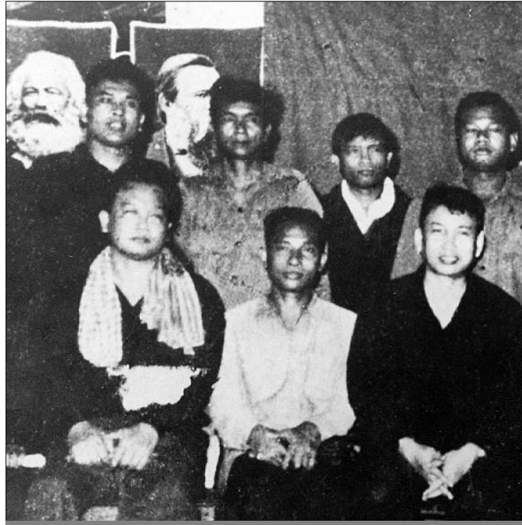
កណៈមជ្ឈិមរបស់បក្សកុម្មុយនីស្តកម្ពុជាក្នុងសម័យកសិកម្មនៃវត្សរ៍ (បណ្ណសារ : មជ្ឈិម)

ធ្វើបែបនេះ គឺមិនសមស្របទៅនឹងគោលនយោបាយរបស់បក្ស កុម្មុយនីស្តកម្ពុជានោះទេ ។ នៅដើមឆ្នាំ១៩៧៣ ដោយការទិតទំ ភស្តុភារប្រាស់រំដោះខ្លួនរបស់បក្សកុម្មុយនីស្តកម្ពុជា ដែលមាន សមមិត្ត ប៉ុល ពត ជាលេខាបក្ស និងដោយសង្គ្រាមនៅវៀតណាម ខាងត្បូងកាន់តែប្រយុទ្ធសន្ទោរសន្ទោរ កងទ័ពវៀតណាមបានបន្ត ចិត្តបន្តរំដោះគ្រប់គ្រងកងកម្លាំងប្រដាប់អាវុធ និងរដ្ឋអំណាចកម្ពុជា ហើយដកខ្លួនទៅប្រយុទ្ធជាមួយវៀតណាមខាងត្បូង ។ ពេលនោះ ហើយជាឱកាសមួយ ធ្វើឲ្យកងទ័ពប្រជាជនបដិវត្តន៍កម្ពុជា និង