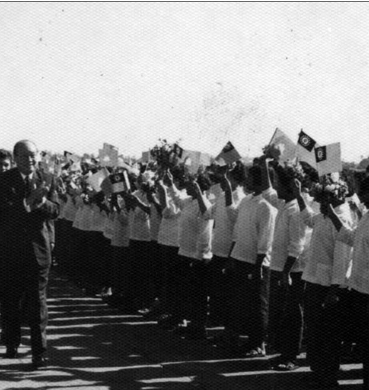
សាក្សីមន្ត្រីព្រះអង្គម្ចាស់ សុដានុវត្ត ពេលទស្សនកិច្ចនៅប្រទេសកម្ពុជាការ

ពាក់ព័ន្ធនឹងបញ្ហាភ័ស្តុតាង មេធាវី វ៉ែកកែន បានកត់សម្គាល់ថា ភ័ស្តុតាងដែលសហព្រះរាជអាជ្ញាបានប្រើប្រាស់ដើម្បីចោទប្រកាន់ ខៀវ សំផន សុទ្ធតែជាឯកសារដែលមិនអាចជឿជាក់បាន។ ចំពោះភ័ស្តុតាងផ្សេងទៀត ដូចជា សក្ខីកម្មរបស់សាក្សីដែលចូលរួមនៅចំពោះមុខអង្គជំនុំជម្រះ ពុំត្រូវបានប្រើប្រាស់ច្រើនដូចអ្វីដែលសាក្សីទាំងនោះបានបញ្ជាក់ជូនអង្គជំនុំជម្រះទេ ហើយមានពេលខ្លះ សហព្រះរាជអាជ្ញាបានកែប្រែ ឬបំភ្លៃសម្តី