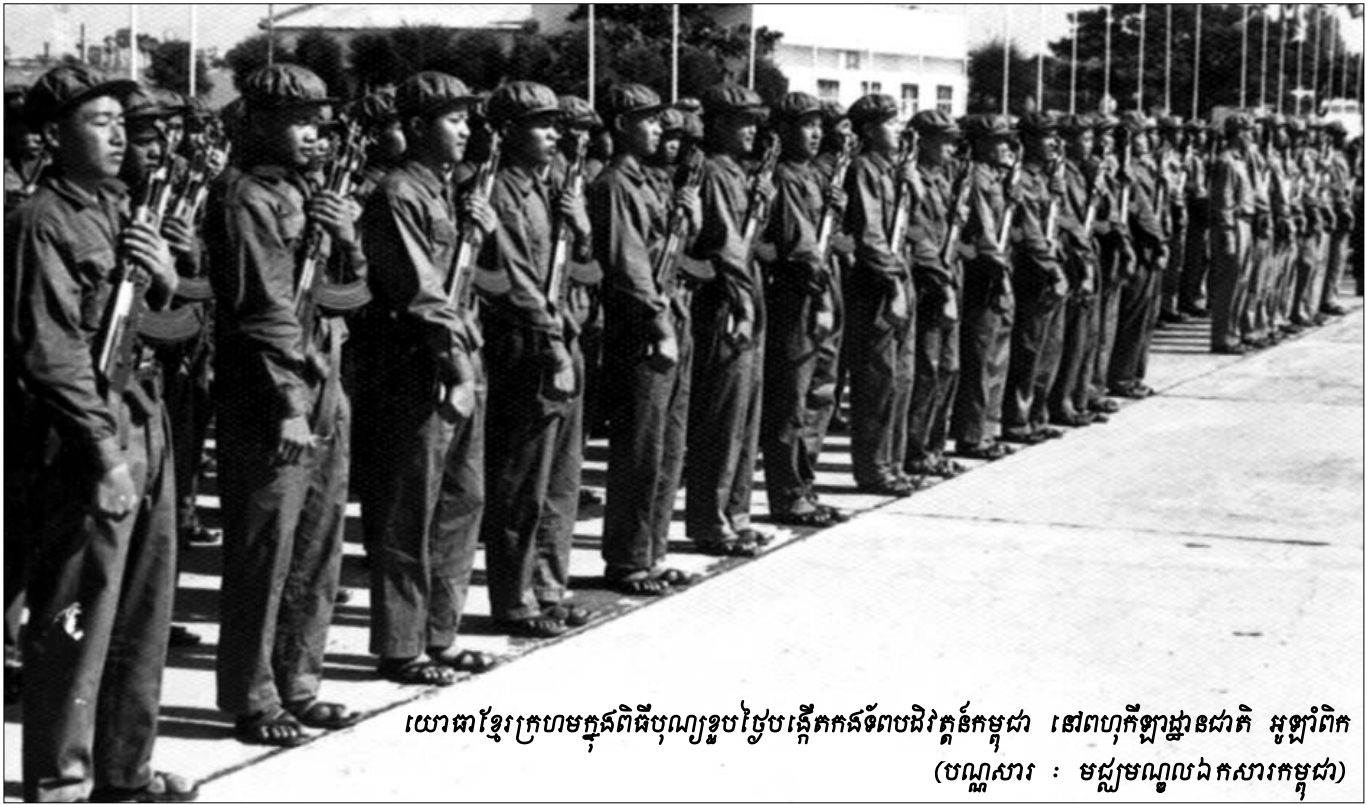
យោធាខ្មែរក្រហមក្នុងពិធីបុណ្យរួបរួមបង្កើតកងទ័ពបដិវត្តន៍កម្ពុជា នៅពហុកីឡាដ្ឋានជាតិ អូឡាំពិក

សរុបឲ្យខ្លី តាមពន្លឺនៃសវនាការនេះ ខ្ញុំឃើញច្បាស់ថា យុត្តិធម៌អាចប្រែប្រួល ទៅតាមកាលៈទេសៈ តែសច្ចៈធម៌ជាអមតៈ មិនប្រែប្រួលជាដាច់ខាត ។ ពពកខ្មៅមិនអាចបិទបាំងពន្លឺព្រះអាទិត្យ បានទេ ។ យ៉ាងណាមិញ មនុស្សអតតិ អសីលធម៌ មិនអាចភ្នាក់ភារ កុហក និងបិទបាំងភ្នែកប្រជាជន និងមហាជន មិនឲ្យមើលឃើញ នូវសច្ចៈធម៌ នៃការតស៊ូដ៏អង់អាចក្លាហានរបស់ប្រជាជនកម្ពុជា និងការទប់ទល់កម្រិតរបស់ប្រជាជន ស្នេហាសន្តិភាព និងយុត្តិធម៌ លើសកលលោកបានឡើយ ។ អាស្រ័យហេតុនេះ ដោយផ្អែកលើ ភស្តុតាង និងហេតុផលទាំងអស់ខាងលើនេះ និងជាពិសេសសេចក្តីសន្និដ្ឋានរបស់មេធាវីខ្ញុំ ខ្ញុំសូមសំណូមពរតុលាការមេត្តាសម្រេចឲ្យ ខ្ញុំបានរួចផុតពីបទចោទប្រកាន់ក្នុងសំណុំរឿងនេះ និងសូមដោះ លែងខ្ញុំឲ្យមានសេរីភាពវិញទៅតាមផ្លូវច្បាប់ ។ សូមអរគុណ! សូមអរគុណលោកប្រធាន ។