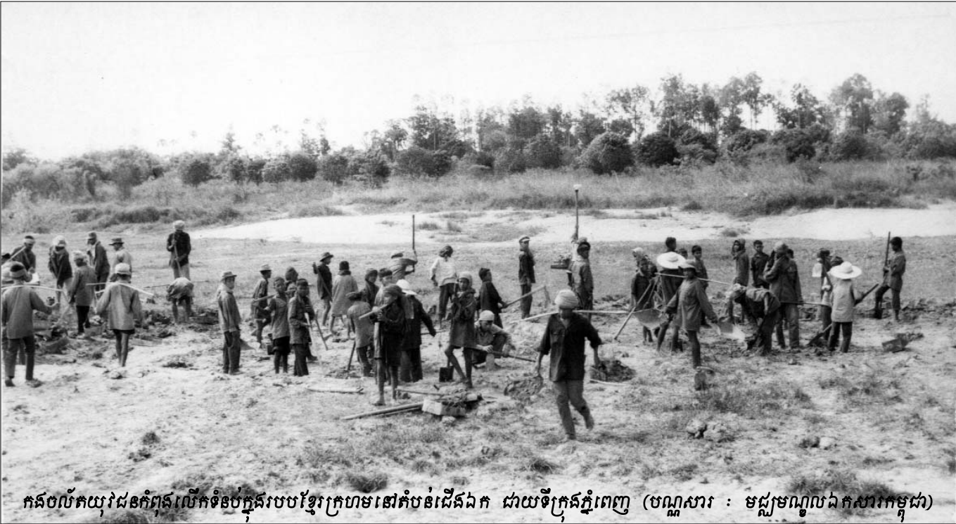
កងលើកយុវជនកំពុងលើកទំនប់ក្នុងរបបខ្មែរក្រហមនៅតំបន់ជើងឯក ដោយទីក្រុងភ្នំពេញ

នៅក្នុងឆ្នាំ១៩៧៧ គេបានប្រយុទ្ធក្នុងទីក្រុងភ្នំពេញ ដើម្បី ដណ្តើមអំណាចគ្នា បណ្តាលឲ្យនេះផ្ទះសំបែង ទ្រព្យសម្បត្តិរបស់ ប្រជាជន ស្លាប់ជនស៊ីវិល ហើយឈ្លើយសឹកមួយចំនួនរបស់ទាហាន ហ្មុនសិនប៊ុច ត្រូវបានគេបាញ់សម្លាប់ក្រោយពេលពួកគេចុះចាញ់ ។