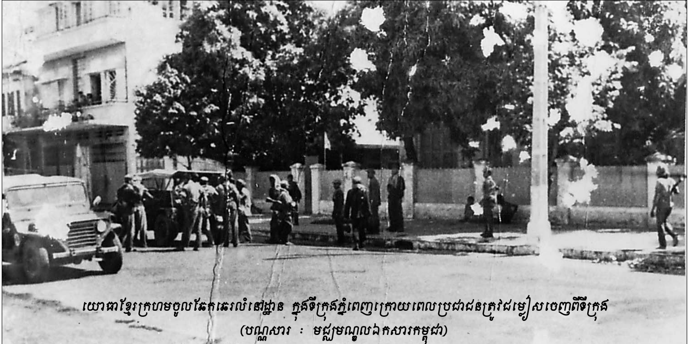
យោធាខ្មែរក្រហមចូលឆែកឆេរលំនៅដ្ឋាន ក្នុងទីក្រុងភ្នំពេញក្រោយពេលប្រជាជនត្រូវជម្លៀសចេញពីទីក្រុង

ឆ្លើយតបទៅនឹងការសន្និដ្ឋានចោទប្រកាន់របស់សហព្រះរាជអាជ្ញា ទាក់ទងនឹងការសម្លាប់អតីតមន្ត្រីរដ្ឋការ និងពលរដ្ឋ លន់ នល់ នៅទូលពោធិ៍សែនជ័យ និងការជម្លៀសប្រជាជននៅដំណាក់កាលទី១ និង ទី២ ។ ជនជាប់ចោទ នួន ជា ផ្ទាល់បានធ្វើសេចក្តីថ្លែងការណ៍នៅថ្ងៃចុងក្រោយនៃសវនាការនេះ ដោយឆ្លើយតបស្ទើរតែគ្រប់ចំណុចចោទប្រកាន់របស់សហព្រះរាជអាជ្ញា និងលើកឡើងថា កិច្ចដំណើរការជំនុំជម្រះ គឺពុំមានភាពយុត្តិធម៌នោះទេ ។ ក្រុមមេធាវីការពារក្តី ខៀវ សំផន បានធ្វើសេចក្តីសន្និដ្ឋានដោយផ្ដោតសំខាន់លើវិសាលភាពនៃការជំនុំជម្រះដំណាក់កាលដំបូង និងលើកឡើងពីអត្ថប្រយោជន៍ និងភ្នំពេញរបស់ ខៀវ សំផន ហើយឆ្លើយតបនឹងការចោទប្រកាន់របស់សហព្រះរាជអាជ្ញា ទាក់ទងនឹងការជម្លៀសប្រជាជន ការចោទប្រកាន់ទាក់ទងនឹងសហឧក្រិដ្ឋកម្មរួម និងការសម្លាប់អតីតមន្ត្រីរដ្ឋការ និងពលរដ្ឋ លន់ នល់ នៅទូលពោធិ៍សែនជ័យ ។ ជនជាប់ចោទ ខៀវ សំផន ក៏បានធ្វើសេចក្តីថ្លែងការណ៍ទាក់ទងនឹងមូលហេតុដែលមិនឆ្លើយតបសំណួររបស់ភាគីពេលកន្លងមក ។ គួរបញ្ជាក់ថា នៅក្នុងសវនាការនេះ ភាគីទាំងអស់បានដាក់បញ្ហាឯកសារភស្តុតាងរួមមាន ឯកសារដកស្រង់អត្ថបទ រូបភាព វីដេអូខ្លីៗ និងសក្ខីកម្មរបស់សាក្សី អ្នកជំនាញ និងដើមបណ្តឹងរដ្ឋប្បវេណី ដើម្បីកាំទ្រអំណះអំណាងរឿងៗខ្លួន ។