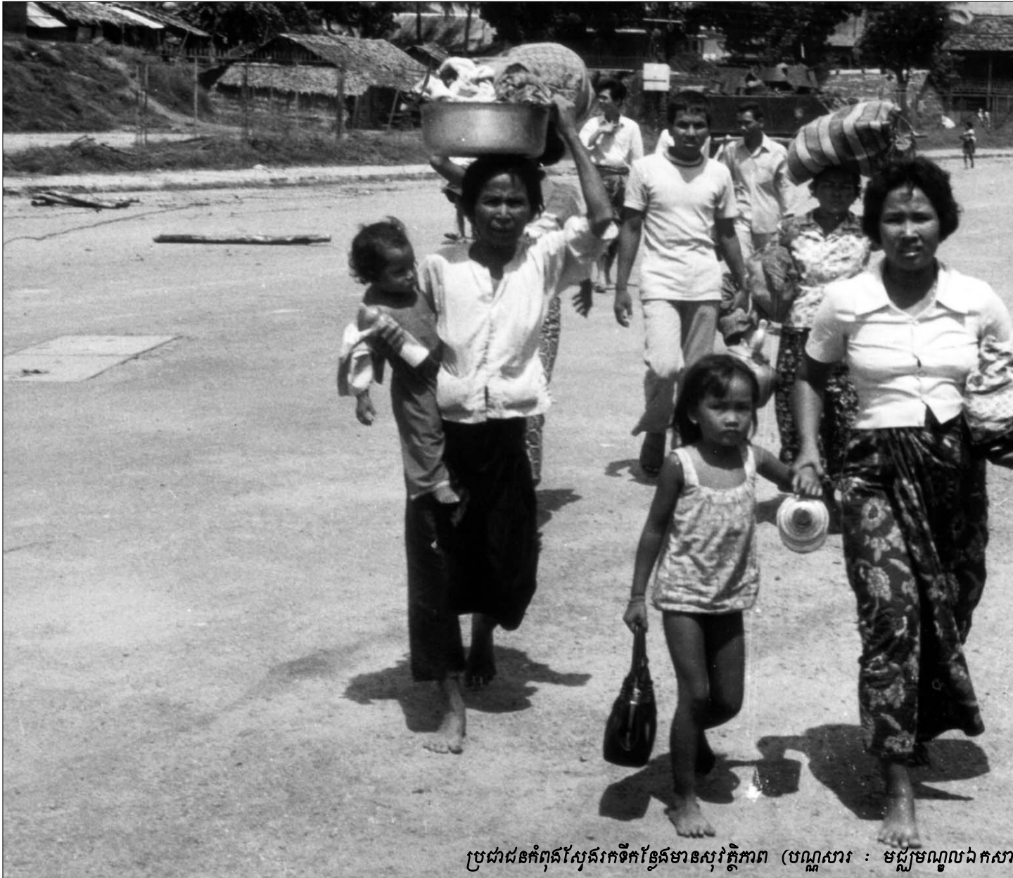
ប្រជាជនកំពុងស្វែងរកទឹកស្អាតនៅភូមិភាព

ទី៨) លើកទឹកចិត្តអាជ្ញាធរជាតិ សហគមន៍អន្តរជាតិ និង ម្ចាស់ជំនួយនានាឲ្យបង្ហាញពីសាមគ្គី ភាពរបស់ពួកគេក្នុងការ សម្រេចឲ្យបាននូវវិធានការសំណងដែលនឹងត្រូវទទួលស្គាល់ ។