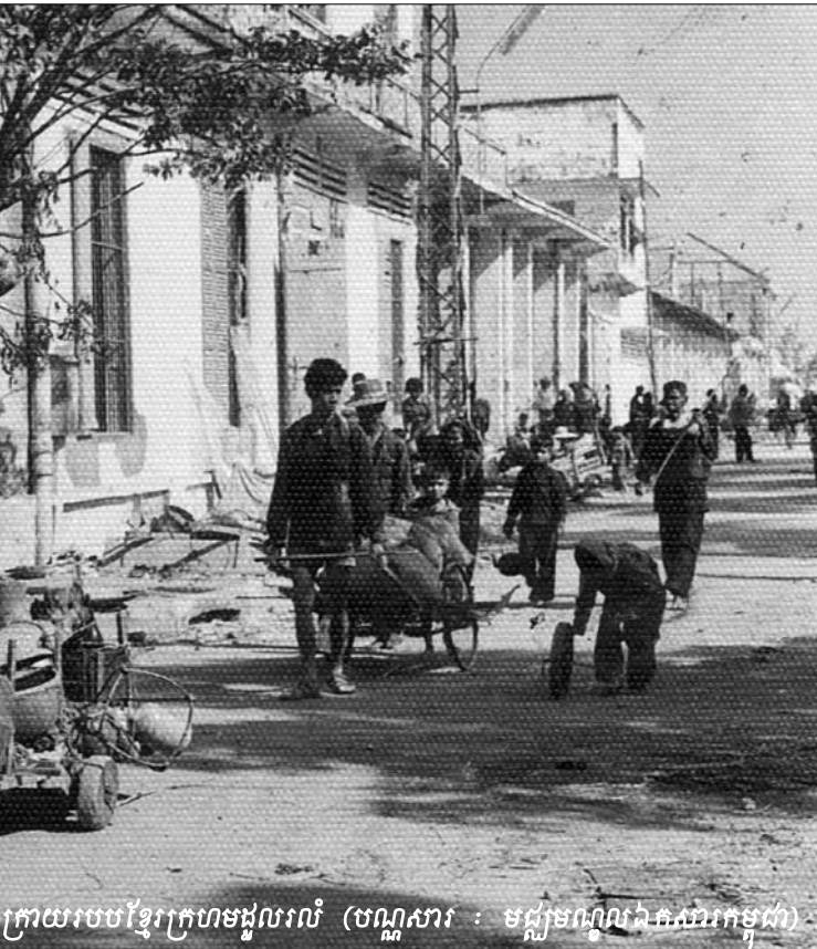
ក្រោយរបបខ្មែរក្រហមរដ្ឋបាល

មិនមែនពីនយោបាយ ឬមនោគមន៍វិជ្ជា ។ ប្រជាជនគឺជាមនុស្ស ដែលថ្នាក់ដឹកនាំនីមួយៗត្រូវយកចិត្តទុកដាក់ ហើយថែរក្សា ។ ពួកគេមិនមែនជាកម្មវត្ថុនៃសង្គ្រាម ដែលភាគីនៃសង្គ្រាមត្រូវ ដណ្តើមយកឱ្យខានតែបាន មិនថាត្រូវលះបង់ជីវិតដ៏មានតម្លៃ របស់ពួកគេកម្រិតណានោះទេ ។ លក្ខណៈជាអ្នកដឹកនាំល្អ ដែល ស្រឡាញ់ជាតិ ដូចដែលពួកលោកតែងតែអះអាងនៅចំពោះមុខ សវនាការ និងចំពោះមុខជនគ្រោះនៃរបបខ្មែរក្រហម និង ប្រជាជនខ្មែរជំនាន់ក្រោយ ពិតជាមិនអាចហាមឧត្តមគតិរបស់ លោកឱ្យទទួលខុសត្រូវនូវហេតុការណ៍ជាក់ស្តែងដែរថា ក្រោម ការដឹកនាំរបស់ពួកលោក ប្រទេសនេះបានក្លាយជាវាលពិឃាត បានបន្ទូលទុកនូវស្នាមនិងគំនិតប្រវត្តិសាស្ត្រសម្រាប់ប្រជាជន ខ្មែរជំនាន់ក្រោយ ។ ខ្ញុំជឿថា ឧត្តមគតិ និងសម្បជញ្ញៈជាជន ស្នេហាជាតិ និងហាមលោកមិនឱ្យលោកធ្វើជាមុខមាត់ដ៏សង្ហារឹម របបកម្ពុជាប្រជាធិបតេយ្យ នៅលើឆាកអន្តរជាតិ និងនៅចំពោះ មុខប្រជាជនខ្មែរជំនាន់នោះ ជំនាន់នេះ និងជំនាន់តទៅទៀតនោះ ទេ” ។