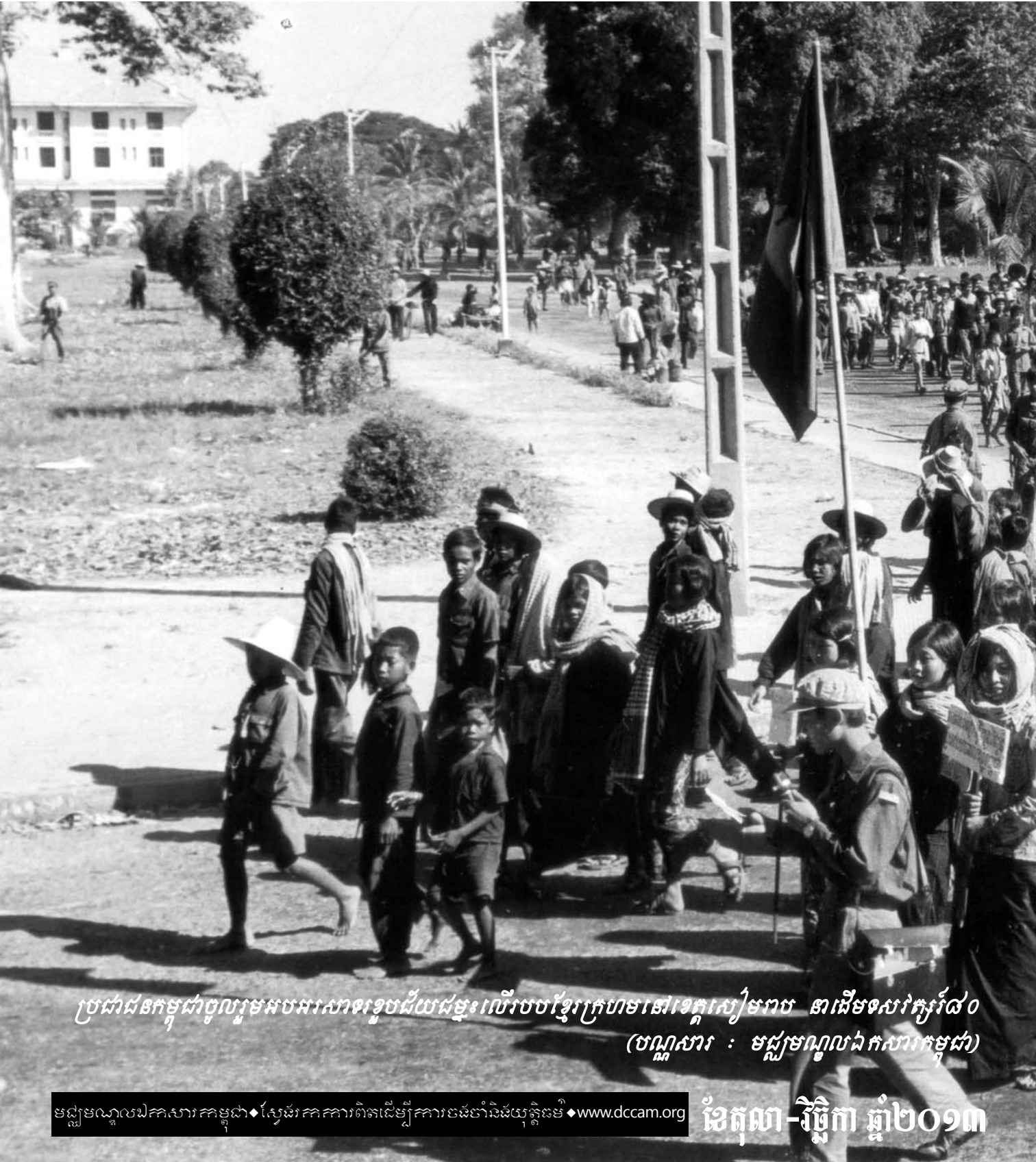
ប្រជាជនកម្ពុជាចូលរួមអបអរសាទរខួបជ័យជម្នះលើរបបខ្មែរក្រហមនៅទេតសៀមរាប នាដើមសតវត្សរ៍៨០