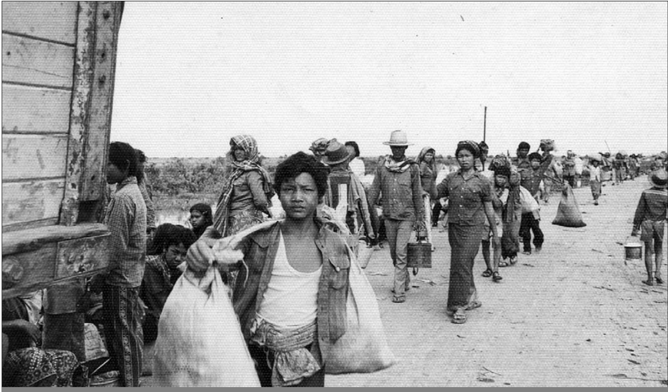
ប្រជាជនត្រូវចាប់ទៅលំនៅដ្ឋានវិញក្រោយរួចបង្ក្រាមរួមរាល់ (បណ្ណសារ : មជ្ឈមណ្ឌលឯកសារកម្ពុជា)

សហព្រះរាជអាជ្ញារងអន្តរជាតិ វីលៀម ស្ទីត បានបន្តលើក ឡើងពីទុក្ខកម្ម ដែលកើតចេញពីការជម្លៀសដំណាក់កាលទី២ ដោយបង្ហាញថា វាកើតចេញពីលទ្ធផលនៃផែនការទុក្ខដ្ឋរៀបចំ ដោយ ខៀវ សំផន, ឆួន ជា រួមជាមួយនឹងសមាជិកផ្សេងទៀតនៃ មជ្ឈិមបក្ស ។ ព្រះរាជអាជ្ញាបានបន្តទៀតថា វាមានភាពដូចគ្នា នឹងការសម្លាប់រង្គាលនៅទូលពោធិ៍សែន ដែលកើតឡើងដោយសារ ការរៀបចំទុកជាមុនយ៉ាងហ្មត់ចត់ ដើម្បីធ្វើទុក្ខបុកម្នេញ និងកាប់