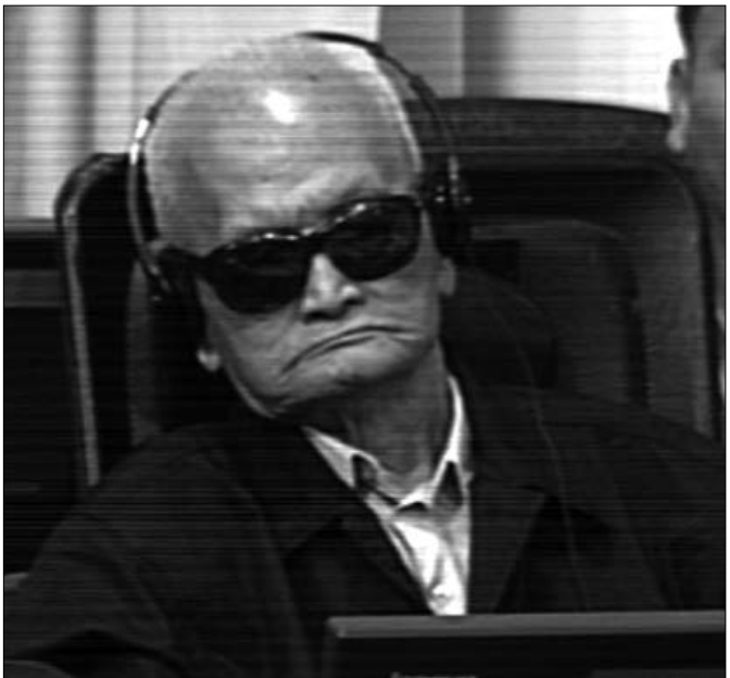
នួន ជា ក្នុងបន្ទប់សវនាការ

ក្លាយជាជនជ្រុលនិយមនៅក្នុងឆ្នាំ១៩៧០ នៅពេលដែលគាត់ ជាមនុស្សនៅក្នុងលំដាប់ទី២ (ជាបទទី២) នៃបក្សកុម្មុយនិស្ត កម្ពុជា ហើយក៏ជាមេដឹកនាំរបបកម្ពុជាប្រជាធិបតេយ្យ ។ នួន ជា ជាមនុស្សយោធាយោធាម្នាក់ដែលយល់ថា ចក្រពត្តិនិយមបរទេស សេ.អ៊ី.អា កា.ហ្សេ.បេ និងគិញវៀតណាម បង្កប់នៅក្របខ័ណ្ឌនៃ ទាំងអស់នោះ គឺជាបុរស ។ នួន ជា យល់ថា “សិទ្ធិមនុស្សបំផុត សារៈសំខាន់នៃសិទ្ធិមនុស្ស ត្រូវកាន់អាវុធដើម្បីប្រយុទ្ធនឹង ខ្មាំង” ។ នួន ជា មានចេតនាសម្លាប់បងប្អូន ដែលចូលរួមបដិវត្តន៍ ជាមួយខ្លួនអស់រយៈពេល១៥ឆ្នាំទៀតផង ។ សូម្បីជនជ្រុលនិយម ប៉ូល ពត ក៏គិតថា នួន ជា ជាមនុស្សរឹងមាំខ្លាំងពេកដែរ ។ សហ