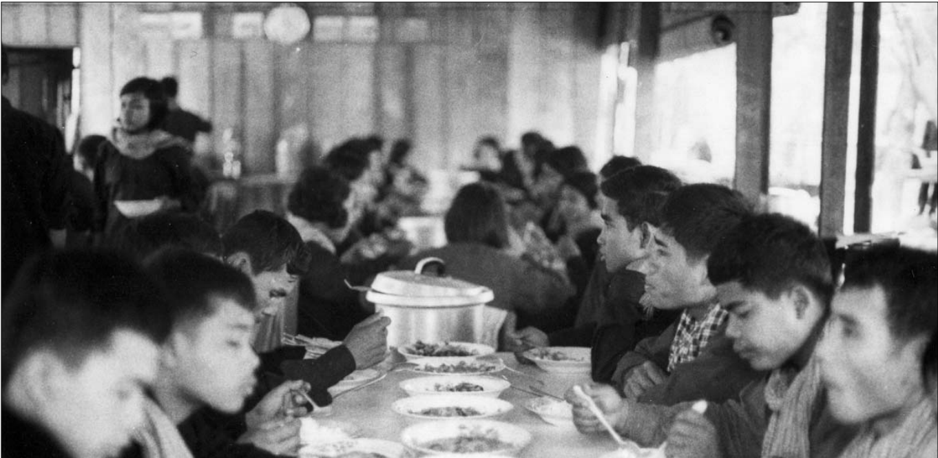
កម្មាភិបាលខ្មែរក្រហមកំពុងហូបបាយជុំគ្នាក្នុងកងទ័ពប្រយុទ្ធបក្ស

គៗមកក្រោយទៀតក៏នៅតែយ៉ាងនេះ” ។ មេធាវី សំអុន បានអះអាងថា មេធាវីបានធ្វើការសន្និដ្ឋានថា បក្សកុម្មុយនីស្តកម្ពុជាចាប់ផ្តើមនិយាយពីការចូលរួមរបស់ ខៀវ សំផន នៅក្នុង រចនាសម្ព័ន្ធបក្ស ក្រោយពីមានរដ្ឋប្រហារទម្លាក់សម្តេចព្រះ នរោត្តម សីហនុ នៅថ្ងៃទី១៨ ខែមីនា ឆ្នាំ១៩៧៥ តែប៉ុណ្ណោះ ។ នៅក្រោយរដ្ឋប្រហារ ប៉ុល ពត និងសម្តេច សីហនុ នៅទីក្រុងប៉េកាំង ដូចគ្នា ។ សម្ព័ន្ធភាពរវាងអ្នកទាំងពីរក៏បានចាប់ផ្តើមឡើង ។ មេធាវីបន្តថា នៅពេលនោះ ប៉ុល ពត មើលឃើញភ្លាមៗនូវអត្ថប្រយោជន៍ក្នុងការពង្រីកចលនាបដិវត្តន៍ដោយយក ខៀវ សំផន ធ្វើជាអ្នកទាក់ទងជាមួយនឹង