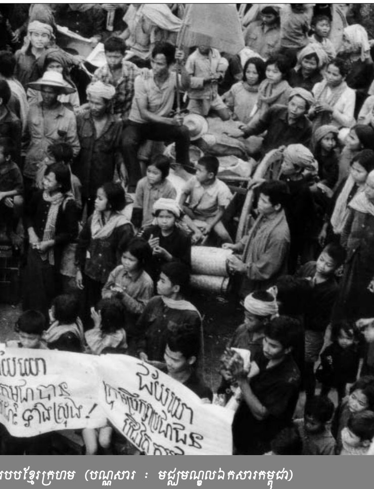
រូបថតខ្មែរក្រហម

សហព្រះរាជអាជ្ញាអន្តរជាតិ វីលៀម ស្ថិត បានរំពឹងទុំនាក់ទំនងរវាងមេដឹកនាំទាំងបី គឺ ប៉ុល ពត, ឆួន ជា និង ខៀវ សំផន ។ ឆួន ជា និង ប៉ុល ពត ត្រូវបានកេណែនាំឲ្យស្តារសមាជិករួមបក្សនៅក្នុងឆ្នាំ១៩៥៥ ។ ពួកគាត់ធ្វើការជាមួយគ្នានៅអំឡុងឆ្នាំ១៩៦០ ក្នុងការរៀបចំបក្សកុម្មុយនិស្ត និងយុទ្ធសាស្ត្របក្ស ។ នៅក្នុងឆ្នាំ១៩៦០ ឆួន ជា និង ប៉ុល ពត ក្លាយជាមេដឹកនាំកំពូលនៃចលនានោះ ។ ចំណែក ខៀវ សំផន និង ប៉ុល ពត ធ្លាប់ជាមិត្តរួមថ្នាក់ជាមួយគ្នានៅខេត្តក្នុងទសវត្សរ៍ ឆ្នាំ១៩៤០ ។ ឆួន ជា បានជួប ខៀវ សំផន ដំបូងនៅឆ្នាំ១៩៦៥-៧០ នៅជិតភ្នំឱវាលពេលដែល ខៀវ សំផន ស្នាក់នៅទីបញ្ជាការ តាម៉ុក បើសិនជាអ្នកទាំងពីរពុំបានជួបគ្នាពីមុននៅក្នុងគណៈកម្មាធិការរបស់បក្សនៅភ្នំពេញទេ ។