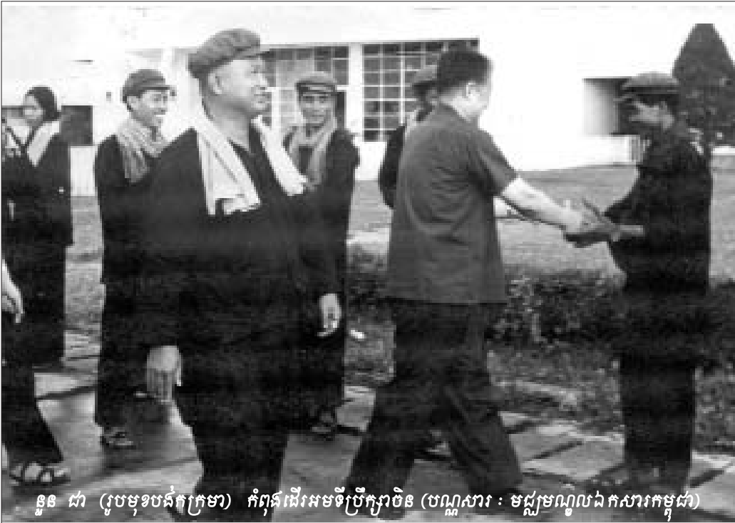
នួន ជា (រូបមុខបង់ក្រកមា) កំពុងដើរអមទីប្រឹក្សាមិន

ខទី២ បើប្រជាជននៅ ទីក្រុងភ្នំពេញ តើមធ្យោបាយ ដឹកជញ្ជូនស្បៀងយកទៅបែក ជូនប្រជាជនយ៉ាងម៉េច? យើងពេលនោះ តាមក្តាប់បាន គឺថាក្នុងទីក្រុងភ្នំពេញជួបបញ្ហា