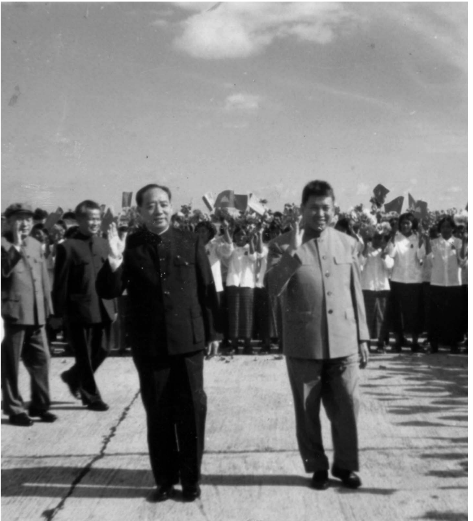
គណៈប្រតិភូចិន ដឹកនាំដោយ វ៉ាន់ ដុងស៊ីង (ឆេង) អំឡុងពេលធ្វើដំណើរទស្សនកិច្ចមកប្រទេសកម្ពុជា ក្នុងខែវិច្ឆិកា ឆ្នាំ១៩៧៨ ។ ទៅទទួល និង អមដំណើរពីព្រលានយន្តហោះពោធិចិនតុង ដោយ ប៉ុល ពត (ស្តាំ) និងកម្មាភិបាលជាន់ខ្ពស់ខ្មែរក្រហមជាច្រើនរូបផ្សេងទៀត ។