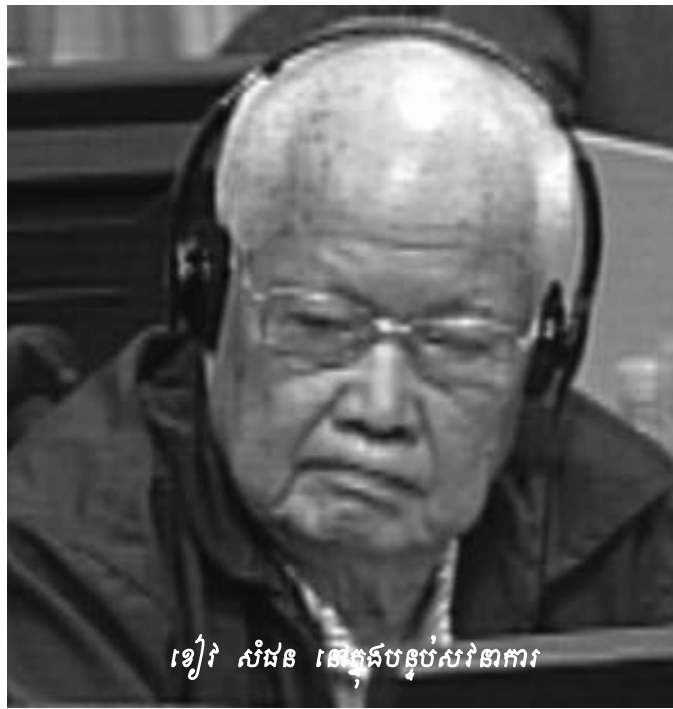
ខៀវ សំផន នៅក្នុងបន្ទប់សវនាការ

ដែលពេលនោះគឺមានការទម្លាក់គ្រាប់បែកនៅបង់ក្លាដែស ។ មានអត្ថបទជាច្រើនដែលសាក្សីបានសរសេរនៅក្នុងកាសែត ញូវយ៉កថាមស៍ ។ សាក្សីបានជម្រាបជូនអង្គជំនុំជម្រះទៀតថា នៅក្នុងអំឡុងពេលប្រទេសកម្ពុជា កំពុងមានសង្គ្រាមនោះ ពុំមែនមានតែបណ្តាញសារព័ត៌មានពីសហរដ្ឋអាមេរិកមួយនោះទេ ដែល