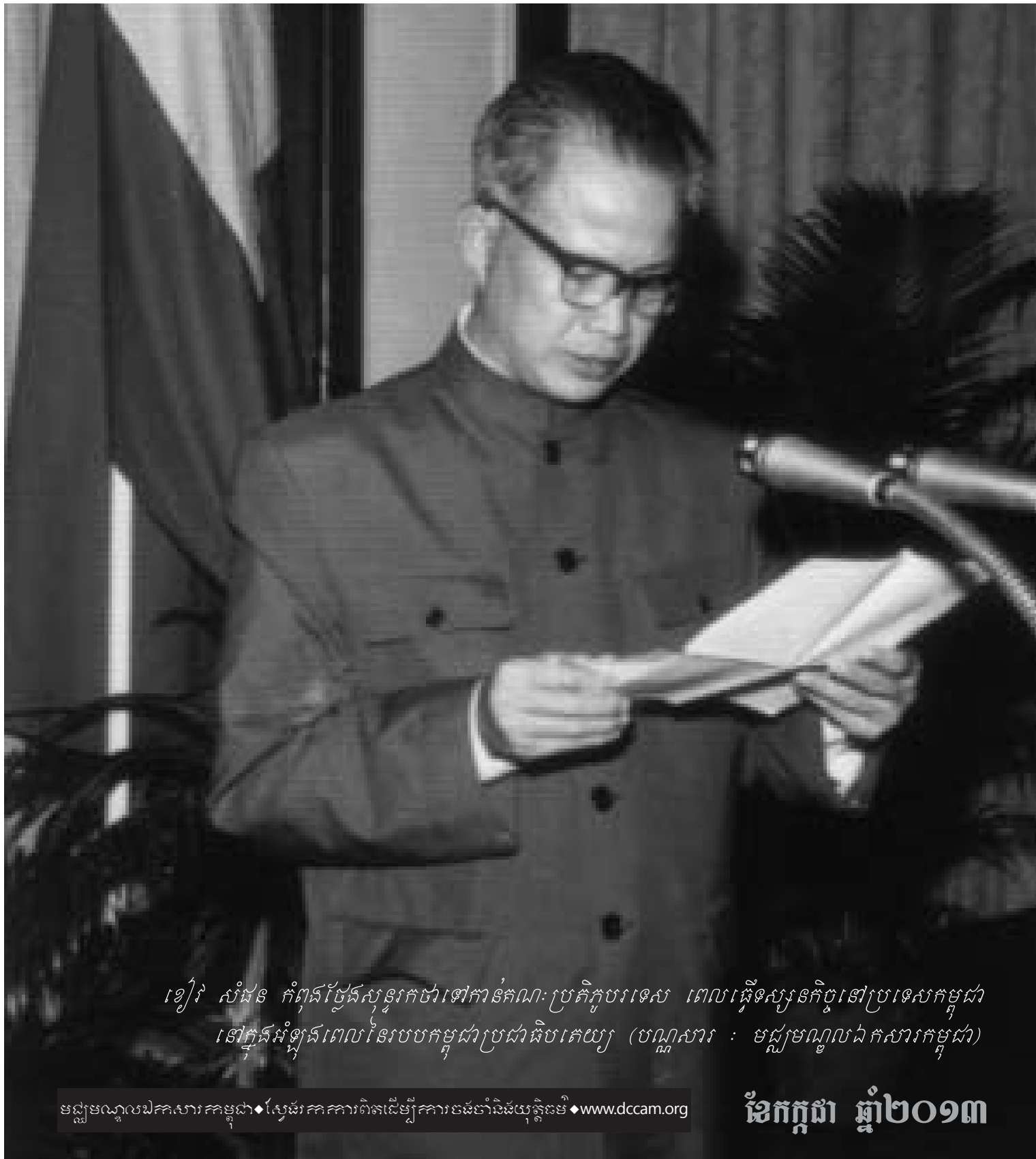
ខៀវ សំផន កំពុងថ្ងែងសុន្ទរកថាទៅកាន់គណៈប្រតិភូបរទេស ពេលធ្វើទស្សនកិច្ចនៅប្រទេសកម្ពុជា នៅក្នុងអំឡុងពេលនៃរបបកម្ពុជាប្រជាធិបតេយ្យ