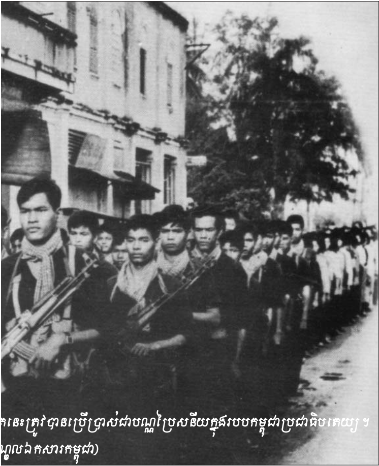
កន្លែងត្រូវបានប្រើប្រាស់ជាបណ្តុំប្រសិនបើក្នុងរបបកម្ពុជាប្រជាធិបតេយ្យ ។