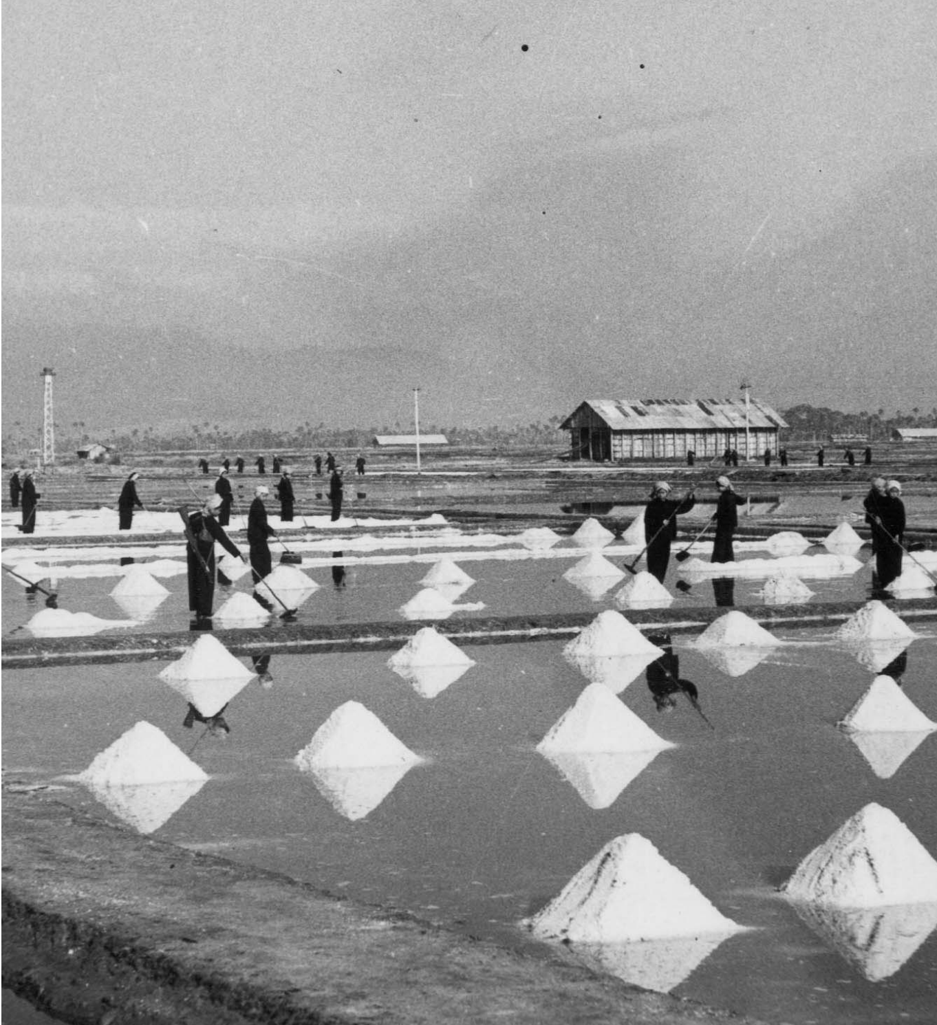
កម្មាភិបាលខ្មែរក្រហមកំពុងដលិតអំបិល នៅការដ្ឋានស្រែអំបិល ខេត្តកំពត ។

ហើយញឹកសាច់ ដួនកាលមានអារម្មណ៍អត់ល្អធ្វើឲ្យខឹងកូន អាចនៃ កូនបើមិនវៃដូចជាអារម្មណ៍របស់យើងអត់ស្ងប់ ។ សវនាការ ស្តាប់សេចក្តីថ្លែងទុក្ខសោករបស់ដើមបណ្តឹងរដ្ឋប្បវេណី នៅក្នុង សំណុំរឿង០០២ បានបញ្ចប់នៅថ្ងៃទី៤ ខែមិថុនា ឆ្នាំ២០១៣ ។