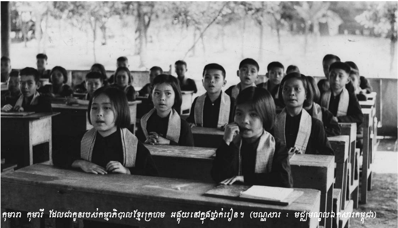
កុមារ កុមារី ដែលជាកូនរបស់កម្មាភិបាលខ្មែរក្រហម អង្គុយនៅក្នុងថ្នាក់រៀន ។

លោក ពេជ អង្គ មេធាវីជាតិនាំមុខតំណាងដើមបណ្តឹងរដ្ឋប្ប វេណី បានចាប់ផ្តើមសំណួរ ដោយស្នើឱ្យសាក្សីបញ្ជាក់ឡើងវិញ ទាក់ទងនឹងមន្ទីរក-៣ ។ បន្ទាប់មក មេធាវី ពេជ អង្គ បានបន្តសួរ ទាក់ទងនឹងអត្ថប័ត្ររបស់ជនជាប់ចោទ ខៀវ សំផន ដោយស្នើឱ្យ សាក្សីពន្យល់អំពីមូលហេតុដែលនាំឱ្យសាក្សីលើកឡើងថា ខៀវ សំផន ជាមនុស្សស្មោះត្រង់ ។ សាក្សី ទន់ ស្ងៀន បានពន្យល់ថា មូលហេតុដែលកាត់លើក ឡើងថា ខៀវ សំផន ជាមនុស្សស្មោះ ត្រង់ដោយសារតែ ខៀវ សំផន មិនលោភលន់ មិនរំលោភអំណាច មិនចង់មានចង់បានដោយអំពើខុសច្បាប់ ឬបង្ខំបង្ខំបង្ខំប្រទេស ជាតិ ។ ម្យ៉ាងវិញទៀត ខៀវ សំផន ជា បុគ្គលដែលមានមហិច្ឆតា ស្នេហាជាតិ ។