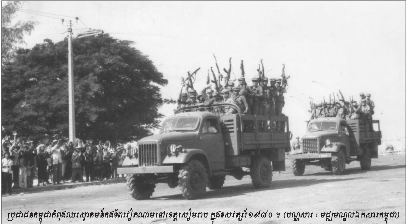
ប្រជាជនកម្ពុជាកំពុងឈរស្រាតមន៍កងទ័ពវៀតណាមនៅទេត្តសៀមរាប ក្នុងទសវត្សរ៍១៩៧០ ។

បាញ់សម្រុកចូលមកទីក្រុងភ្នំពេញ គឺសំដៅមកដល់សាលារៀន ដែលមានសុទ្ធតែសិស្សនៅសាលាបឋមសិក្សា និងទិដ្ឋភាពទីក្រុង ភ្នំពេញ ត្រូវឲ្យតក់ស្លុតបំផុត កុមារត្រូវរួបរួមនៅក្នុងថ្នាក់ឈាម នៅ មានជីវិត ប៉ុន្តែមិនអាចរស់បានយូរទេ ។ យ៉ាងហោចណាស់ កុមារ ១០នាក់ បានស្លាប់ភ្លាមៗ ហើយមាន២៥-៣០នាក់ទៀត រង របួស” ។ សាក្សីបានបំភ្លឺថា ការពិតគ្រាប់រ៉ុក្កតនេះ ធ្វើឡើងដោយ ប្រទេសចិន ។ ខ្មែរក្រហមបានប្រើប្រាស់គ្រាប់រ៉ុក្កតទាំងនេះ ហើយគ្មានមធ្យោបាយអ្វីពិតប្រាកដ ដែលថាការណាស់របស់វាបាញ់