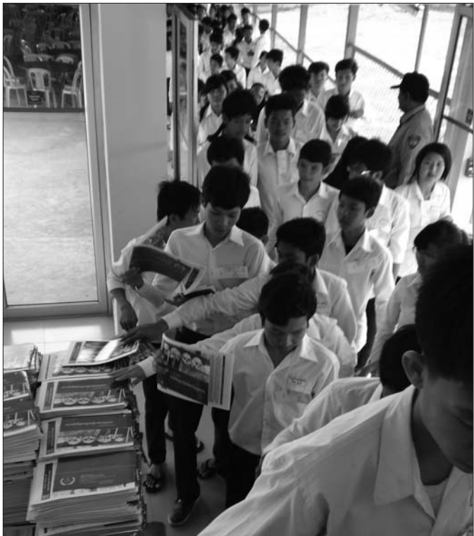
សិស្សកំពុងឈរកម្រងជួរដើម្បីចូលក្នុងបន្ទប់សវនាការ

ធ្វើឡើងដោយមានភាពបទបែនទៅតាមស្ថានភាពរបស់សាក្សី អ្នកជំនាញ និងដើមបណ្តឹងរដ្ឋប្បវេណី ដែលស្នើសុំដោយភាគីនៃ សំណុំរឿង និងពេលវេលាសួរដេញដោល ។ ដោយហេតុថា ការ ផ្តល់សក្ខីកម្មខ្លះត្រូវធ្វើពីបរទេស ដូច្នេះតម្រូវឲ្យអង្គជំនុំជម្រះបើក សវនាការលឿនជាងពេលវេលាដែលបានកំណត់ជាដើម ។ ជា ទូទៅការសួរដេញដោលសាក្សី ដើមបណ្តឹងរដ្ឋប្បវេណី និងអ្នក ជំនាញ ចាប់ផ្តើមពីភាគីណាដែលស្នើឲ្យមានការស្តាប់សក្ខីកម្ម បុគ្គលនោះ បន្ទាប់ពីប្រធានអង្គជំនុំជម្រះ ។ ការសួរដេញដោល ដើមបណ្តឹងរដ្ឋប្បវេណី ចាប់ផ្តើមពីមេធាវីនាំមុខតំណាងដើម បណ្តឹងរដ្ឋប្បវេណីសហព្រះរាជអាជ្ញា និងចុងក្រោយ មេធាវី ការពារក្តីជាបន្តបន្ទាប់ ។ សាក្សីជំនាញ ឬសាក្សីធម្មតា ដែលផ្តល់ សក្ខីកម្មតាមសំណើសហព្រះរាជអាជ្ញា ត្រូវចាប់ផ្តើមតាមលំដាប់ លំដោយពីអង្គជំនុំជម្រះ សហព្រះរាជអាជ្ញា មេធាវីនាំមុខតំណាង ដើមបណ្តឹងរដ្ឋប្បវេណី និងមេធាវីការពារក្តី ។ នៅក្នុងការស្តាប់ សក្ខីកម្មសាក្សី ឬអ្នកជំនាញ តាមសំណើរបស់មេធាវីការពារក្តី ត្រូវចាប់ផ្តើមពីអង្គជំនុំជម្រះ មេធាវីការពារក្តី សហព្រះរាជអាជ្ញា និងមេធាវីនាំមុខតំណាងដើមបណ្តឹងរដ្ឋប្បវេណី ។