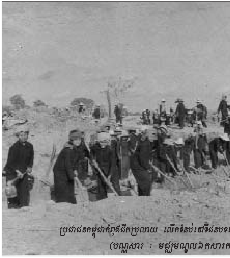
ប្រជាជនកម្ពុជាកំពុងដឹកប្រលាយ លើកទំនប់នៅទីជនបទ (បណ្ណសារ : មជ្ឈមណ្ឌលឯកសារកម្ពុជា)

ចំណែកជនជាប់ចោទ នួន ជា បានបង្ហាញដំហែររបស់ខ្លួនតាមរយៈមេធាវីអន្តរជាតិ រ៉ិចទ័រ កុបប៊ែ ថា ខ្លួននឹងមិនលះបង់សិទ្ធិនៅស្ងៀមមិនឆ្លើយតបទេ។ នេះមានន័យថា នួន ជា នឹងឆ្លើយសំណួរទាំងឡាយណាដែលអាចធ្វើទៅបាន។