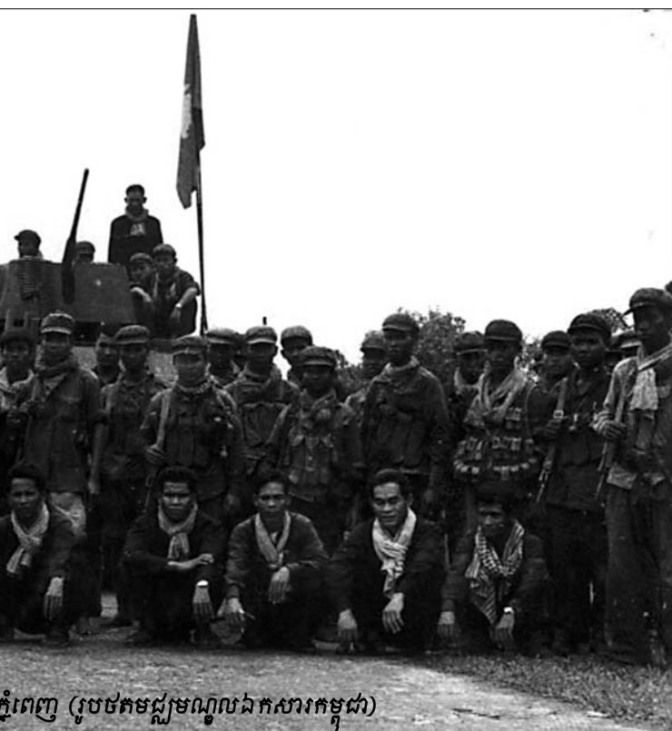
ភ្នំពេញ (រូបថតមជ្ឈមណ្ឌលឯកសារកម្ពុជា)

សំណួរចុងក្រោយរបស់អង្គជំនុំជម្រះ ទាក់ទងនឹងការចេញ រវាងមន្ត្រីនៅក្នុងរបបសាធារណៈរដ្ឋខ្មែរ និងកម្មាភិបាលខ្មែរ