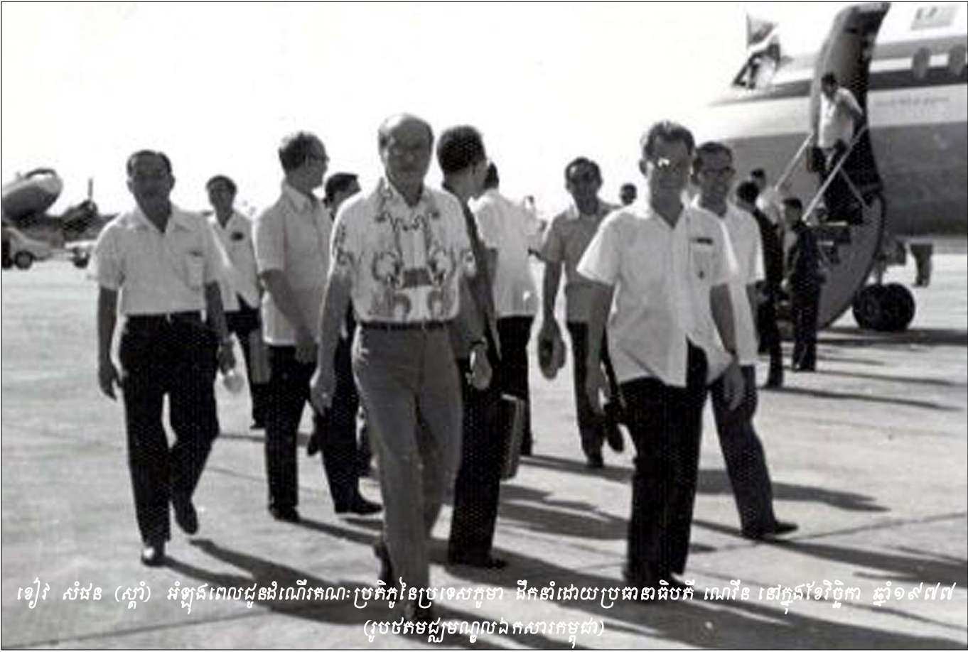
ខៀវ សំផន (ស្តាំ) អំឡុងពេលដូនដំណើរគណៈប្រតិភូនៃប្រទេសកម្ពុជា ដឹកនាំដោយប្រធានាធិបតី ណារ៉ុន នៅក្នុងខែវិច្ឆិកា ឆ្នាំ១៩៧៧

នរណាទេ នៅពេលឃើញអ្នកទាំងនោះត្រូវបញ្ជូនមកដល់ជំរំរបស់ ខ្លួន ដែលជាកន្លែងសម្រាប់ពួកគេស្នាក់បណ្តោះអាសន្ន តែ ប៉ុណ្ណោះ។ សាក្សីគ្រាន់តែសន្មតដោយខ្លួនឯង ថាមនុស្សទាំងនោះ អាចជាលោកសង្ឃ ដោយសារឃើញសក់របស់ពួកគេទើបតែដុះ។ ឆ្លើយតបនឹងសំណួរបន្ទាប់ សាក្សីបានជម្រាបជូនអង្គជំនុំជម្រះថា ក្រោយថ្ងៃទី៧ ខែមករា ឆ្នាំ១៩៧៧ សាក្សីពុំបាន រក្សាឯកសារ ណាមួយ ឬសេររបស់ឃ្នាំងទុកនោះទេ។ សាក្សីបានចាកចេញ