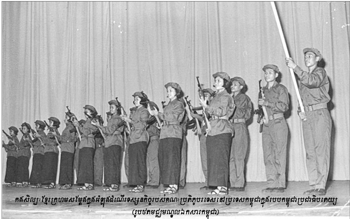
កងសិល្បៈ ខ្មែរក្រហមសម្តែងក្នុងអំឡុងដំណើរទស្សនកិច្ចរបស់កុណៈ ប្រតិភូបរទេសនៅប្រទេសកម្ពុជាក្នុងរបបកម្ពុជាប្រជាធិបតេយ្យ