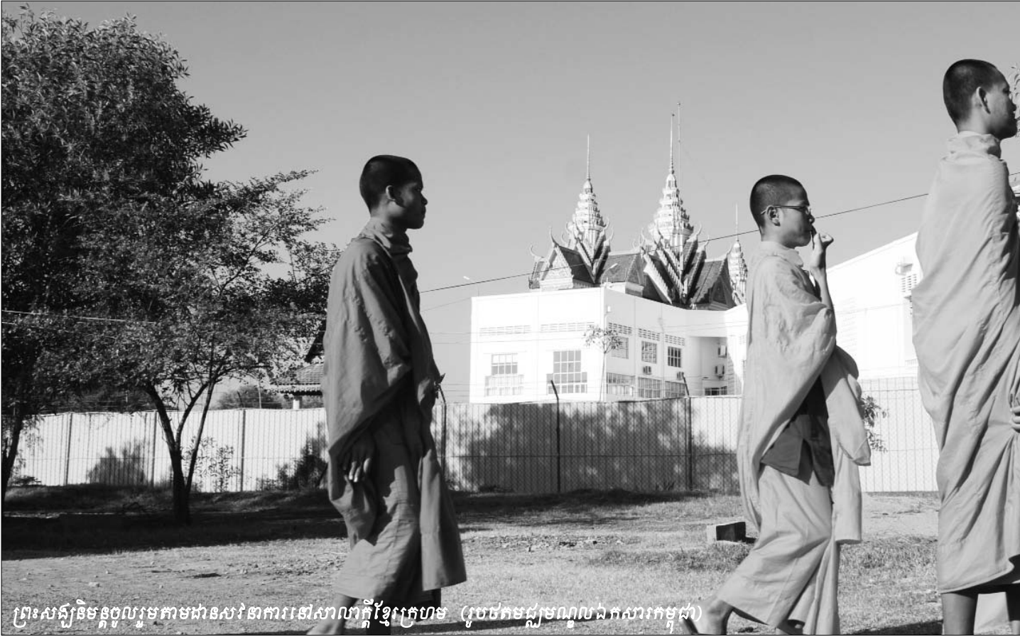
ព្រះសង្ឃនិមន្តចូលរួមតាមដានសវនាការនៅសាលាក្តីខ្មែរក្រហម

គាត់បានប្រមូលគ្រឿងសព្វវុធ និងគ្រាប់រំសេវផ្សេងៗពីទាហាន លន់ លន់ រួចចាប់បញ្ជូនខ្លួនទាហានទាំងនោះទៅសមរក្សមិក្រោយ ។ បន្ទាប់ពីវាយបែកទីក្រុងភ្នំពេញបានប៉ុន្មានខែ គាត់ត្រូវបានបញ្ជូន ទៅស្រុកអង្គរបូរី ខេត្តតាកែវ ។ នៅទីនោះ ជាង មានតួនាទីជាអ្នក ដឹកនាំកម្លាំងការពារព្រំដែននៅជាប់រៀនណាម និងចូលរួមបង្ក បង្កើនផលជាមួយកសិករនៅក្នុងតំបន់នោះ ។ នៅចុងឆ្នាំ១៩៧៧ ជាង បានចូលរួមប្រជុំជាមួយ ឈិត ជឿន ហៅ ម៉ុក ប្រធាន ភូមិភាគនិរតី អំពីដែនការបង្កើន និងបញ្ជូនកងទ័ពទៅការពារ ព្រំដែននៅខេត្តស្វាយរៀងក្នុងភូមិភាគបូព៌ា បន្ទាប់ពីមេភូមិភាគ នេះត្រូវបានចោទជាក្បត់ ។ នៅឆ្នាំ១៩៧៨ ជាង ត្រូវបានបញ្ជូន ទៅភូមិភាគបូព៌ា ហើយបានដឹកនាំកម្លាំងវាយទប់ទល់ជាមួយកង- ទ័ពរៀនណាមដែលកំពុងវាយរុលចូលមកដល់ខេត្តស្វាយរៀង ។ ប៉ុន្តែក្នុងពេលនោះ កម្លាំងរបស់ខ្លួនពុំអាចទប់ទល់បានឡើយ ហើយ កងទ័ពរៀនណាមបានវាយដេញជាបន្តបន្ទាប់រហូតដណ្តើមកាន់ កាប់បានទីក្រុងភ្នំពេញ ។ បន្ទាប់ពីរបបខ្មែរក្រហមត្រូវបានដួល