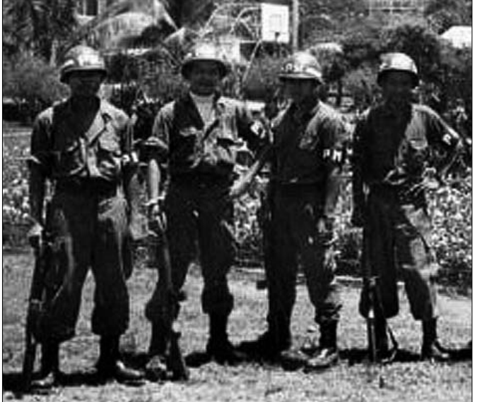
កងអាវុធបត្តិរបស់ លន់ នល់ ក្នុងអំឡុងពេលសមយុទ្ធនៅ ទីក្រុងភ្នំពេញ