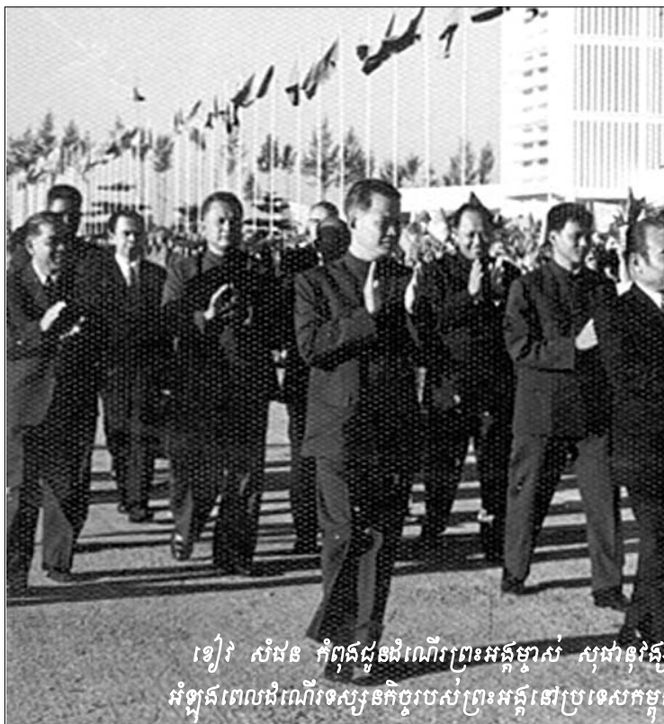
ខៀវ សំផន កំពុងជូនដំណើរព្រះអង្គម្ចាស់ សុដានុវង្ស អំឡុងពេលដំណើរទស្សនកិច្ចរបស់ព្រះអង្គនៅប្រទេសកម្ពុជា