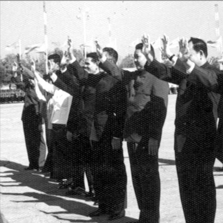
កម្មាភិបាលជំនុំជម្រះសហគ្រាសប្រជាធិបតេយ្យនៅព្រលានយន្តហោះទីក្រុងភ្នំពេញ។ សំផន, ឆន ជា, អៀង សារី, វ៉ន វ៉ែត, សុន សេន, ម៉ី ឃី