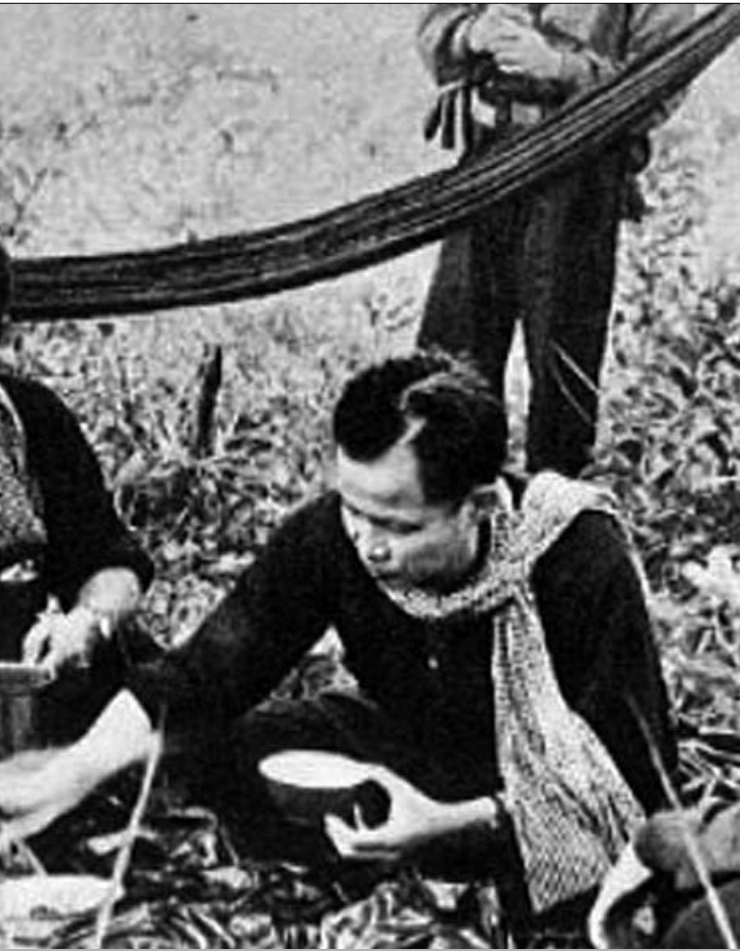
ដោះខ្នែកក្រហម មុនឆ្នាំ១៩៧៥