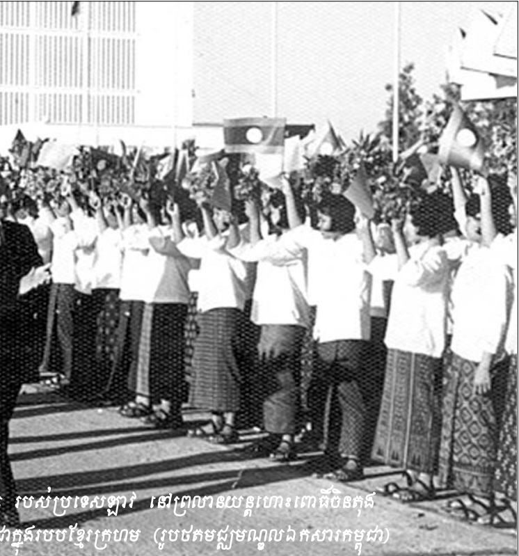
របស់ប្រទេសឡាវ នៅព្រលានយន្តហោះពោធិ៍ចិនក្នុងក្នុងរបបខ្មែរក្រហម

នាំឲ្យសម្តេច សីហនុ លាលែង ព្រះអង្គបញ្ចប់សមាសធាតុរណសិរ្ស ។ នេះជាអ្វីដែលកើតឡើងក្រោយសេចក្តីសម្រេចក្នុងខែឧសភា” ទាក់ទងអំពីភាពជាឯកជន សាក្សីបានបំភ្លឺថា ទម្រង់មួយពាក់ព័ន្ធនឹងទ្រព្យសម្បត្តិឯកជន ជាគំនិតខុសពីគំនិតរបស់អង្គការនិងបដិវត្តន៍ ។ ទ្រព្យសម្បត្តិឯកជនទោះបីជាខាងផ្នែកបញ្ហាស្មារតីក្តី ជាសម្ភារក្តី ជាទំនាស់មួយដ៏ខ្លាំងខ្លា ដែលកើតចេញពីអ្នកនៅខាងក្រៅបដិវត្តន៍ ជាជាន់អ្នកនៅខាងក្នុងបដិវត្ត ។ ដូច្នោះ បញ្ហាទាំងឡាយណា ដែលបង្ហាញឲ្យឃើញពីទស្សនៈទាក់ទងនឹងទ្រព្យសម្បត្តិ