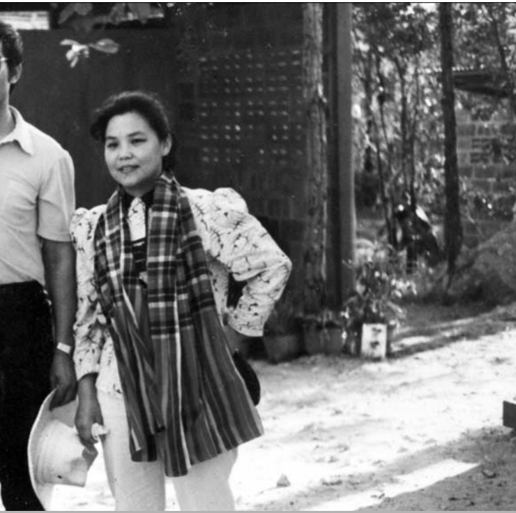
មុនជា-ថៃ នាចុងទសវត្សរ៍៨០ (រូបថតមជ្ឈមណ្ឌលឯកសារកម្ពុជា)

ភូមិភាគបូព៌ាដែលត្រូវបានធ្វើមុនពេល ដាន ដឹកនាំកម្មវិធីរបស់កាត់ទៅភូមិភាគនេះ។ ប៉ុន្តែ ដាន បានបញ្ជាក់ជាច្រើនលើកច្រើនសារថាកាត់ពុំបានដឹងអំពីការបោសសម្អាតនេះឡើយ។