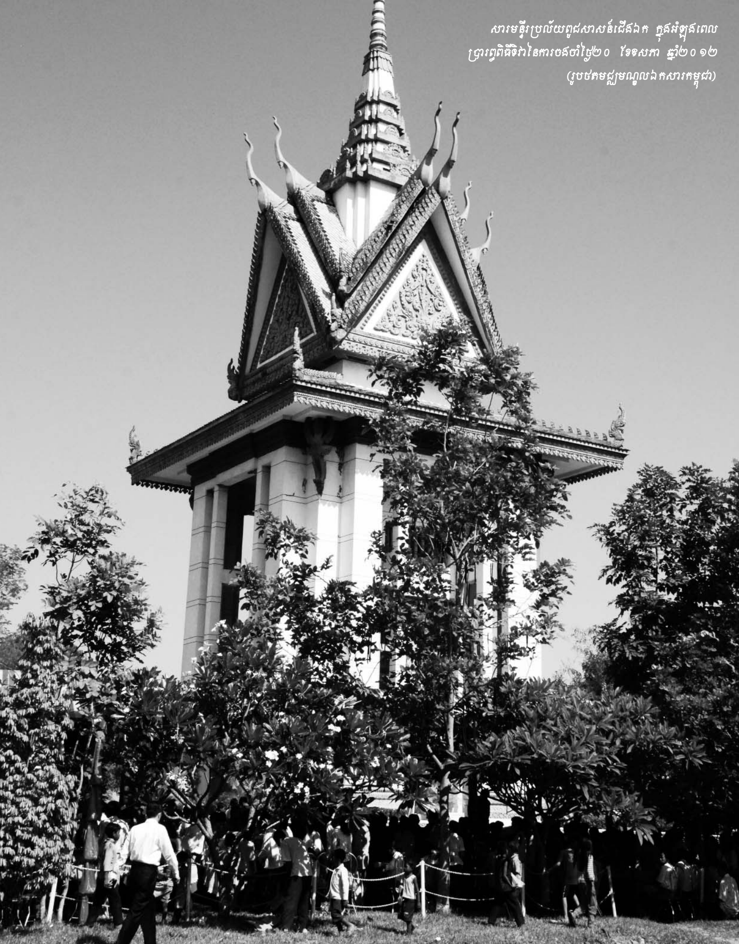
មជ្ឈមណ្ឌលឯកសារ កម្ពុជា រក្សាសិទ្ធិខ្លឹមសារឆ្នាំ២០១៣

សារមន្ទីរប្រល័យពូជសាសន៍ជើងឯក ក្នុងសំឡេងពេល ព្រះព្រហ្មទិវា នៃការចេញថ្ងៃ២០ ខែឧសភា ឆ្នាំ២០១២