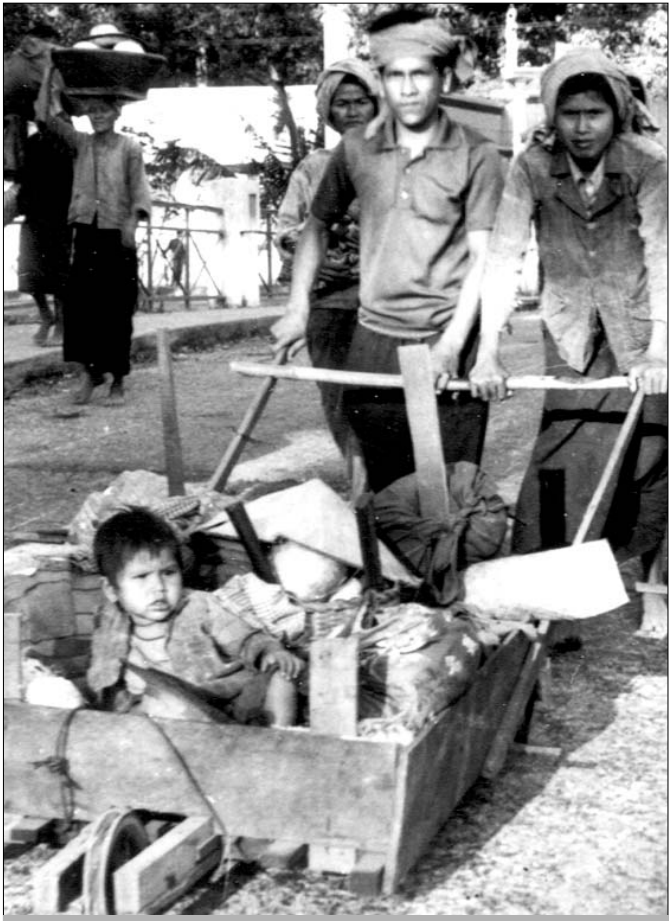
ប្រជាជនកម្ពុជាវិលត្រលប់មកមាតុភូមិកំណើតវិញ ក្រោយរបប ខ្មែរក្រហមរលំរលួញឆ្នាំ១៩៧៩