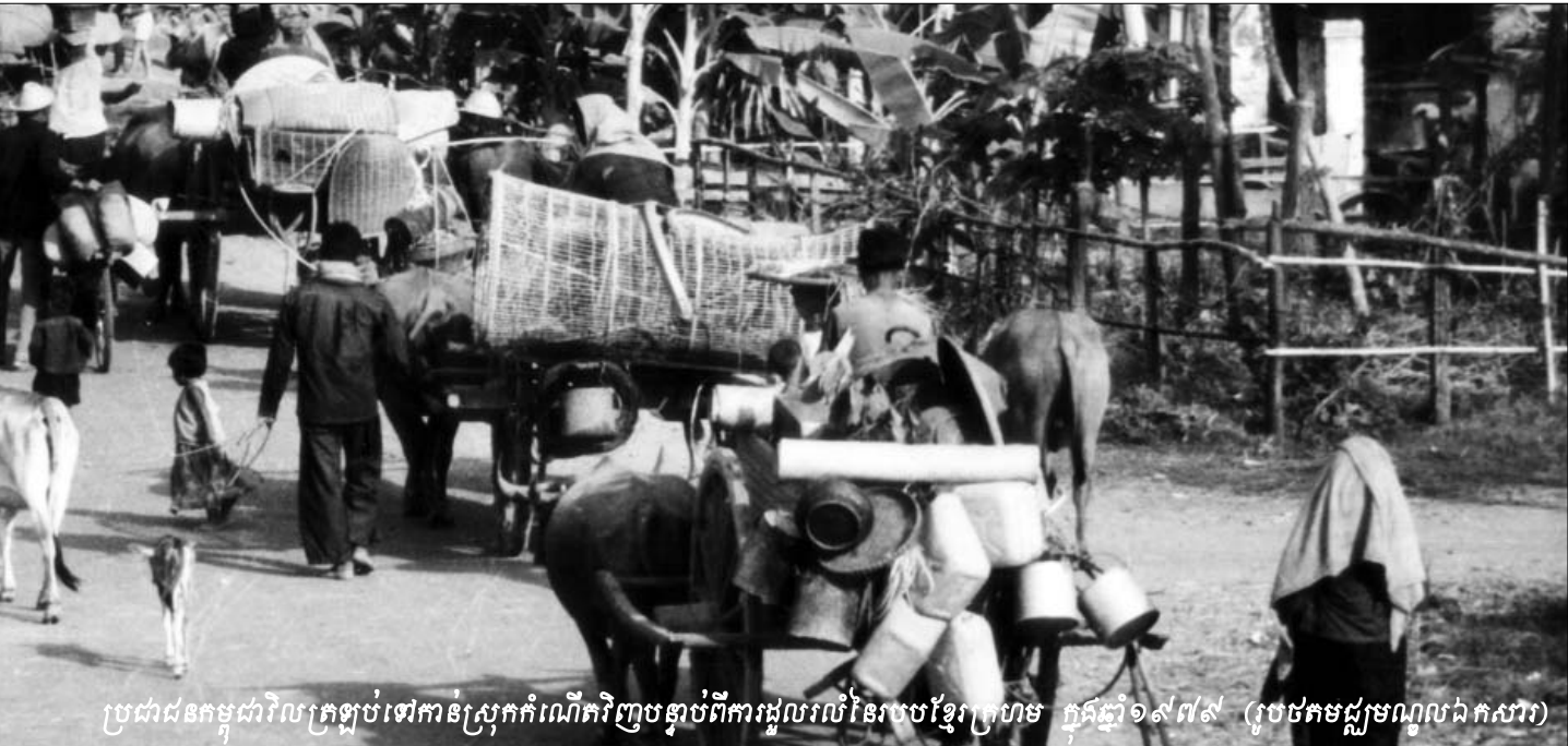
ប្រជាជនកម្ពុជាវិលត្រឡប់ទៅកាន់ស្រែកកំណើតវិញបន្ទាប់ពីការផ្តល់រលីនៃរបបខ្មែរក្រហម ក្នុងឆ្នាំ១៩៧៩ (រូបថតមជ្ឈមណ្ឌលឯកសារ)

រហូតដល់គាត់អស់ជីវិត ហើយរាល់ការចំណាយផ្សេងៗ ដូចជា ប្រាក់បៀវត្សន៍ បាយទឹក ។ល។ សម្រាប់អ្នកការពារទាំងនោះ ជាបន្តបន្ទាប់របស់រដ្ឋ ។ ជាការឆ្លើយតបអង្គជំនុំជម្រះបញ្ជាក់ថា “...សំណើរបស់លោកដែលបានសុំឲ្យអង្គការសហប្រជាជាតិ និង រាជរដ្ឋាភិបាលកម្ពុជាផ្តល់កិច្ចការពារសន្តិសុខសម្រាប់រូបលោក ចាប់ពីពេលនេះ រហូតដល់អស់មួយជីវិតនោះ មិនមានហេតុផល សមស្របទេ ។ អង្គជំនុំជម្រះសូមជម្រាបផងដែរថា អង្គជំនុំជម្រះ គ្មានយុត្តាធិការសម្រេចតាមសំណើរបស់លោកបែបនេះទេ ។ អង្គ ជំនុំជម្រះក៏មិនសម្រេចផ្តល់នូវវិធានការផ្សេងៗទៀតដូចលោក ដែរ ។ ហេតុដូច្នេះ អង្គជំនុំជម្រះសម្រេចបញ្ចប់ការស្តាប់សក្ខីកម្ម របស់លោកត្រឹមនេះ...” ។ គួរបញ្ជាក់ថាមុននឹងចេញសេចក្តី សម្រេចនេះ អង្គជំនុំជម្រះបានសួរ សារិន បញ្ជាក់អំពីភាពត្រឹម ត្រូវនៃប្រតិចារិកដែលមជ្ឈមណ្ឌលឯកសារកម្ពុជាបានចម្លងចេញ ពីខ្សែអាត់ថតសំឡេងដែលបានថតនៅពេលមជ្ឈមណ្ឌលឯកសារ កម្ពុជាធ្វើការសម្ភាសន៍ជាមួយ ស សារិន ។ សារិន បញ្ជាក់ថា ប្រតិចារិកនោះពិតជាត្រឹមត្រូវតាមអ្វីដែលគាត់បានផ្តល់បទ សម្ភាសន៍ដូចមជ្ឈមណ្ឌលឯកសារកម្ពុជា ។ ជាងនេះទៅទៀត គាត់មានជំនឿជាក់ទៅលើការធានារបស់មជ្ឈមណ្ឌលឯកសារ កម្ពុជា ។