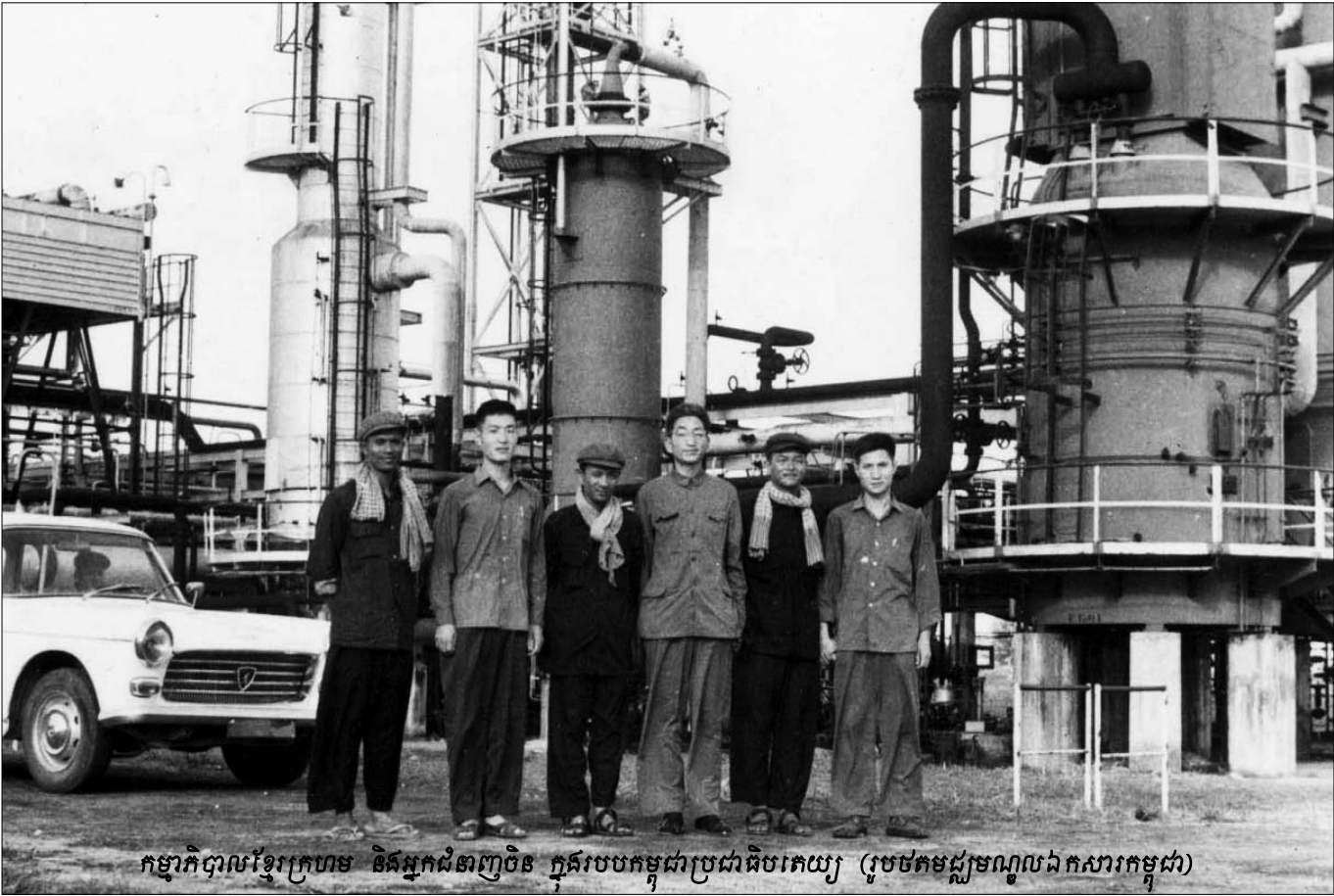
កម្មាភិបាលខ្មែរក្រហម និងអ្នកជំនាញចិន ក្នុងរបបកម្ពុជាប្រជាធិបតេយ្យ

ទីក្រុង ត្រូវបានបោះបង្គោលស្រែ ទៅឆ្នេរព្រៃ ទៅស្ទឹងស្រូវ ទៅច្រក ស្រូវ គេស្គាល់តម្លៃដ៏ពិតប្រាកដនៃអ្វីៗ ដែលគេហូប ។ ជនជាតិ ខ្មែរត្រូវដឹងថា គេកើតមកពីគ្រាប់ស្រូវ ។ “ចិន ជាខ្មាំងសត្រូវ របស់ខ្មែរ ពីព្រោះនេះចូលក្នុងការតស៊ូវិញ្ញាណៈចិនកាន់លុយ” ។ ចំណែកនៅក្នុងនិក្ខេបបទរបស់ ខៀវ សំផន ក៏បានពន្យល់អំពីការ តស៊ូវិញ្ញាណៈដោយមានសរសេរថា “កុំប្រាជ័យ” សំដៅទៅលើចិន ដែលយកផលិតផលរបស់អ្នកស្រែទៅលក់ឲ្យជនជាតិបរទេស ។