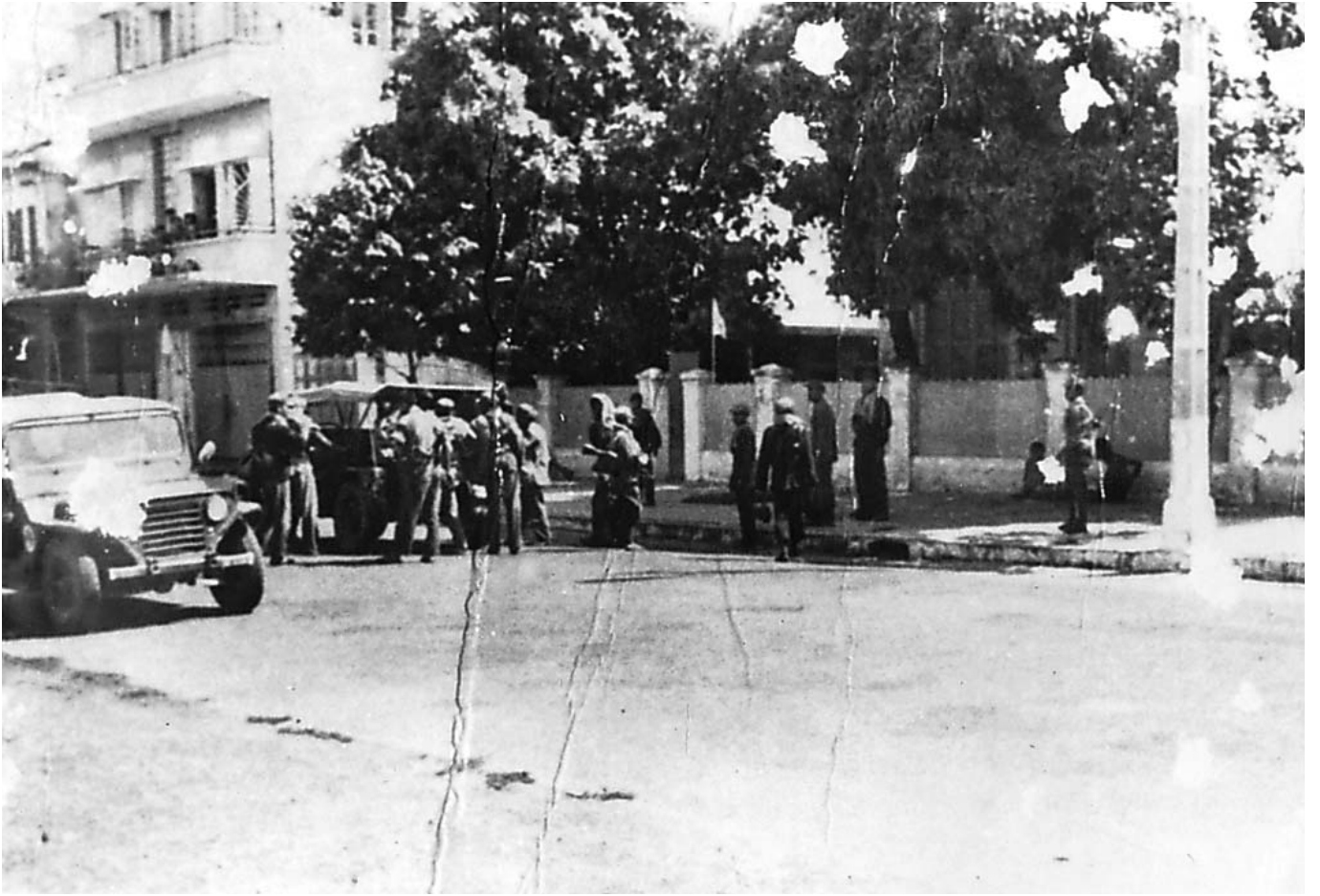
ទិដ្ឋភាពនៃការចូលមកដល់ទីក្រុងភ្នំពេញនៃយោធាខ្មែរក្រហមនៅថ្ងៃទី១៧ ខែមេសា ឆ្នាំ១៩៧៥ ។

ឯកសាររឿងអ្នកមួយទៀត ដើម្បីឲ្យសាក្សីបញ្ជាក់ ។ សាក្សីបាន រៀបរាប់ថា ទិដ្ឋភាពនៅក្នុងខ្សែរឿងអ្នកនោះ គឺបង្ហាញពីសកម្ម ភាពនៅក្នុងស្ថានទូតបារាំង ដែលមានការចរចាគ្នារវាងខ្មែរក្រហម