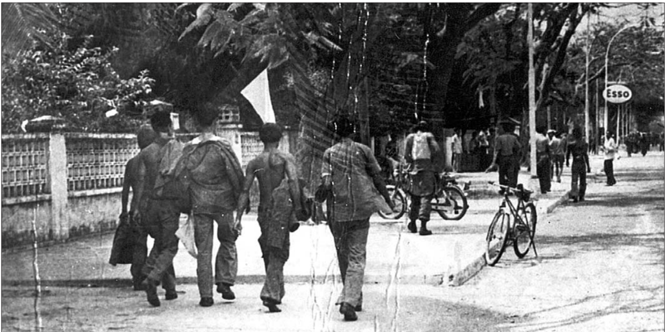
ទិដ្ឋភាពនៃការសុំចុះចាញ់របស់ទាហាន លន់ នល់ នៅពេលដែលយោធាខ្មែរក្រហមចូលដល់ទីក្រុងភ្នំពេញ

ទី១) សវនាការស្តីពីការបន្តបណ្តឹងកសាង ដែលការិយាល័យ