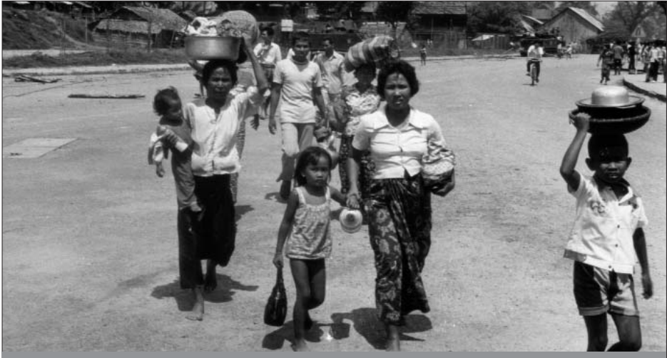
ប្រជាជនចេញពីលំនៅដ្ឋានដើម្បីរកទិសរុក្ខិភាព ពេលយោធាខ្មែរក្រហមផ្លាស់ចូល ដោយទីក្រុងភ្នំពេញ នៅឆ្នាំ១៩៧២ ។

ស្របពេលដែលអង្គជំនុំជម្រះសាលាដំបូងកំពុងរៀបចំចេញ សេចក្តីសម្រេចថ្មីទាក់ទងនឹងវិសាល ភាពនៃសំណុំរឿង០០២ អង្គជំនុំជម្រះវិសាមញ្ញក្នុងតុលាការកម្ពុជាបានប្រកាសថា នៅថ្ងៃទី ១៤ ខែមីនា ឆ្នាំ២០១៣ ជនជាប់ចោទ អៀង សារី បានទទួល មរណភាពនៅវេលាព្រឹកថ្ងៃទី១៤ ខែមីនា ឆ្នាំ២០១៣ មេរ័យ៨ និង៤៥ នាទី នៅមន្ទីរពេទ្យមិត្តភាពកម្ពុជា-សូវៀត ក្នុងអាយុ ៨៧ឆ្នាំ ដោយជំងឺស្ទះសរសៃឈាមបេះដូង ។ ការស្លាប់របស់ អៀង សារី នាពេលនេះ បានធ្វើឲ្យបទចោទប្រកាន់ទាំងអស់ប្រឆាំង នឹងជនជាប់ចោទ អៀង សារី ត្រូវបញ្ចប់ ។ ការស្លាប់របស់ អៀង សារី និងបញ្ហាសុខភាពរបស់ជនជាប់ចោទ នួន ជា រួមជាមួយនឹងការធ្វើពហិការព្រមចូលបំពេញការងារ ដោយបុគ្គលិកជាតិ ខាងផ្នែកបកប្រែភាសានៅសាលាក្តីខ្មែរក្រហម