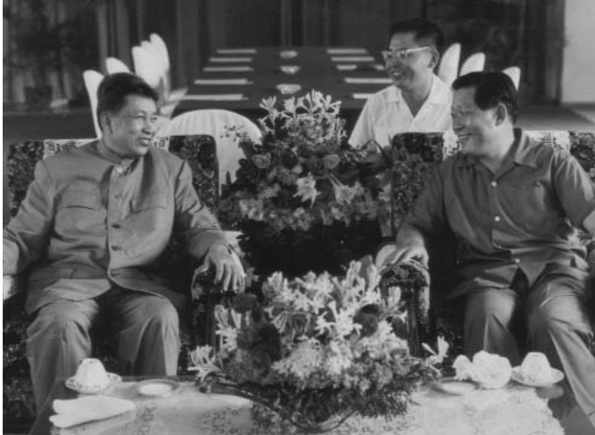
ប៉ុល ពត ពាក់ព័ន្ធជួបពិភាក្សាជាមួយលោក សុន ហួរ ឯកអគ្គរដ្ឋទូតចិនប្រចាំកម្ពុជាប្រជាធិបតេយ្យ

សហព្រះរាជអាជ្ញារង ក៏បានដាក់ឯកសារទាក់ទងនឹងសិទ្ធិកម្ទេចនៅក្នុង និងក្រៅរដ្ឋ ដែលមានបែងចែកពីអំណាចរបស់មជ្ឈិម និងអចិន្ត្រៃយ៍នៅក្នុងការសម្រេចថា “សិទ្ធិកម្ទេចនៅក្នុងនិងក្រៅរដ្ឋ មានលក្ខខណ្ឌ ដាច់ខាតក្នុងការអនុវត្តបង្វិរត្រូវរបស់យើង គឺត្រូវពង្រឹងប្រជាធិបតេយ្យសន្តិសុខនិយម និងពង្រឹងអំណាចរដ្ឋរបស់យើង ។ ប្រសិនបើនៅមូលដ្ឋានត្រូវសម្រេចដោយគណៈក្រុមភាគជុំវិញមន្ទីរ ត្រូវសម្រេចដោយមជ្ឈិម តំបន់ឯករាជ្យត្រូវសម្រេចដោយអចិន្ត្រៃយ៍ ហើយកងទ័ពមជ្ឈិម ត្រូវ