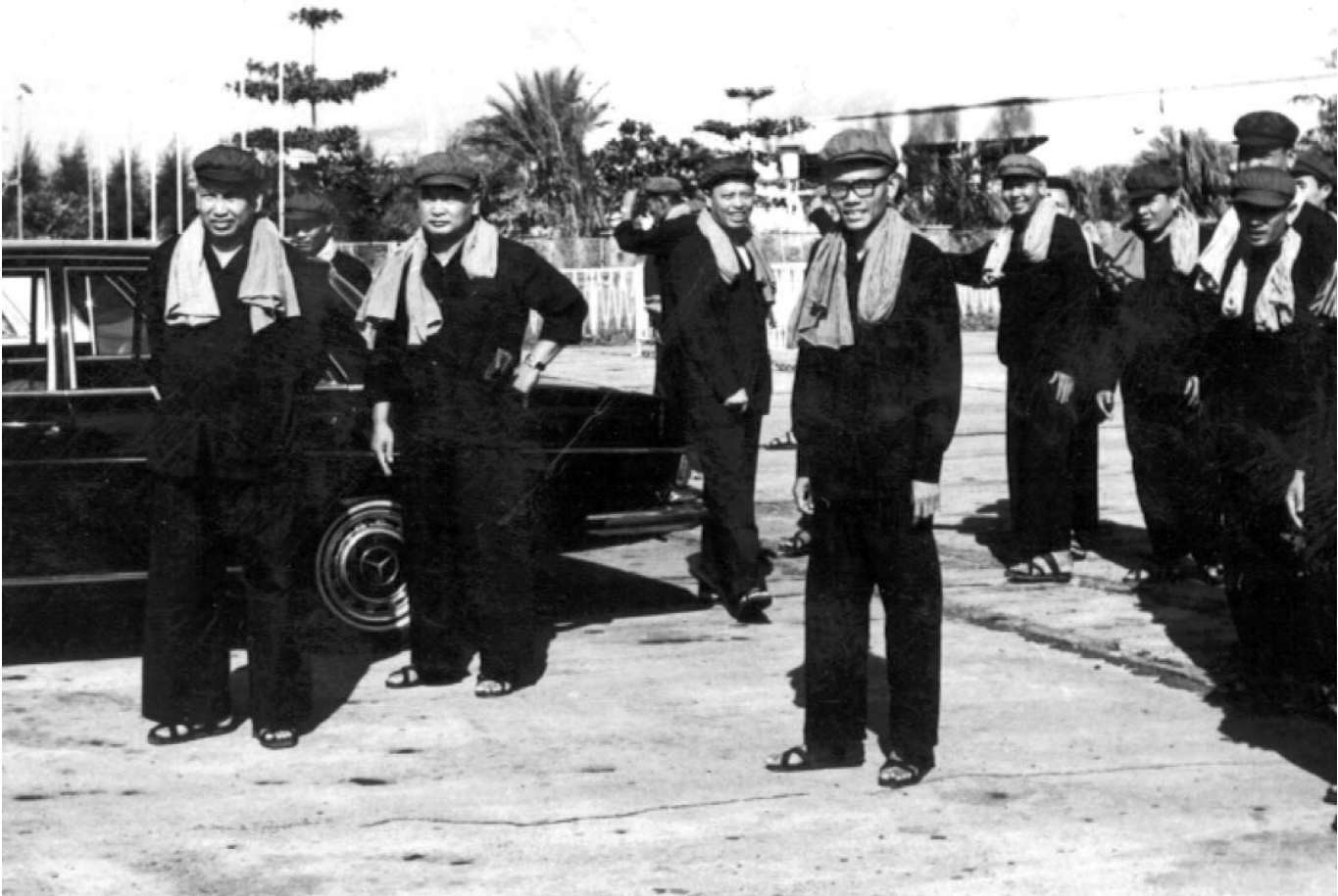
មេដឹកនាំកម្ពុជាប្រជាធិបតេយ្យ និងជាសមាជិកគណៈអចិន្ត្រៃយ៍នៃគណៈកម្មាធិការមជ្ឈិមបក្សកុម្មុយនីស្តកម្ពុជា (ពីឆ្វេងទៅស្តាំរួមមាន : ប៉ុល ពត (លេខាបក្សកុម្មុយនីស្តកម្ពុជា និងជាប្រធានក្រុមប្រឹក្សាប្រជាធិបតេយ្យ) , នួន ជា (អនុលេខាបក្សកុម្មុយនីស្តកម្ពុជា និង ជាប្រធានសភាតំណាងប្រជាជនកម្ពុជា) , អៀង សារី (ទបនាយករដ្ឋមន្ត្រីទទួលបន្ទុកកិច្ចការបរទេស) , សុន សេន (ទបនាយករដ្ឋមន្ត្រីទទួល បន្ទុកការពារជាតិ) , វ៉ន រ៉េត (ទបនាយករដ្ឋមន្ត្រីទទួលបន្ទុកផ្នែកសេដ្ឋកិច្ច))

ចំពោះផែនការសម្រាប់ការជំនុំជម្រះនៅថ្ងៃខែឆ្នាំខុស ក្រោយ ពេលបំបែកកិច្ចដំណើរការនីតិវិធីសារជាថ្មី អង្គជំនុំជម្រះសាលា ដំបូងបានបញ្ជាក់ថា ខ្លួនបានរៀបចំផែនការព្រាងរួចជាស្រេច ហើយ បន្ទាប់មក នឹងបើកកិច្ចប្រជុំរៀបចំផែនការសវនាការនៅ ក្នុងត្រីមាសទី៤ នៅក្នុងឆ្នាំ២០១៣ ក្រោយពេលមានសេចក្តី សន្និដ្ឋានបញ្ចប់កិច្ចពិភាក្សាដេញដោលនៅក្នុងសំណុំរឿង០០២/ ០១ ដើម្បីទុកឱកាសពិភាក្សាអំពីជំហានបន្ទាប់ ។