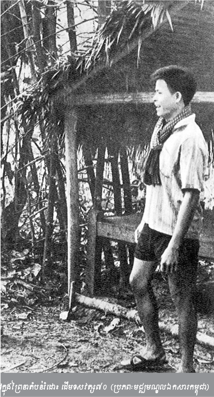
ក្នុងព្រៃតាតំបន់រំដោះ ដើមទសវត្ស៧០

កាត់ការស៊ើបអង្កេតរបស់សហចៅក្រមស៊ើបអង្កេតឡើយ ។ ដូច្នោះ ខ្លួនទាមទារឲ្យមានការកោះហៅអ្នកនិពន្ធអត្តបទទាំងនោះមក ផ្តល់សក្ខីកម្មនៅចំពោះមុខអង្គជំនុំជម្រះ ។ ម្យ៉ាងទៀត ឯកសារ ទាំងនោះត្រូវបានដាក់នៅក្នុងសំណុំរឿងដោយក្រុមមេធាវីខ្លួនឯង