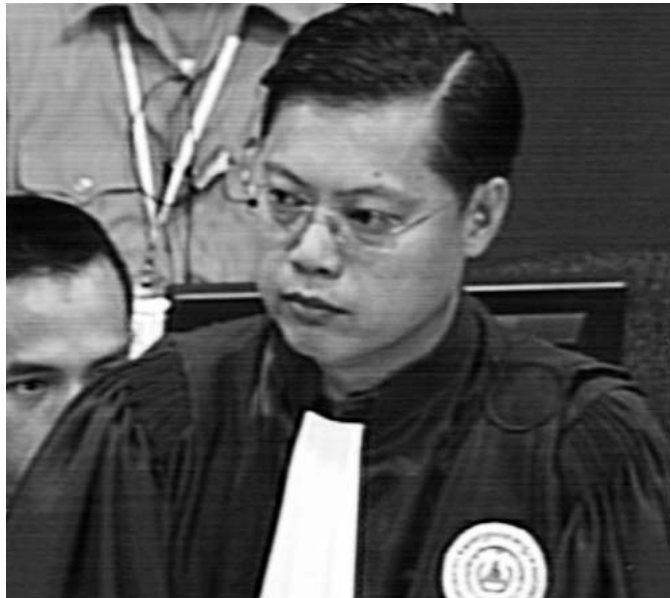
តំណាងសហព្រះរាជអាជ្ញាជាតិ សេង ប៊ុនយាន

សាក្សីបានជួបជាមួយអ្នកស៊ើបអង្កេត មុនពេលមានការធ្វើ សម្ភាសន៍ដែលមានការថតជាខ្សែអាត់សម្លេង មានការពិភាក្សា គ្នាអំពីបញ្ហាអ្វីខ្លះ? ហើយមាននិយាយអំពីបញ្ហាដែលបានកើត ឡើងនៅក្នុងរបបកម្ពុជាប្រជាធិបតេយ្យដែរឬទេ? ឆ្លើយតប នឹងសំណួរទាំងនេះ សាក្សីបានបញ្ជាក់ថា លោកពិតជាបានជួប