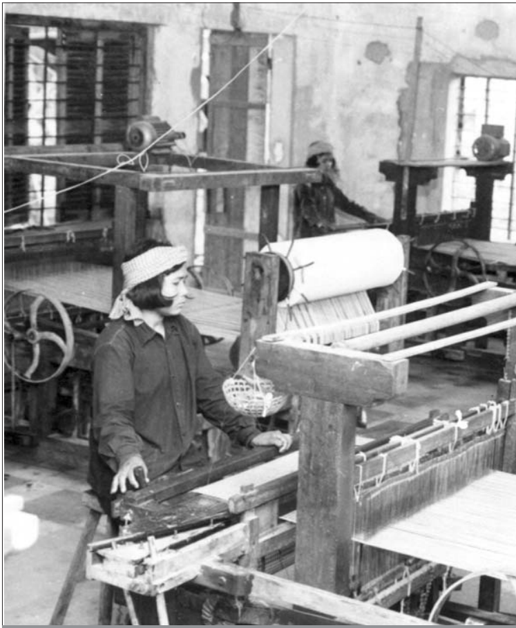
កងទ័ពកម្រិតស្នាមស្រូវក្នុងរបបកម្ពុជាប្រជាធិបតេយ្យ

ត្រីនជើង ដោយសារតែពាក់ស្បែកជើងអាមេរិក ។ បូនី ត្រូវបាន យោធាខ្មែរក្រហមបញ្ជាឲ្យបោះកាបូប ដែលមានពណ៌ដូចជាពណ៌ ដែលទាហានប្រើប្រាស់ ។ យោធាខ្មែរក្រហមបានប្រើល្បិច ប្រកាសឲ្យអ្នកធ្វើទាហាននៅក្នុងរបប លន់ នល់ ចូលមកភ្នំពេញ វិញ ។ ដូច្នេះបងប្រុសរបស់ខ្លួនបានត្រឡប់ទៅភ្នំពេញវិញ ហើយ