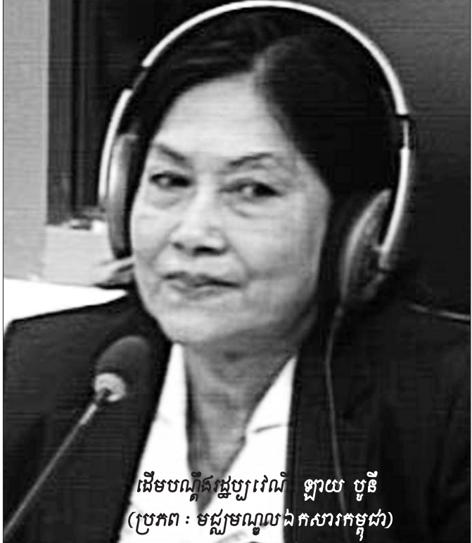
ដើមបណ្តឹងរដ្ឋប្បវេណី ឡាយ បូនី

នៅមុនថ្ងៃទី១៧ ខែមេសា ឆ្នាំ១៩៧៥ ទីក្រុងភ្នំពេញមានភាពច្របូកច្របល់ពីព្រោះមានគ្រាប់កាំភ្លើងផ្ទៀងផ្ទាត់ចូលទីក្រុងភ្នំពេញ ។ ដោយសារស្ថានភាពប្រទេសជាតិមានសភាពរីករវៃបែប