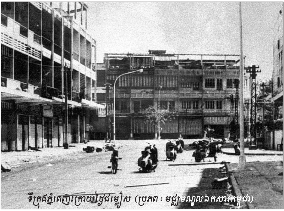
ទីក្រុងភ្នំពេញក្រោយថ្ងៃជម្លៀស

ដូចជាបានអនុវត្តកន្លងមកហើយ ក្នុងការសួរដេញដោល ដើមបណ្ឌិតវង្សរវេណី គឺត្រូវបានប្រព្រឹត្តទៅតាមលំដាប់ ដោយ ចាប់ពីក្រុមមេធាវីដើមបណ្ឌិតវង្សរវេណី តំណាងសហព្រះរាជ អាជ្ញា និងក្រុមមេធាវីការពារក្តីជនជាប់ចោទទាំងបីក្រុម ។ ចំណែក ការសួរដេញដោលសាក្សីវិញ គឺចាប់ផ្តើមពីតំណាងសហព្រះរាជ អាជ្ញា មេធាវីតំណាងដើមបណ្ឌិតវង្សរវេណី និងក្រុមមេធាវី ការពារក្តីជនជាប់ចោទ ។ សម្រាប់ដើមបណ្ឌិតវង្សរវេណី និង សាក្សីទាំង៧រូបដូច បានរៀបខ្លាំងលើ ភាគច្រើនព័ត៌មានត្រូវបានក្រុមមេធាវីការពារក្តី ចោទសំណួរឡើយ ។ សវនាការទាំងនេះ បានប្រព្រឹត្តទៅដោយរលូន ដោយមានការ ចូលរួមតាមដានដោយដ្ឋាល់ពីសំណាក់ ប្រជាជនកម្ពុជាប្រមាណ៣៧៨០ នាក់មក ពីបណ្តាខេត្តនានា ដូចជា ខេត្តកំពង់ចាម ខេត្តកំពង់ធំ ខេត្តកណ្តាល ខេត្តតាកែវ ខេត្តកំពង់ស្ពឺ ខេត្តព្រៃវែង តាមការស្នើ អញ្ជើញរបស់មន្ត្រីនៃអង្គភាពផ្នែកកិច្ចការ សាធារណៈ របស់សាលាក្តី កាត់ទោស មេដឹកនាំខ្មែរក្រហម ។