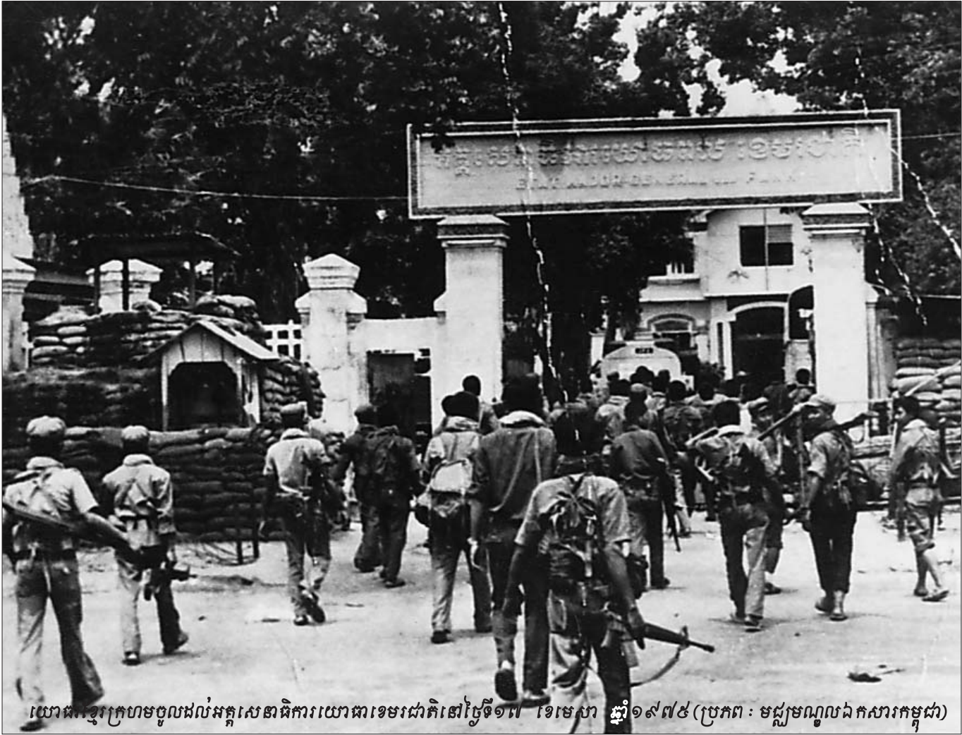
យោធិក្រហមចូលដល់អគ្គសេនាធិការយោធាទេមរជាតិនៅថ្ងៃទី១៧ ខែមេសា ឆ្នាំ១៩៧៥

ស្លាប់ជាច្រើននៅតាមជួរមុខ ដែលនេះគឺជារឿងដែលមិនអាច ជឿស្រួច ទោះបីជាប្រុងប្រយ័ត្នយ៉ាងណាក៏ដោយ ។ ឆ្លើយតប នឹងសំណួរទាក់ទងនឹងការនៃកងរដ្ឋប្រដាប់ទ័ពនៅក្រោយពេល ខ្មែរក្រហមទទួលបានជ័យជម្នះ សាក្សីបានបញ្ជាក់ថា នៅក្រៅដែល ទើបនឹងទទួលបានជ័យជម្នះភ្លាមៗ មិនទាន់មានការបែងចែកក្រុម