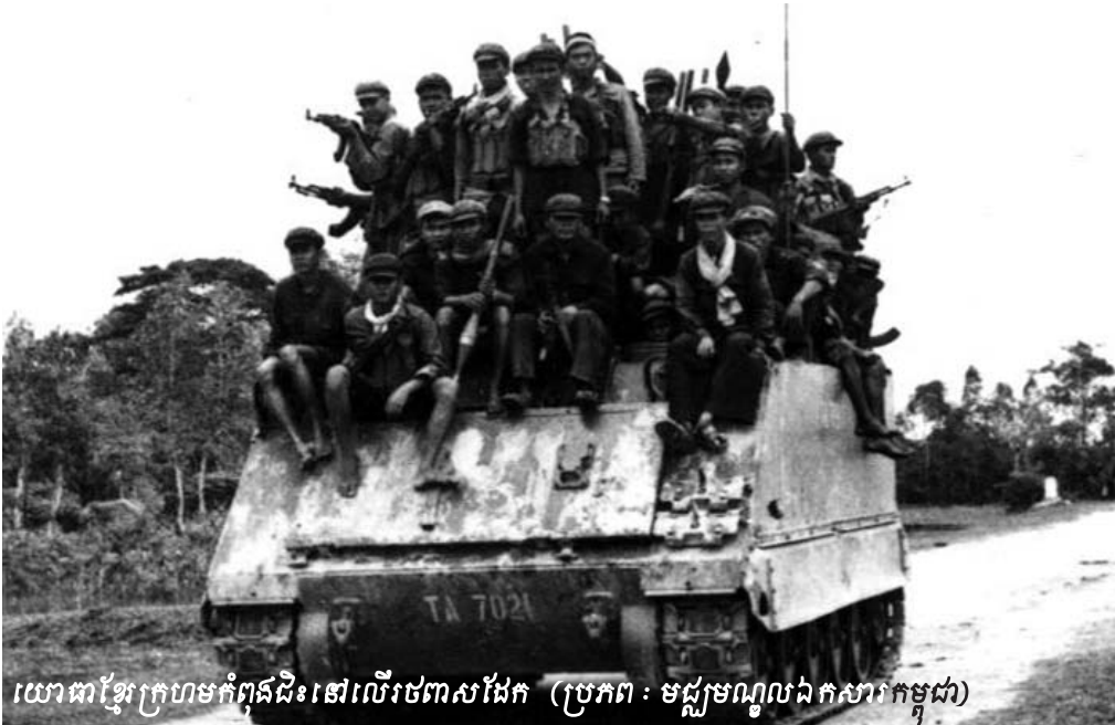
យោធាខ្មែរក្រហមកំពុងដឹកនៅលើរថពាសដែក

ជីពសៃ បានបញ្ជាក់បន្ថែមថា បន្ទាប់ពីកម្មាភិបាលខ្មែរ ក្រហមមកនិរតិចូលគ្រប់គ្រងស្រុកជីក្រែង កម្មាភិបាលខ្មែរក្រហម បម្រើការមុនៗគឺត្រូវបានចាប់ខ្លួន ។ ក្រោយមកទៀតចាប់ខ្លួន ប្រជាជន១៧ មេសា យកទៅសម្លាប់ចោលនៅភ្នំកំពង់ក្តី ដោយ