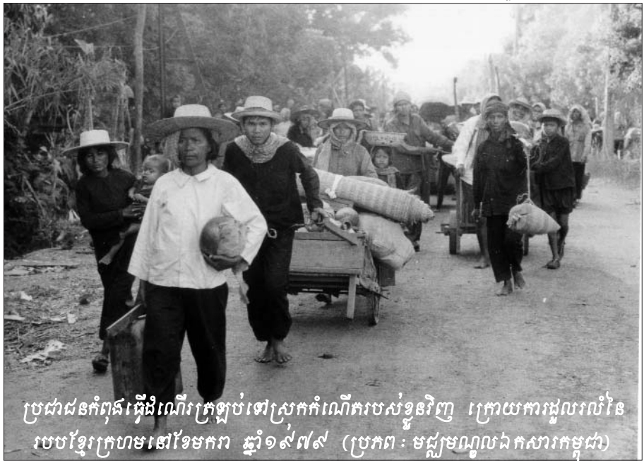
ប្រជាជនកំពុងធ្វើដំណើរក្រឡប់ទៅស្រុកកំណើតរបស់ខ្លួនវិញ ក្រោយការរដ្ឋលាវល់នៃ របបខ្មែរក្រហមនៅខែមករា ឆ្នាំ១៩៧៩

បន្ទាប់មក មេធាវីបានបន្តសំណួរថា តើសាក្សីបានស្គាល់ នួន ជា តាមរបៀបណា? សាក្សីបានបញ្ជាក់ថា ខ្លួនទើបតែដឹងនៅ ពេលមើលទូរទស្សន៍ម្តងៗ គឺមិនមែននៅក្នុងពេលដែល នួន ជា កាន់ អំណាចនោះទេ ហើយខ្លួនក៏មិនបានយកបញ្ហាគួរនាំរបស់ នួន ជា ទៅដដែកជាមួយបុគ្គលផ្សេង ឬសមាជិកគ្រួសារផ្សេងទៀត ដែរ ។ សាក្សីបានបន្តថា ពេលខ្លួនធ្វើការនៅ២១កីឡូនោះ ខ្លួនបាន ពិនិត្យមើលការងារជួសជុលជារៀងរាល់ថ្ងៃដោយធ្វើដំណើរតាម ណូវី ។ បន្ទាប់មក មេធាវីបានបន្តសំណួរទាក់ទងនឹងសិទ្ធិអំណាច របស់ តាម៉ូម ហើយសាក្សីបានបញ្ជាក់ថា ខ្លួនមិនបានដឹងអំពី