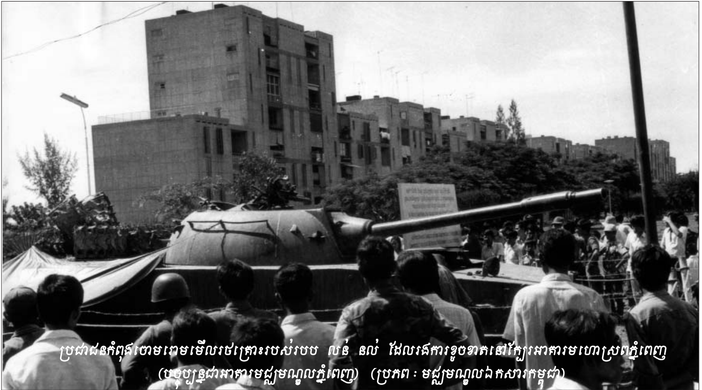
ប្រជាជនកំពុងចោមរោមមើលរថគ្រោះរបស់របប លន់ នល់ ដែលរត់ការខូចខាតនៅក្បែរអាការមហោស្រពភ្នំពេញ (បច្ចុប្បន្នជាអាការមជ្ឈមណ្ឌលភ្នំពេញ)

បន្ទាប់ពីបញ្ចប់ការសាកសួររបស់ដើមបណ្ឌិតរដ្ឋប្បវេណី ប្រធានអង្គជំនុំជម្រះបានប្រកាសជូនដំណឹងអំពីការកែប្រែការជំនុំ ជម្រះ ខណៈពេលដែលអង្គជំនុំជម្រះមានការខ្វះខាតថវិការ ដោយ សារអង្គការសហប្រជាជាតិមានការកាត់បន្ថយបុគ្គលិកអន្តរជាតិ ដូច្នោះអង្គជំនុំជម្រះមិនអាចបន្តបើកសវនាការរយៈពេលបួនថ្ងៃ ក្នុងមួយសប្តាហ៍បាននោះទេ គឺត្រូវកាត់បន្ថយមកជាថ្ងៃក្នុងមួយ