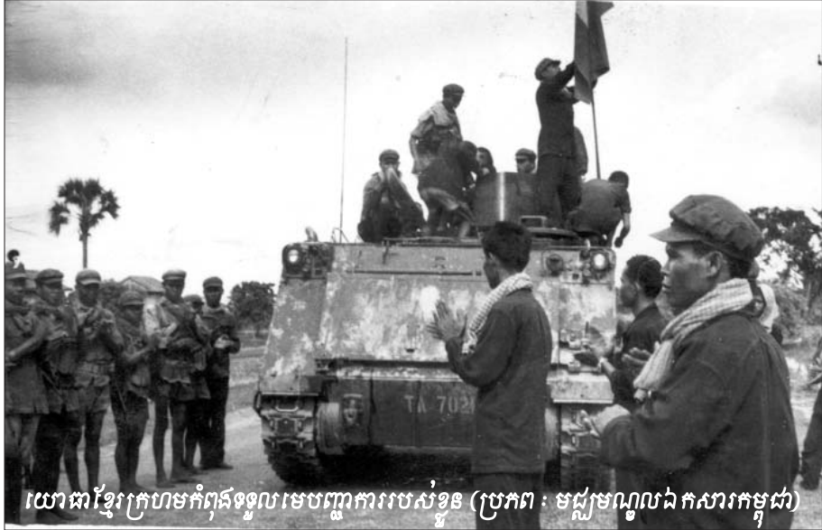
យោធាខ្មែរក្រហមកំពុងទទួលមេបញ្ជាការរបស់ខ្លួន

ពាក់ព័ន្ធនឹងការជម្លៀសប្រជាជនដោយបង្ខំ លោកស្រីមេធាវី បានចោទសួរដើមបណ្តឹងរដ្ឋប្បវេណីថា តើយោធាខ្មែរក្រហម មានបញ្ហាអ្វីចំពោះការជម្លៀសអ្នកស្រីដែរឬទេ នៅពេលបដិសេធមិនព្រមចេញតាមការបញ្ជា? យឹម សុវណ្ណ បានបញ្ជាក់ថា នៅពេលឪពុករបស់អ្នកស្រីស្នើសុំយោធាខ្មែរ ក្រហមស្នាក់នៅដោយមិនព្រមចាកចេញ យោធាខ្មែរក្រហមបាន ឆ្លើយតបថា បើមិនព្រមចាកចេញគេនឹងបាញ់សម្លាប់ចោលតែ ម្តង ដោយសារអ្នកដែលមិនព្រមចាកចេញត្រូវបានចាត់ទុកថាជា ខ្មាំង។ បន្ទាប់មក មេធាវី អេលីហ្សាប៊ែត បានចោទសួរបន្តទាក់ទង នឹងរយៈពេលនៃការជម្លៀស ថាតើអ្នកស្រីត្រូវចំណាយពេល ប៉ុន្មានថ្ងៃទើបទៅដល់គោលដៅ? ឆ្លើយតបនឹងសំណួរនេះ យឹម សុវណ្ណ បានអះអាងថា អ្នកស្រីត្រូវចំណាយពេលជិត១ខែទើប