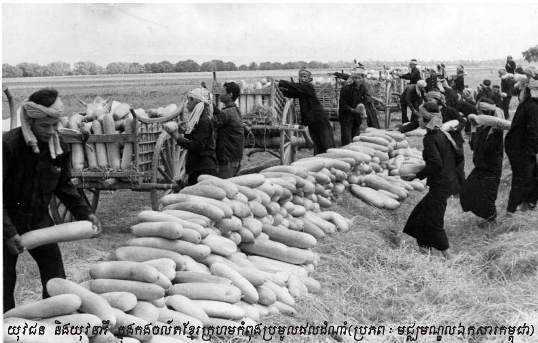
យុវជន និងយុវនារី ក្នុងកងចល័តខ្មែរក្រហមកំពុងប្រមូលផលដំណាំ

បន្ទាប់ពីភាគីបានបញ្ចប់ការសួរដេញដោល អង្គជំនុំជម្រះ បានផ្តល់ឱកាសជូនដើមបណ្តឹងរដ្ឋប្បវេណី ជុំ សុខា ឡើងថ្លែងអំពី ការទទួលរងគ្រោះ និងទុក្ខសោក ដោយសាររបបកម្ពុជាប្រជាធិប តេយ្យ ។ ជុំ សុខា បានចំណាយប្រហែល២៥នាទី ដើម្បីថ្លែង