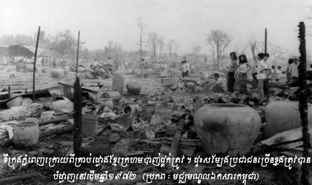
ទីក្រុងភ្នំពេញក្រោយពីគ្រាប់ផ្កាភ្លៀងខ្មែរក្រហមបាញ់ផ្ទះក្រៅ ។ ដុះសម្បែងប្រជាជនច្រើនខ្លួនត្រូវបានបំផ្លាញនៅដើមឆ្នាំ១៩៧២

ដូចគ្នាបានអនុវត្តរួចមកហើយ ក្នុងការសួរដេញដោលដើមបណ្តឹងរដ្ឋប្បវេណី ប្រធានអង្គជំនុំជម្រះផ្តល់ឱកាសឲ្យមេធាវីតំណាងដើមបណ្តឹងរដ្ឋប្បវេណីចោទសំណួរទៅកាន់កូនក្តីរបស់ខ្លួនមុនគេ បន្ទាប់មកទើបតំណាងសហព្រះរាជអាជ្ញា និងមេធាវី