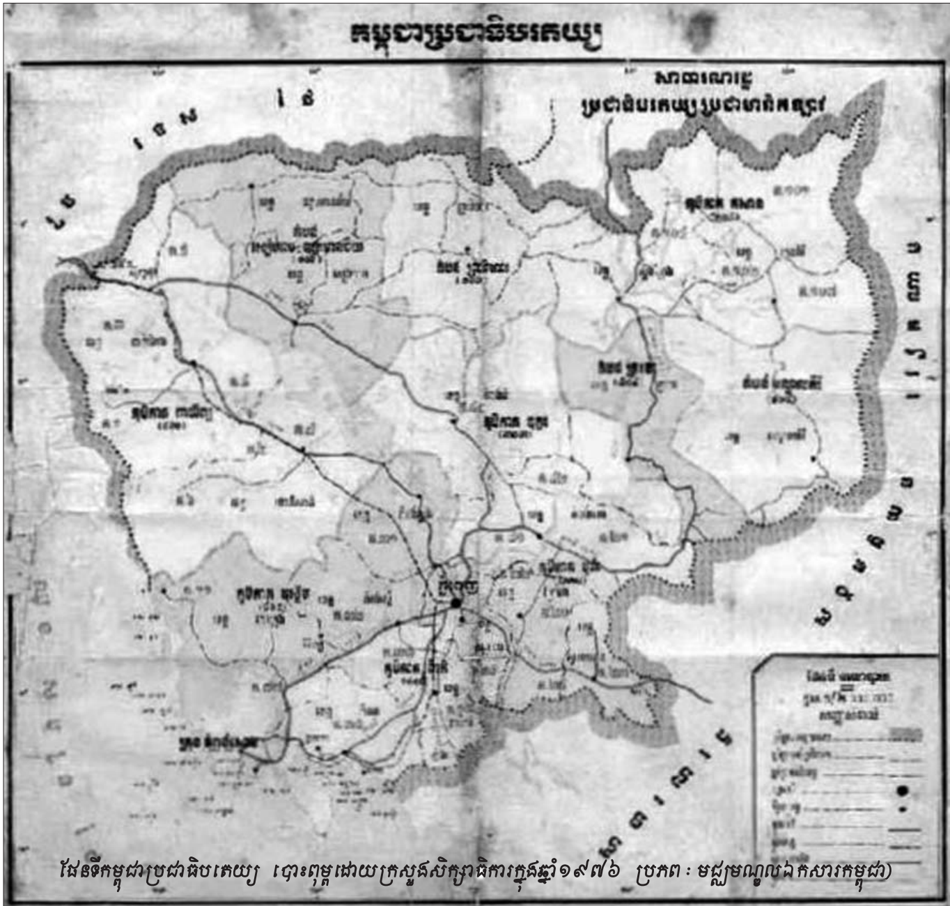
ផែនទីកម្ពុជាប្រជាធិបតេយ្យ បោះពុម្ពដោយក្រសួងសិក្សាធិការក្នុងឆ្នាំ១៩៧៦

ទាក់ទងនឹងខ្លាំងរបស់របបកម្ពុជាប្រជាធិបតេយ្យ ។ បន្ទាប់មក លោកតំណាងសហព្រះរាជអាជ្ញាបានបន្តធ្វើការ បង្ហាញអំពីឯកសារដែលបក្សកុម្មុយនីស្តកម្ពុជាបានបញ្ជូនផ្សព្វ ផ្សាយអំពីការណែនាំសារចរ និងមាគ៌ារបស់ខ្លួន ។ ឯកសារ