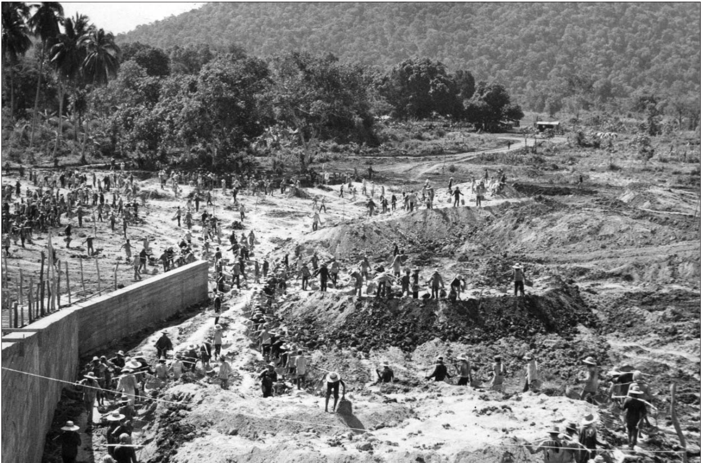
ទិដ្ឋភាពប្រជាជនកំពុងធ្វើការនៅក្នុងការដ្ឋានក្នុងអំឡុងពេលនៃរបបខ្មែរក្រហម

គឺជាលេខាស្រុក ។ ប្រធានមន្ទីរសន្តិសុខពង្រដំបូងគឺ តារីន្ត ក្រោយ មក តាកន់ (បន្ទាប់ពី តារីន្ត ត្រូវបាន តាសុខ ចោទថា ក្បត់) ។ ក្នុងអំឡុងពេលបំពេញតួនាទី តារីន្ត និង តាកន់ បានរាយការណ៍ ជាប្រចាំទៅគណៈស្រុកអំពីស្ថានភាពអ្នកទោសនៅមន្ទីរសន្តិសុខ នេះ ។ ជីពសៃ បញ្ជាក់បន្ថែមថា ក្នុងការចាប់ខ្លួនអ្នកទោសនៅ តាមមូលដ្ឋានណាមួយ គឺត្រូវបានធ្វើបន្ទាប់ពីមានការរាយការណ៍ ពីមេឃុំនៅតាមមូលដ្ឋានទាំងនោះ ។ ក្នុងនាមជាអ្នកកាន់កាប់បញ្ជី