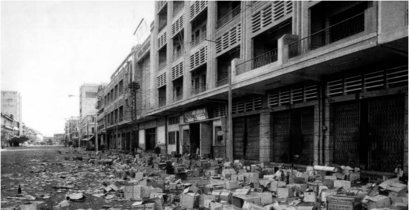
ទិដ្ឋភាពទីក្រុងភ្នំពេញឆ្នាំ១៩៧៧ ក្រោយការចូលមកដល់នៃកងទ័ពវៀតណាម

បន្ទាប់ពីបញ្ចប់ការសួរដេញដោលរបស់មេធាវីការពារក្តី ឆួន ជា មេធាវី ម៉ៃឃើល កាណាវ៉ាស បានចាប់ផ្តើមសួរសាក្សីទាក់ទងនឹងសហចៅក្រមស៊ើបអង្កេតដែលសាក្សីបានផ្តល់បទសម្ភាសន៍ខ្លួន។ សាក្សីបានបញ្ជាក់ថា សហចៅក្រមដែលមកសម្ភាសន៍ខ្លួនទាំងពីរលើក គឺសុទ្ធតែជាមនុស្សផ្សេងគ្នាទាំងអស់។ មេធាវីបានបន្តសួរទាក់ទងនឹងនីតិវិធីក្នុងការសម្ភាសន៍។ សាក្សីបានបញ្ជាក់ថា ការសម្ភាសន៍លើកទី១ គឺមានការផ្តល់ឯកសារជូនមកខ្លួន និងមានថតសម្លេងក្នុងរយៈពេលកន្លះម៉ោង។ ចំណែក