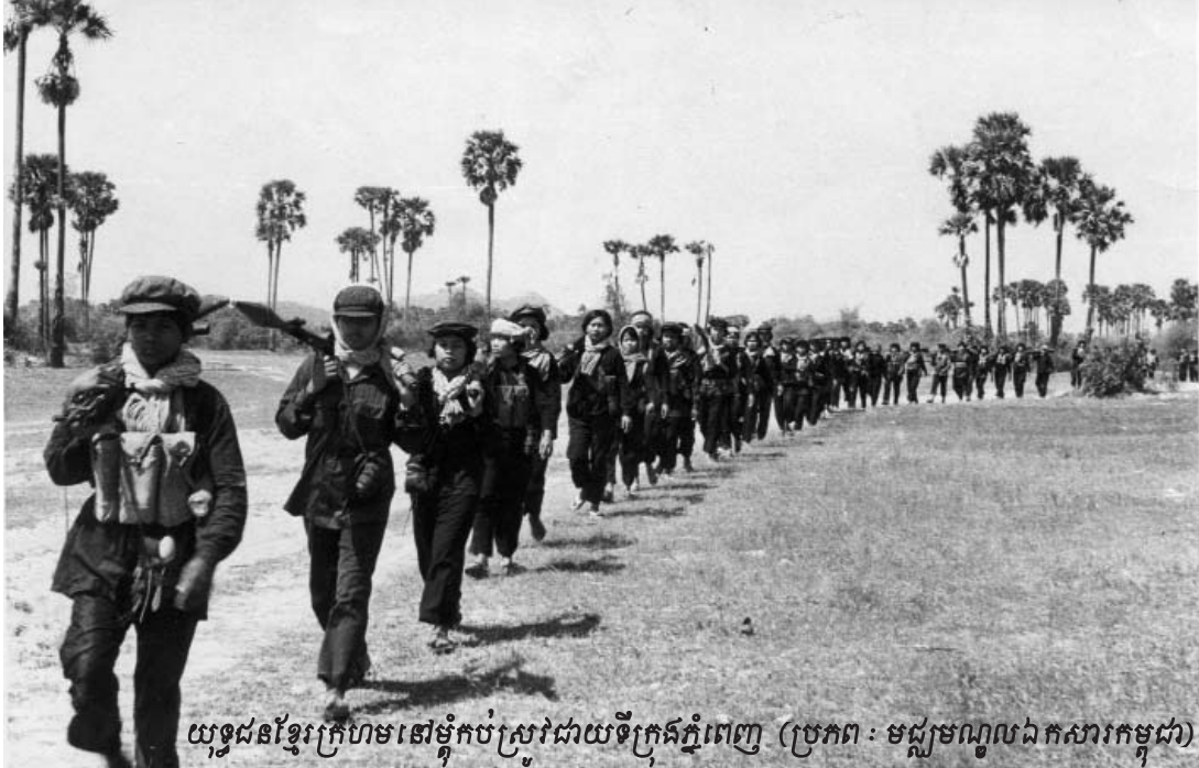
យុទ្ធជនខ្មែរក្រហមនៅម្តុំកប់ស្រូវជាយូរក្នុងភ្នំពេញ

វាយចូលទៅដល់ជិតប្រកបចូលរួចទៅហើយ ។ ភ្នំពេញជាកន្លែងដែលជនក្រីកៗលាក់ខ្លួន ហើយជាសមរម្យមិយ៉ាងក្តៅកក និងមានការរត់ស៊ូមួយយ៉ាងខ្លាំង ពីកងរំដោះប្រជាជនកម្ពុជារបស់យើង ។ នៅថ្ងៃទី១៨ ខែមីនា កងកម្មវិនិច្ឆ័យរួមជាតិរបស់យើងបានរំដោះទុក្ខដី ដោយធ្វើការកម្ទេចទាហានសាធារណរដ្ឋនៅទីនោះ ។ បានន័យថាគឺខ្លាំងជាង៥០០០ នាក់ត្រូវបានបង្ខំចប់ផ្លាញ ហើយយើងចាប់បាន១៥០០ នាក់” ។ ឆ្លើយតបនឹង