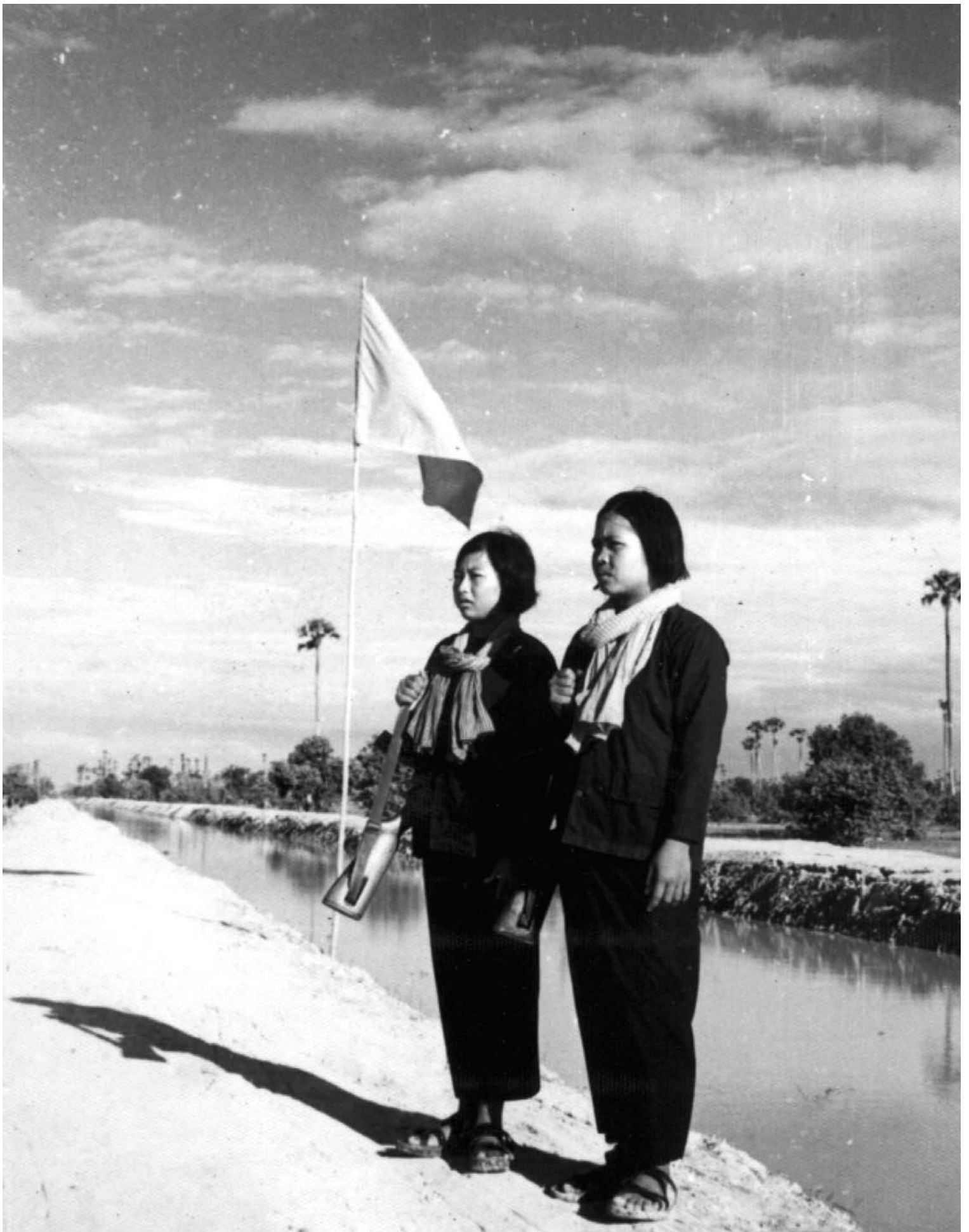
មជ្ឈមណ្ឌលឯកសារកម្ពុជា រក្សាសិទ្ធិខ្លួន ឆ្នាំ២០១២