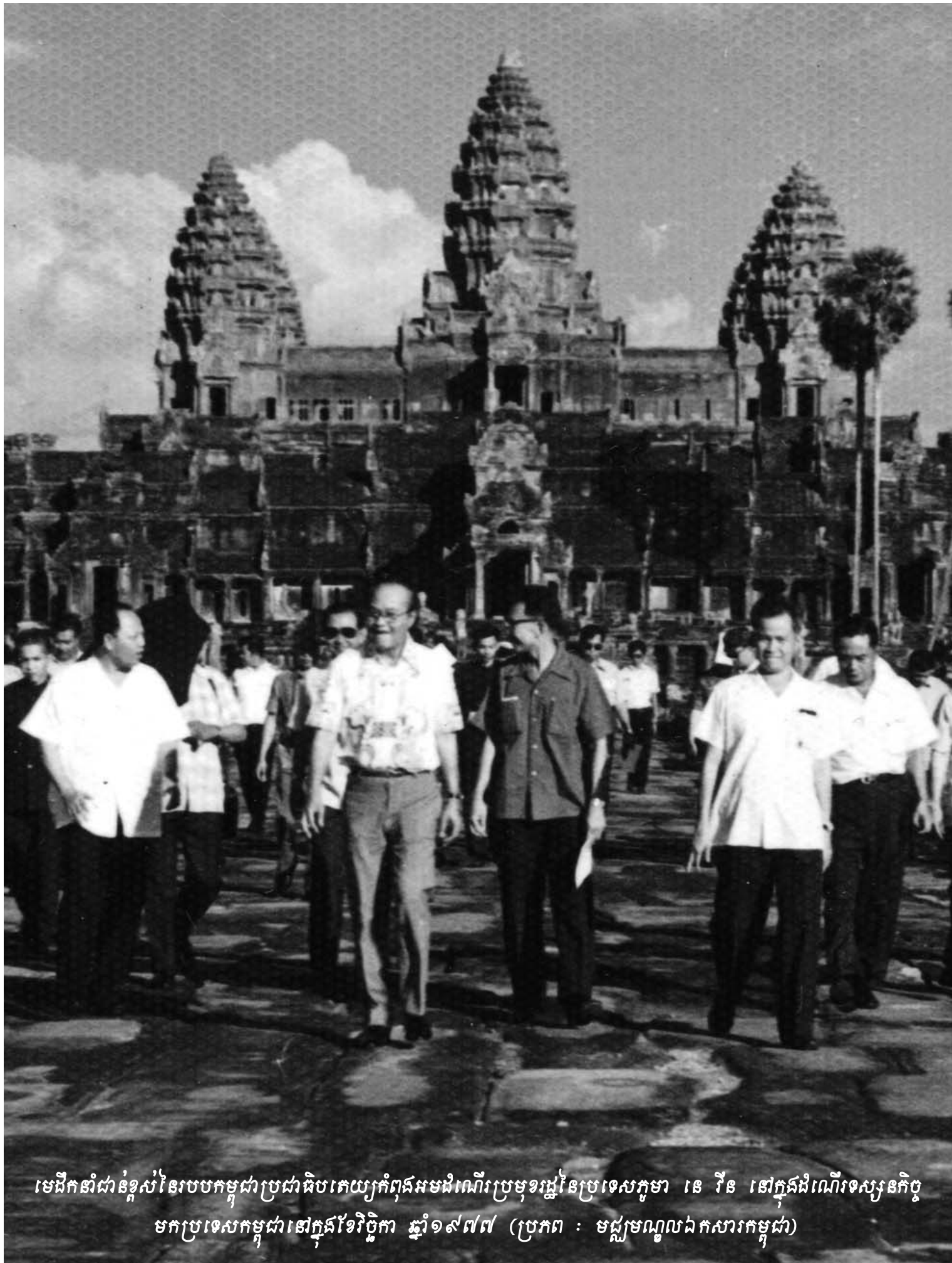
មេដឹកនាំជាន់ខ្ពស់នៃរបបកម្ពុជាប្រជាធិបតេយ្យកំពុងអមដំណើរប្រមុខរដ្ឋនៃប្រទេសកូរ៉េ នេ វីន នៅក្នុងដំណើរទស្សនកិច្ច មកប្រទេសកម្ពុជានៅក្នុងខែវិច្ឆិកា ឆ្នាំ១៩៧៧