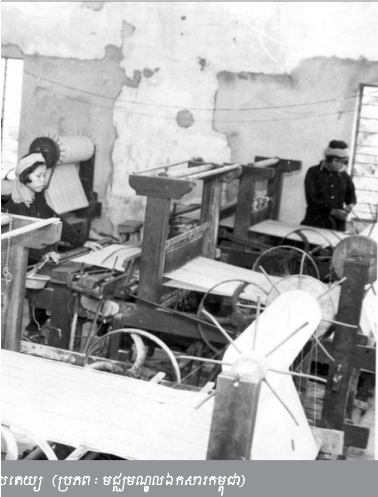
បកេយ្យ

មេធាវី សុន អរុណ បានធ្វើការតាំងសំណួរដោយផ្ដោតសំខាន់ លើការប្រជុំស្វ័យទិគ្យនៅសហករណ៍ត្រាចក្រោល ដែលពាក់ព័ន្ធនឹងការសម្លាប់មនុស្ស ។ ឡាយ បូនី បានបញ្ជាក់ដូចជា