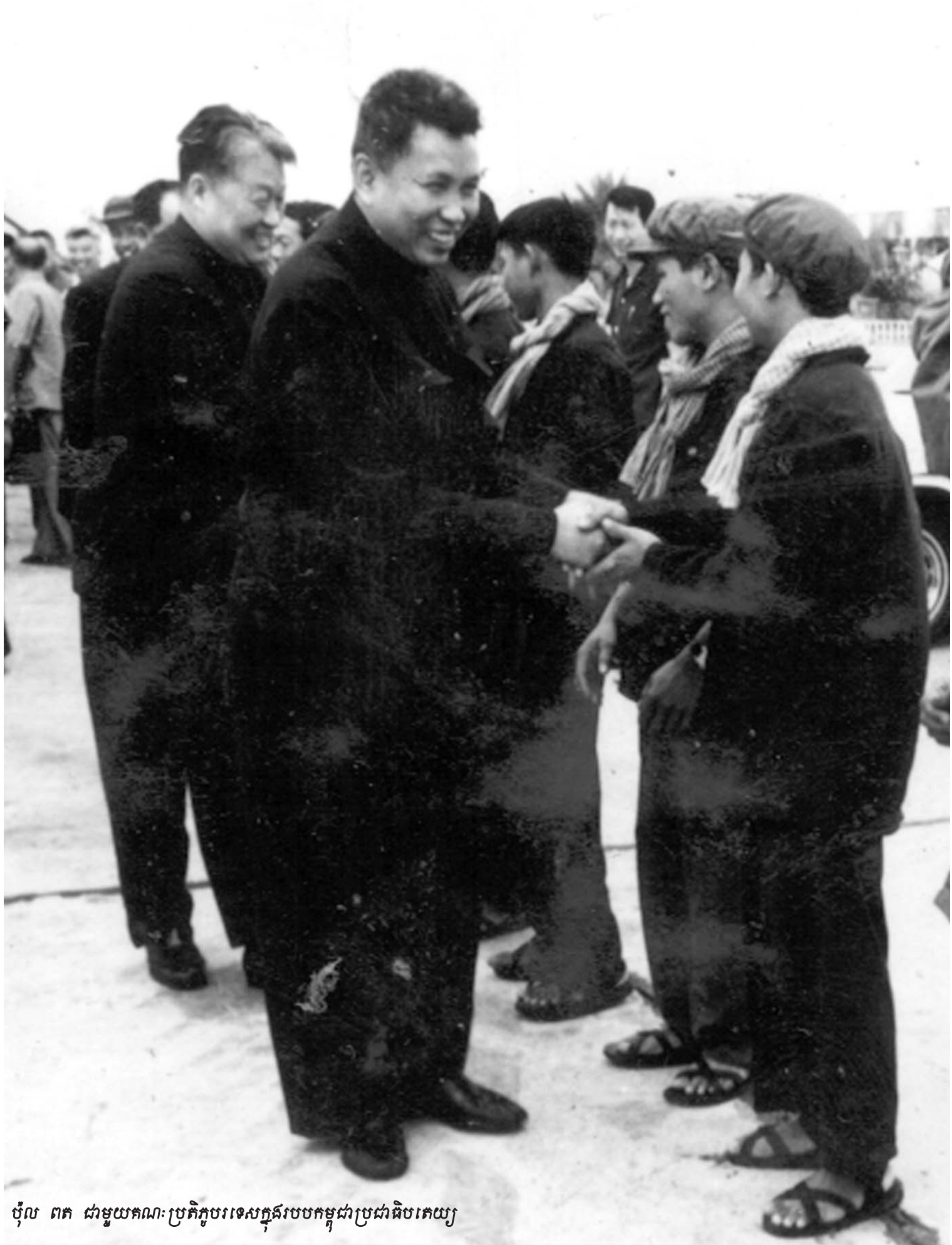
ថ្ងៃ ពត ជាមួយគណៈប្រតិភូបរទេសក្នុងរបបកម្ពុជាប្រជាធិបតេយ្យ