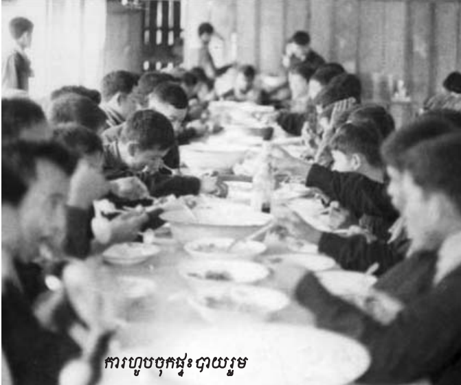
ការហូបចុកផ្ទះបាយរួម

សាក្សីបានជម្រាបថា ចំពោះដំណើរទស្សនកិច្ចនៅកូរ៉េខាង ជើង ដំបូង នួន ជា ទៅកន្លែង គឹម អ៊ុលស៊ុន ហើយក្រោយមកបន្ត ដំណើរទៅតំបន់ជនបទនៃប្រទេសនេះ ដែលមានសាក្សីជាអ្នកអម ដំណើរទៅជាមួយដែរ ។ ចំពោះសំណួរពាក់ព័ន្ធនឹងការរៀបចំម្ហូប នៅប្រទេសកូរ៉េថា តើខុសគ្នាយ៉ាងណាជាមួយម្ហូបអាហារនៅបប