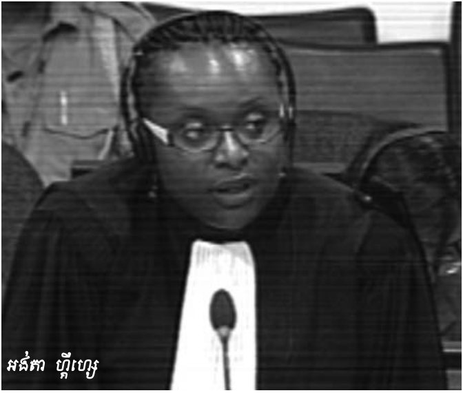
អង្គការ ហ្គីហ្សូ

នៅពេលចាប់ផ្តើមមេធាវីអន្តរជាតិការពារក្តី ខៀវ សំផន គឺមេធាវី អង្គការ ហ្គីហ្សូ បានសួរសាក្សីទាក់ទងនឹងរយៈកាល ដែលលោកសាក្សីបានធ្វើការនៅមន្ទីរក-១ ។ មេធាវី ហ្គីហ្សូ បានសួរថា តើសាក្សីមានការកត់សម្គាល់អ្វីទេនៅអំឡុងពេលដែល លោកនៅធ្វើការរយៈពេល៦ខែនៅមន្ទីរក-១? សាក្សីបាន បញ្ជាក់ថា ពេលខ្លះលោកស្នាក់នៅខាងក្នុងពេលខ្លះលោកស្នាក់ នៅខាងក្រៅនៃមន្ទីរនោះ ដូច្នោះលោកមិនអាចនិយាយឲ្យត្រឹមត្រូវ បានទេ ។ លោកបន្ថែមថា កន្លែងដែលលោកស្នាក់នៅ គឺកន្លែង