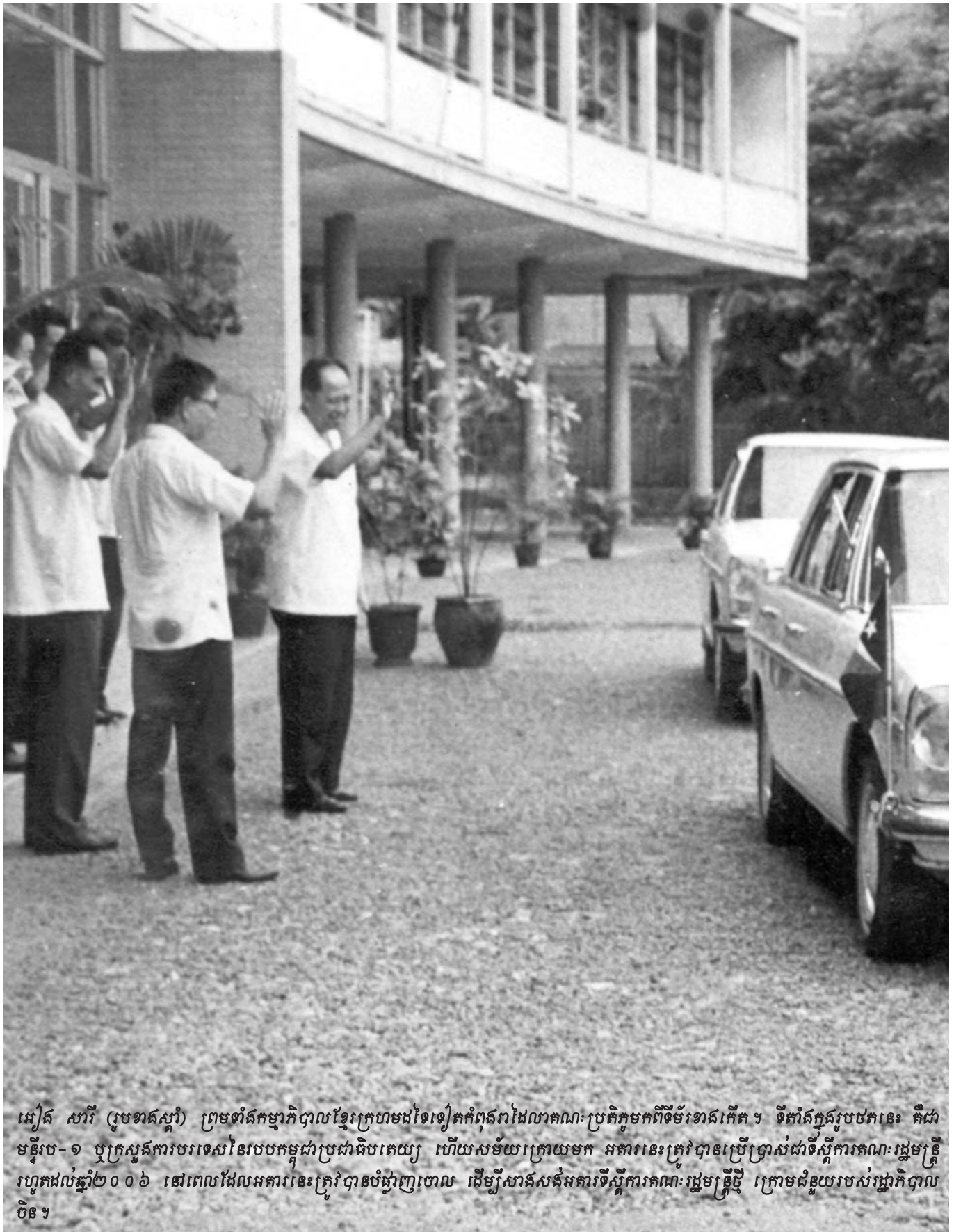
អៀង សារី (រូបខាងស្តាំ) ព្រមទាំងកម្មាភិបាលខ្មែរក្រហមដទៃទៀតកំពុងរំលែកវាចាណាម្នាក់ៗក្នុងកិច្ចប្រជុំក្នុងរូបថតនេះ គឺជាមន្ទីរ-១ ឬក្រសួងការបរទេសនៃរបបកម្ពុជាប្រជាធិបតេយ្យ ហើយសម័យក្រោយមក អគារនេះត្រូវបានប្រើប្រាស់ជាទីស្តីការគណៈរដ្ឋមន្ត្រីរហូតដល់ឆ្នាំ២០០៦ នៅពេលដែលអគារនេះត្រូវបានបំផ្លាញចោល ដើម្បីសាងសង់អគារទីស្តីការគណៈរដ្ឋមន្ត្រីថ្មី ក្រោមជំនួយរបស់រដ្ឋាភិបាលចិន។