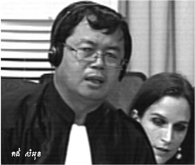
គង់ សំអុន

១៧៧៥ ប៉ុល ពត បានផ្លាស់ប្តូរទីតាំងកន្លែងធ្វើការរបស់ខ្លួនប៉ុន្មានដង? លោកសាក្សីបានឆ្លើយថា ការផ្លាស់ប្តូរទីតាំងធ្វើឡើងប្រហែលជាពីរឬបីដង ហើយទីតាំងចុងក្រោយដែលត្រូវបានផ្លាស់ទី គឺអាចធ្វើឡើងនៅក្នុងឆ្នាំ១៧៧៣ឬ១៧៧៤ ។ លោកសាក្សីបានពន្យល់បន្ថែមថា ការផ្លាស់ទីទីតាំងនៅមូលដ្ឋានចុងក្រោយនេះ គឺដើម្បីចូលឲ្យកាន់តែជិតនឹងបញ្ហាការកងទ័ពនៅទីក្រុងភ្នំពេញ និងដើម្បីភាពងាយស្រួលដល់ការជួបប្រជុំជាមួយនឹងកម្មាភិបាល ព្រោះវាមានទីតាំងស្ថិតនៅចំណុចកណ្តាល ។ បន្ទាប់មកលោកមេធាវីបានស្នើឲ្យលោកសាក្សីធ្វើការបញ្ជាក់ថា ហេតុអ្វីបានជាខ្មែរក្រហមជ្រើសរើសយកទីតាំងបញ្ហាការនៅក្នុងព្រៃ? លោកសាក្សីបានបញ្ជាក់យ៉ាងខ្លីថា គឺដើម្បីរក្សាការណ៍សម្ងាត់ឲ្យបានល្អ ។ ចំពោះស្ថានភាពទីតាំងនៅក្នុងព្រៃនោះ ត្រូវបានលោកសាក្សីរៀបរាប់ថា គឺគ្រាន់តែជាកូនខ្ទមតូចមួយ ប្រក់ស្លឹកពីខាងលើដែលអាចអង្គុយនិយាយគ្នាបាន ។ លោកបានបន្ថែមទៀតថា នៅពេលដែលមានភ្ញៀវទៅទីនោះ ដូចជា នួន ជា ខៀវ សំផន ឬអៀង សារី ពួកគេតែងតែរៀបចំខ្ទមតូចៗទាំងនោះ ដើម្បីឲ្យ ប៉ុល ពត ប្រជុំ ។