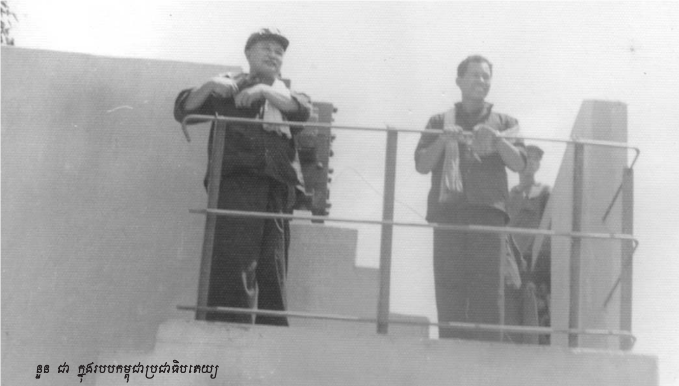
នួន ជា ក្នុងរបបកម្ពុជាប្រជាធិបតេយ្យ

យោងតាមការផ្តល់សក្ខីកម្ម ភាគច្រើនសាក្សី សូត្រ ឡើង មិនសូវបានដឹងពីអត្ថន័យនៃកិច្ច ប្រជុំនានាដែលជនជាប់ចោទ នួន ជា បានចូលរួមនៅក្នុងរបបកម្ពុជាប្រជាធិបតេយ្យប៉ុន្មានទេ ដោយ សារលោកតែងតែយាមកាមនៅខាងក្រៅបន្ទប់ ឬសាលប្រជុំ ។ លោកក៏មិនចាំ ថា តើមានអ្នកដឹកនាំ ចូលរួមក្នុងកិច្ចប្រជុំដែរទេ ឬក៏ នួន ជា ធ្លាប់បានលើកឡើងពីបញ្ហាជនក្សត្រីវង្សវាយឃាតណាឡើយ ដោយសារលោកនៅការពារពីខាងក្រៅ ។ ឆ្លើយតបនឹងការរំពួក