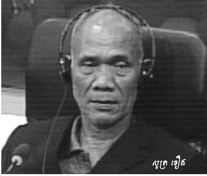
សូត្រ ឡឿង

អង្គជំនុំជម្រះសវនាការពិភាក្សាអំពីការអនុវត្តសិទ្ធិនៅស្ងៀមមិនឆ្លើយតបសំណួររបស់ជនជាប់ចោទ នួន ជា អង្គជំនុំជម្រះសាលាដំបូងបានបន្តសវនាការរបស់ខ្លួនដោយសួរដេញដោលសាក្សីមួយរូបទៀតទាក់ទងនឹងរចនាសម្ព័ន្ធរដ្ឋបាល និងប្រព័ន្ធនាំទំនាក់ទំនងការងារនៃរបបកម្ពុជាប្រជាធិបតេយ្យ។ សាក្សីដែលអង្គជំនុំជម្រះកោះហៅមក