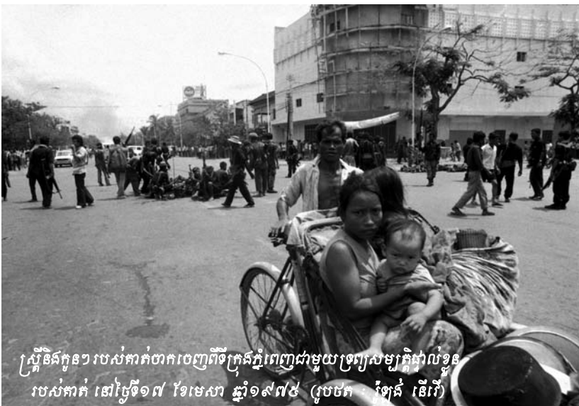
ស្ត្រីនិងកូនៗ របស់កាកបាទក្រហមព្រឹទ្ធក្រុងភ្នំពេញជាមួយប្រពន្ធសម្បត្តិផ្ទាល់ខ្លួន របស់កាក បាទក្រហម នៅថ្ងៃទី១៧ ខែមេសា ឆ្នាំ១៩៧៥

ឆ្លើយបត់នឹងការចោទសួររបស់តំណាងសហព្រះរាជអាជ្ញា ខុច បានផ្តល់សក្ខីកម្មថា នៅពេលជម្លៀសប្រជាជនចេញពីទីក្រុងភ្នំពេញ ខ្លួនរស់នៅអមលាន់ក្នុងឋានៈជាប្រធានមន្ទីរម-១៣នៅឡើយ ប៉ុន្តែខ្លួនបានដឹងពីការជម្លៀសនេះដោយសារមានប្រជាជនមួយ ចំនួនធំត្រូវបានជម្លៀសទៅអមលាន់ និងភាគរយៈមិត្តភក្តិរបស់ខ្លួនមួយចំនួនដែលបានឃើញការជម្លៀសប្រជាជនទៅតំបន់ផ្សេងៗ ។ ប្រជាជនត្រូវបានជម្លៀសចេញពីផ្ទះដោយបន្តិច ហើយគ្មានសិទ្ធិជ្រើសរើសទីកន្លែងដែលខ្លួនចង់ទៅឡើយ ។ ហេតុផល ដែល ខុច ហ៊ានអះអាងបែបនេះ