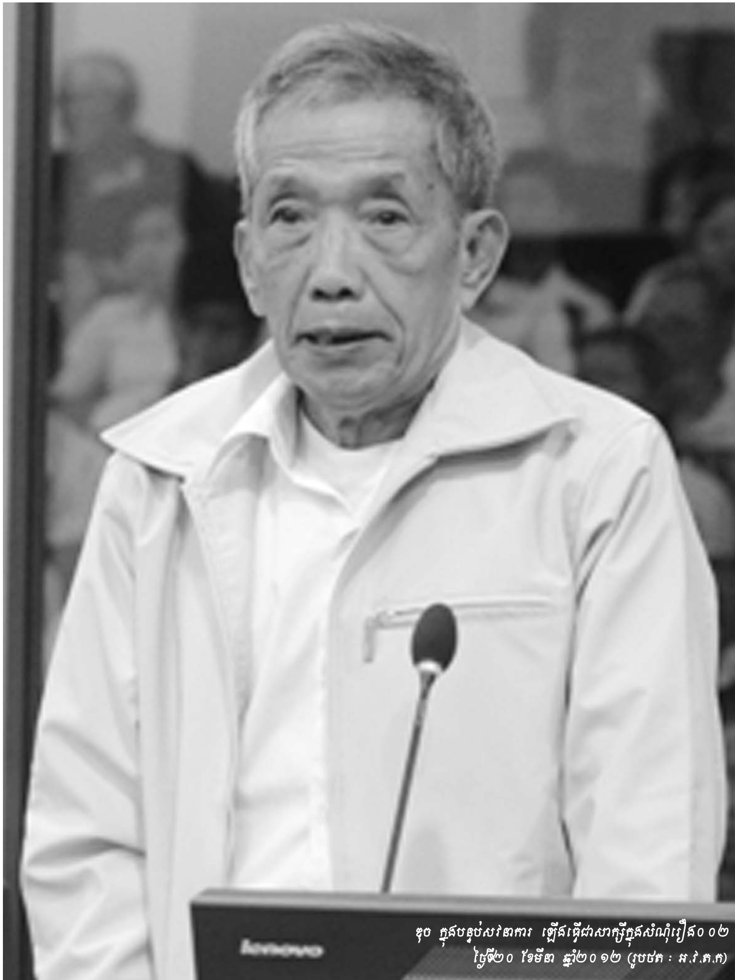
ឧប ក្នុងបន្ទប់សវនាការ ឡើងធ្វើជាសាក្សីក្នុងសំណុំរឿង០០២ ថ្ងៃទី២០ ខែមីនា ឆ្នាំ២០១២