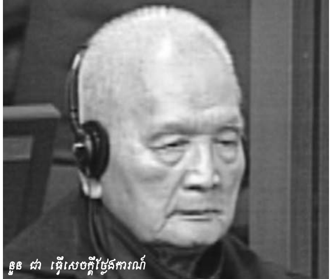
នួន ជា ធ្វើសេចក្តីថ្លែងការណ៍

និង២១ ហើយស្តាប់សក្ខីកម្មរបស់ ខុច នៅថ្ងៃទី២០ និង២២ ខែមីនា ។ ដោយជនជាប់ចោទនួន ជា បង្ហាញដំហែរមិនឆ្លើយតបនឹងសំណួរ ដូចនេះអង្គជំនុំជម្រះបានសម្រេចប្តូរការស្តាប់សក្ខីកម្មរបស់ ខុច ភ្លាមៗ មកពេលសៀវភៅថ្ងៃទី១៧ ដល់ទី១១ ខែមីនាវិញ ។