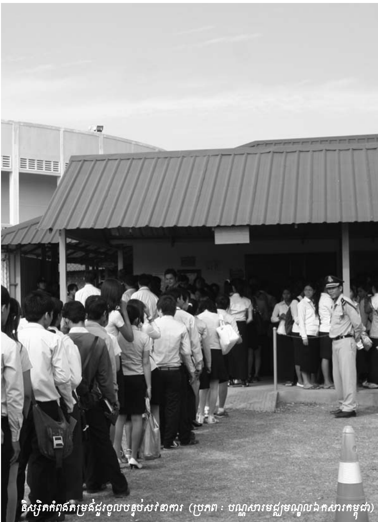
និស្សិតកំពុងត្រូវបង្ខំជួរចូលចំណុះសវនាការ

ប្រព្រឹត្តទៅក្នុងអំឡុងថ្ងៃទី១៧ មេសា ឆ្នាំ១៩៧៥ រហូតដល់ថ្ងៃទី៦ ខែមករា ឆ្នាំ១៩៧៩» ។