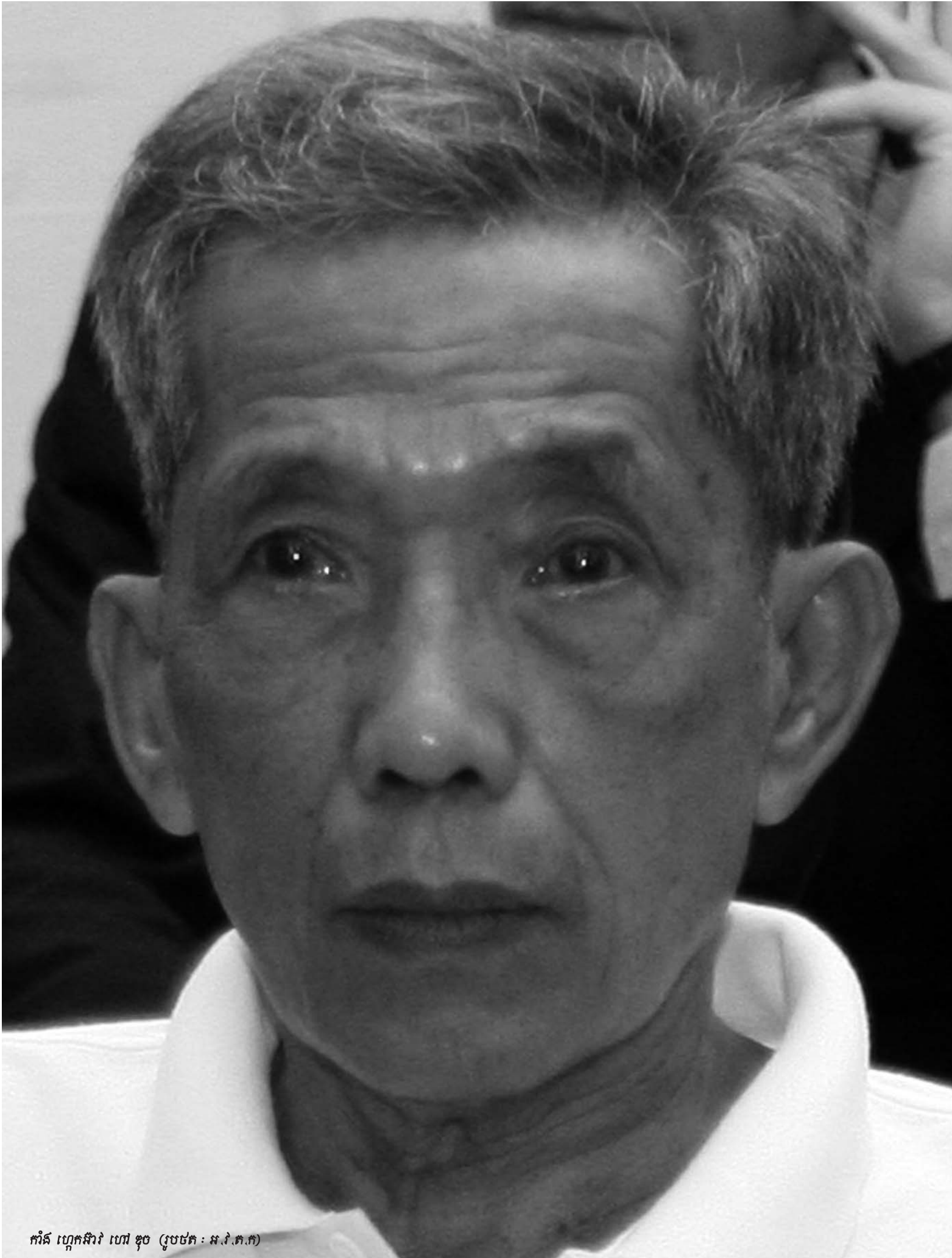
កំរិត ហ្គេកអ៊ាវ ហៅ ខូច