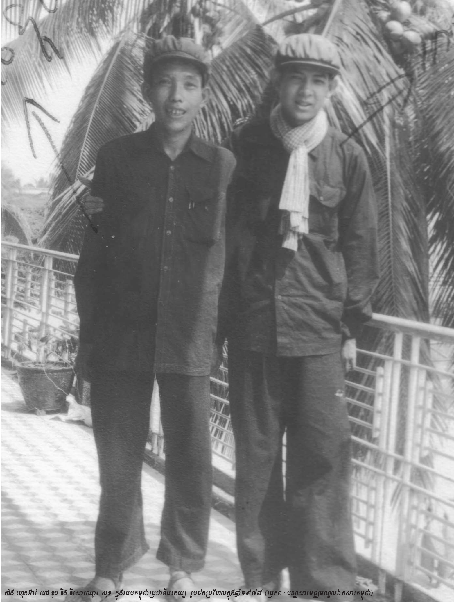
កាំង ហ្គុកស៊ីវ៉ា ហៅ ខុច និង និសារឈ្មោះ សុខ ក្នុងរបបកម្ពុជាប្រជាធិបតេយ្យ រួមថតប្រហែលក្នុងឆ្នាំ១៩៧៧