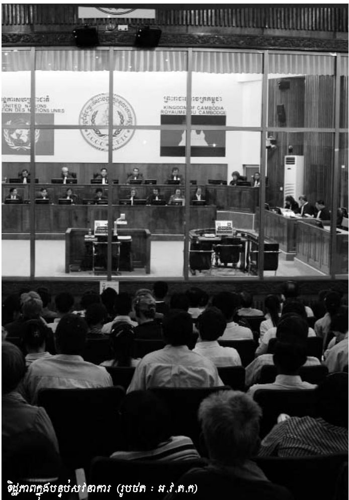
ទិដ្ឋភាពក្នុងបន្ទប់សវនាការ

២០០៧ ចែងថា “ក្នុងករណីដែលមានទំនាស់រវាងច្បាប់ និង បទបញ្ញត្តិផ្សេងៗ ជាមួយក្រមនេះ គេត្រូវអនុវត្តដោយអនុលោម តាមវិធានដែលមានចែងក្នុងកន្លឹកទី ១ នៃក្រមដដែលនេះ” ។ សហ ព្រះរាជអាជ្ញាបានលើកឡើងថា (មាត្រា ៦៦៨ កថាខណ្ឌទី ២ មិនគ្របដណ្តប់លើច្បាប់ព្រហ្មទណ្ឌដែលមានចរិតលក្ខណៈពិសេស នោះទេ មាត្រា ៦៦៨ កថាខណ្ឌទី ៣ នៃក្រមព្រហ្មទណ្ឌ ២០០៧) ។ មានន័យថា បើច្បាប់នៃអង្គជំនុំជម្រះវិសាមញ្ញក្នុងតុលាការ កម្ពុជា ជាច្បាប់ព្រហ្មទណ្ឌមានចរិតពិសេសនោះ ចៅក្រមត្រូវប្រើច្បាប់ អង្គជំនុំជម្រះវិសាមញ្ញក្នុងតុលាការកម្ពុជាដើម្បីកំណត់ក្នុងការផ្តន្ទា ទោស ។ សំណួរបានចោទសួរឡើងថា “តើច្បាប់អង្គជំនុំជម្រះ វិសាមញ្ញក្នុងតុលាការកម្ពុជា គឺជាច្បាប់ដែលមានចរិតពិសេសដែរ ឬទេ?” សហព្រះរាជអាជ្ញាយល់ថា ច្បាប់ស្តីពីការបង្កើតអង្គជំនុំ ជម្រះវិសាមញ្ញក្នុងតុលាការកម្ពុជា គឺជាច្បាប់ដែលមានចរិត លក្ខណៈពិសេស ដោយសារច្បាប់នេះ បានកំណត់ពីរចនាសម្ព័ន្ធ